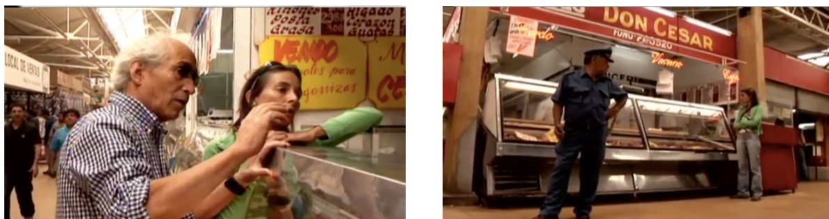
Figure 10 : Les deux photogrammes représentent la suite de l'altercation, la cinéaste est empêchée de filmer et est surveillée par un policier.

catholique encore très pesante au Chili. La mémoire collective générée par trente ans de silence met à mal l'investigation. Dans cette construction, la mémoire est muette et ne doit pas sortir du cadre, le témoin doit se taire pour reconstruire une nation vers l'avenir et non le passé.