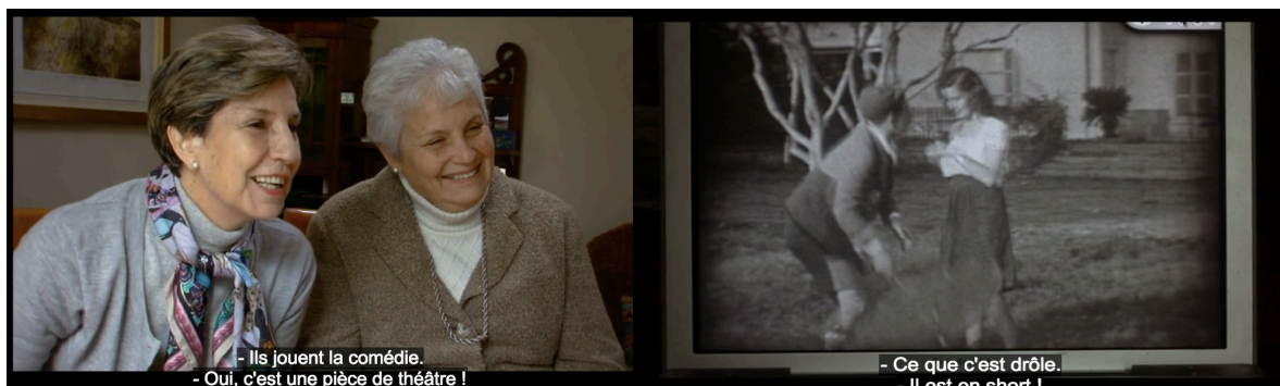
Figure 13 : Les deux photogrammes présentent la séquence de visionnage.

extension de la caméra. Elle déploie une frontière entre elle et l'appareil technique, visible par les choix des plans et par une caméra fixe toujours posée sur un trépied. Cependant, il existe bien une mise en abyme filmique dans le documentaire. La mise en scène du double écran se perçoit à travers la représentation du « visionnage » et permet un lien étroit entre objet filmé, cinéma et intime. Dans la dernière partie du film, la cinéaste invite sa mère et sa tante à visionner une vidéo dans le salon télé. A travers l'écran de l'ordinateur apparaît un film muet où est reconnaissable Salvador Allende. Très vite, le montage alterné met en valeur le cadre filmé des deux femmes puis dans un second temps, le film en insert avec par-dessus, la voix-over de la mère et de la tante. Par cette mise en abyme, la cinéaste Marcia Tambutti joue sur le rapport des cadres et sur la mise en scène du visionnage. L'interprétation de son propre travail n'est pas mis en lumière, il est davantage question d'insérer dans le documentaire un film de famille. La dimension cinématographique apparaît comme pour suggérer un lien familial autour du cinéma. [Figure 13].