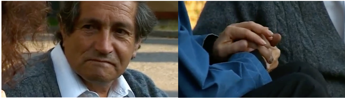
Figure 27 : Les deux photogrammes présentent deux plans consécutifs où la cinéaste libère l'espace filmique et se met en retrait tandis que le témoin dévoile une nouvelle parole.