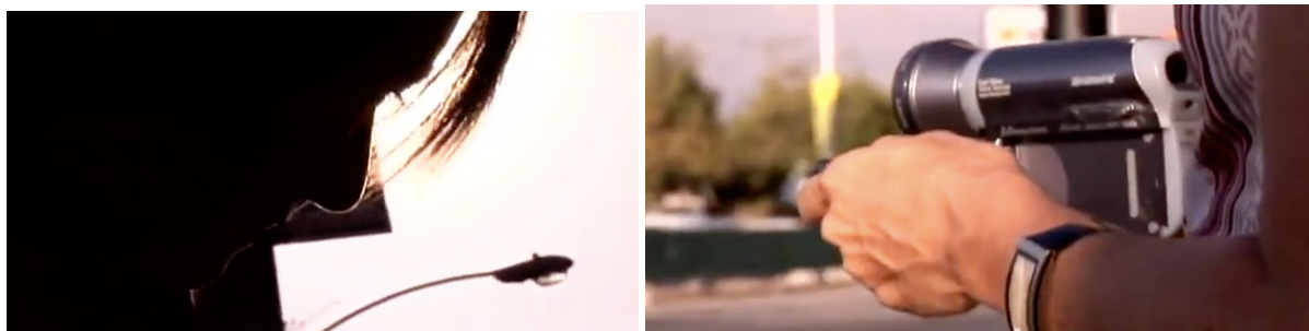
Figure 11 Les photogrammes présentent la cinéaste Lorena Giachino filmée par un caméraman.

La parole intime permet de déambuler dans un espace doublement filmique : l'espace du film et l'espace de réalisation, se rejoignant en un point culminant, la rencontre des deux médiums. Dans la seconde partie de Reinalda del Carmen, mi mamá y yo la cinéaste se rend dans un ancien centre de tortures devenu le bureau des archives de Santiago. La séquence s'ouvre sur un gros plan du visage de la cinéaste en contre jour. La caméra descend et filme la cinéaste en train de manipuler la caméra mini-DV. Puis la caméra omnisciente (car elle permet une vue d'ensemble) poursuit la ligne verticale par un travelling circulaire autour de la cinéaste, permettant d'observer l'angle de vue de la caméra mini-dv. [Figure 11]