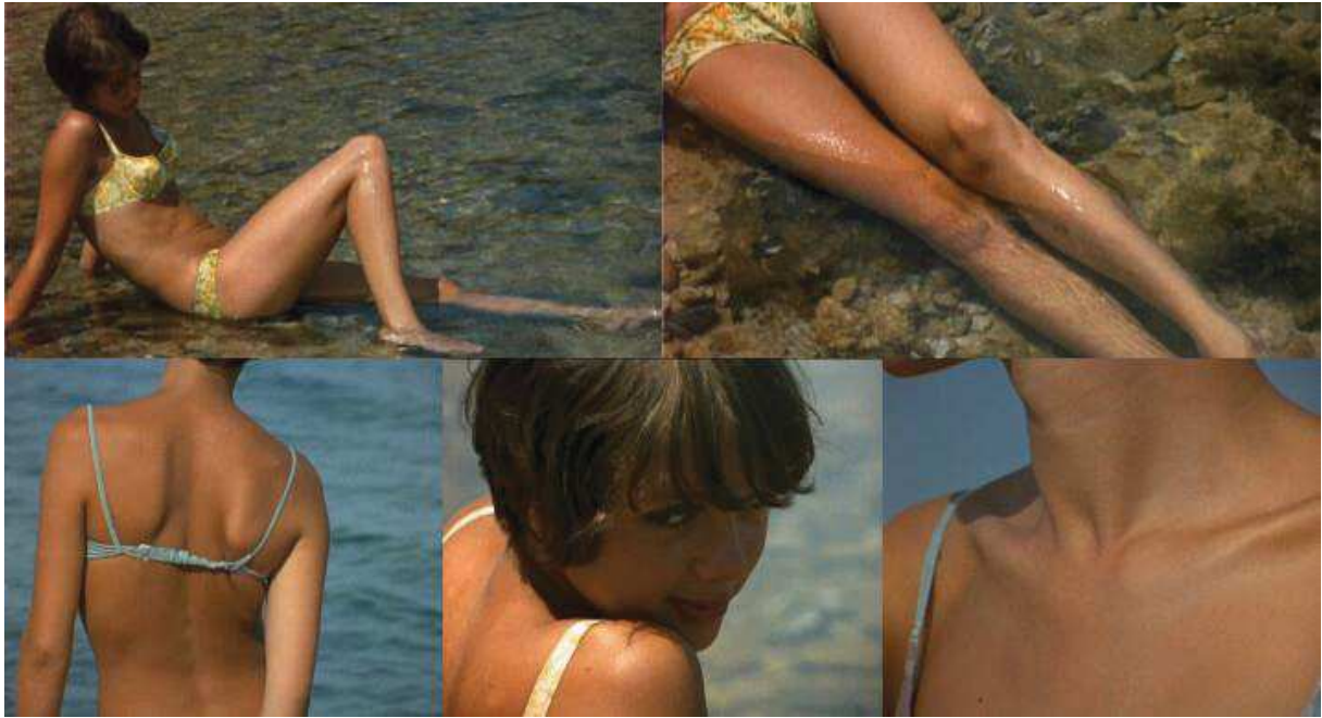
Annexe 8 : Hiroshima mon amour, Resnais