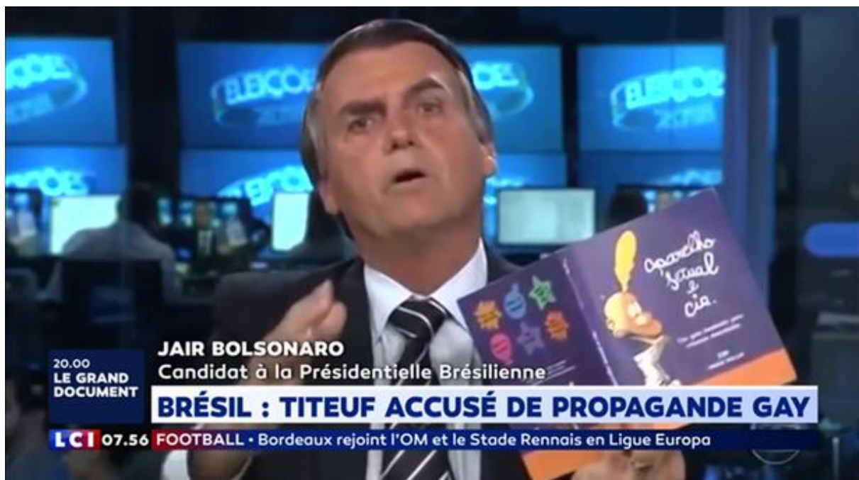
Fig. 4 : le candidat J.M Bolsonaro présentant sur Globo la traduction portugaise du Guide du zizi sexuel du dessinateur suisse ZEP comme un des contenus du soit-disant "kit gay" distribué aux enfants

anti-communistes (qui étaient monnaie courante sous le régime militaire) 95 , se traduisant dans la campagne par la hantise que le Brésil connaisse le sort de Cuba ou du Venezuela. L'historienne de la dictature remarque que pour J.M Bolsonaro le communisme serait omniprésent, jusqu'à prendre la « forme d'un travail de sape idéologique et culturel, par le biais des arts, des médias, des universités, de l'école, dans le sens d'une imprégnation marxiste, communautariste et anti-chrétienne » 96 . Dans une société déjà bien popularisée depuis au moins les manifestations pro-impeachment en 2016, le candidat d'extrême-droite a réussi à diviser la société en deux camps : d'un côté, le cidadão de bem (citoyen de bien) c'est-à-dire le travailleur brésilien honnête, hétérosexuel et défenseur de la famille traditionnelle brésilienne . De l'autre, les communistes ou les socialistes , c'est-à-dire toute personne qui, aux yeux de J.M Bolsonaro, défend les droits des minorités de genre, sexuelles ou raciales. Un « populisme horizontal » qui selon Raphaël Gutmann vise à exclure les « mauvais » Brésiliens des « bons » 97 . Le candidat et ses équipes ont fait de la lutte contre le péril pourpre un véritable leitmotiv de campagne ; comblant ainsi un programme fantomatique que J.M Bolsonaro avait bien du mal à défendre face aux caméras.