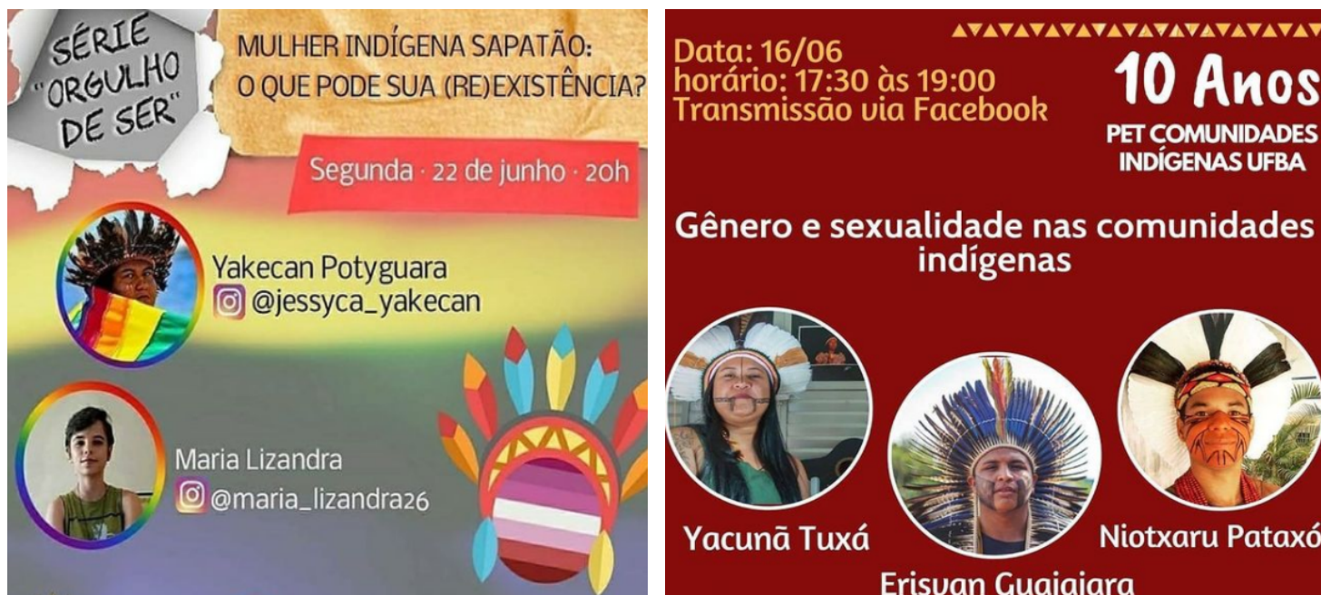
Figures 25 et 26 : exemples de webinaires organisés par le collectif Tibira.

A gauche: « Femme autochtone lesbienne : que peut ta (ré)existence ? »