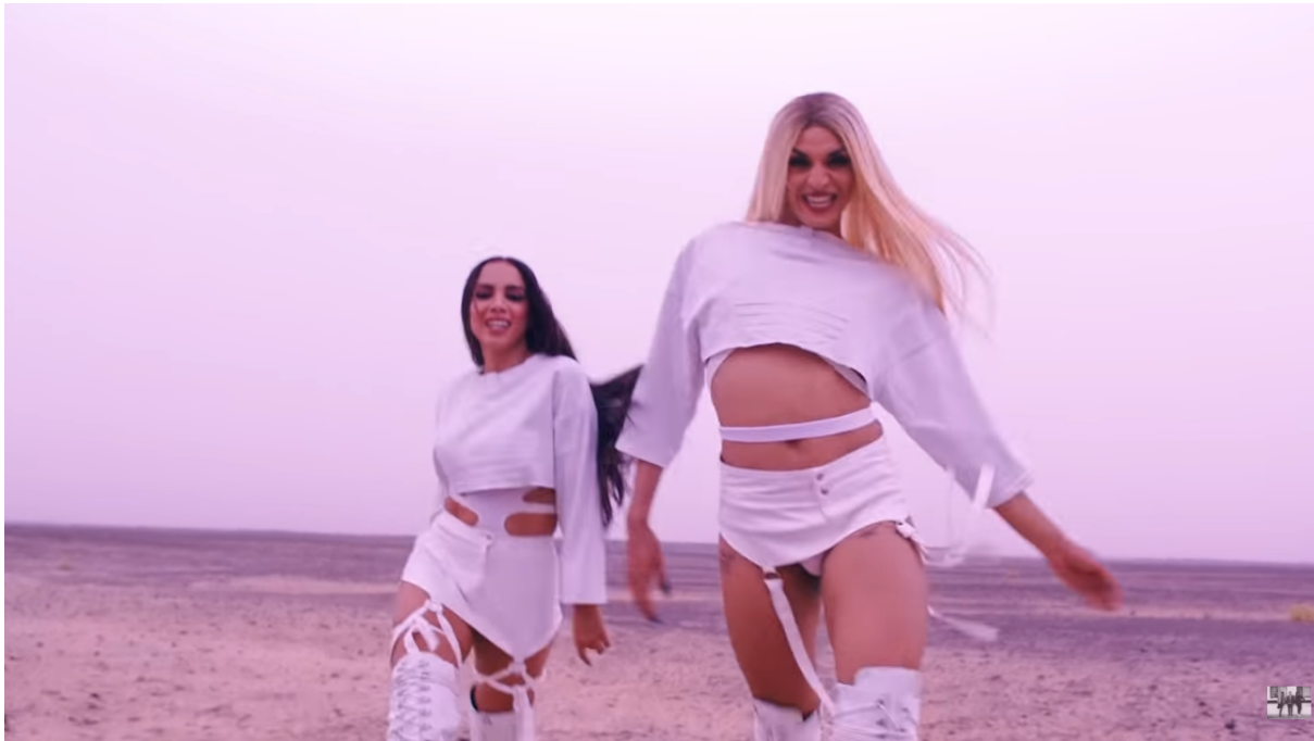
Fig. 31 : capture d'écran du vidéoclip « Sua Cara » avec Anitta et Pabllo Vittar

« carrière mondiale », comme celle-ci l'affirme à Globo en 2019 314 . Même si la pandémie de la COVID-19 a très certainement dû freiner ses ambitions, mon hypothèse est que la drag queen est devenue un élément incontournable du soft power brésilien à l'étranger, en tant qu'ambassadrice de la culture brésilienne. Aujourd'hui, la célébrité et la popularité de Pabllo Vittar dépasse en effet les frontières de son pays natal : en plein été 2017, elle et Larissa de Macedo Machado (plus communément appelée Anitta) collaborent avec les DJs du groupe australien Major Lazer, déjà fort de plusieurs milliards de vues avec leur chanson « Lean On ». De cette association naît le titre « Sua Cara » 315 , dont le vidéoclip est tourné au Maroc en plein désert du Sahara. A sa sortie sur la plateforme YouTube, celui-ci décroche deux records mondiaux : celui du nombre de mentions « j'aime » (1 million en à peine cinq heures et trente-huit minutes) et celui du nombre de vues cumulées en l'espace de vingt-quatre heures (17 millions) 316 . Aujourd'hui, elle en compte près d'un demi-milliard, ce qui fait d'elle l'une des vidéos lusophones les plus regardées sur Internet.