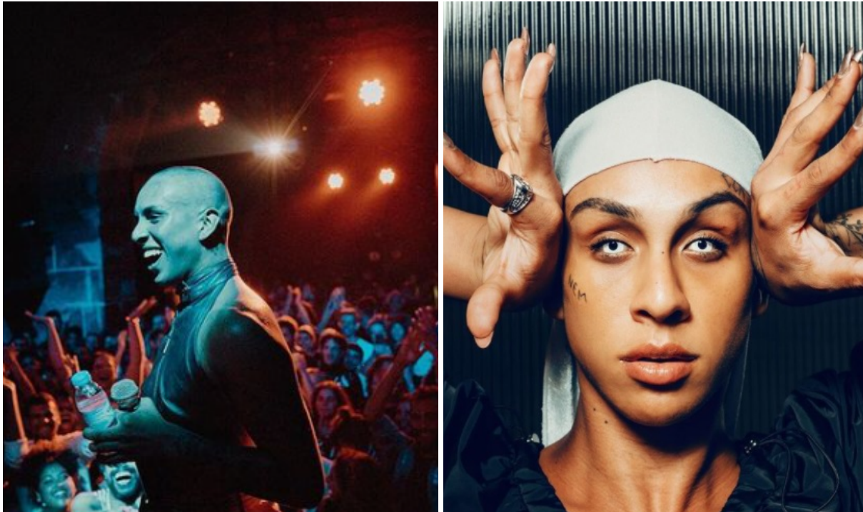
Figure 32 : Linn da Quebrada en concert en octobre 2018. Figure 33 : L'artiste lors d'un shooting pour Libération , en juin 2019 à Paris

provoquer « une friction, une fissure dans les discussions sur le genre » au sein du milieu artistique et culturel.