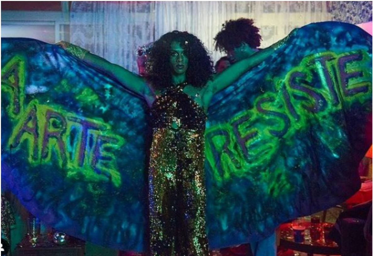
Figure 36 : Linn da Quebrada durant un concert

historique » dont souffrent encore les corps racisés, périphériques, dont la sexualité et le genre ne sont pas conformes aux normes de l'hétérocissexisme et de la blancheur.