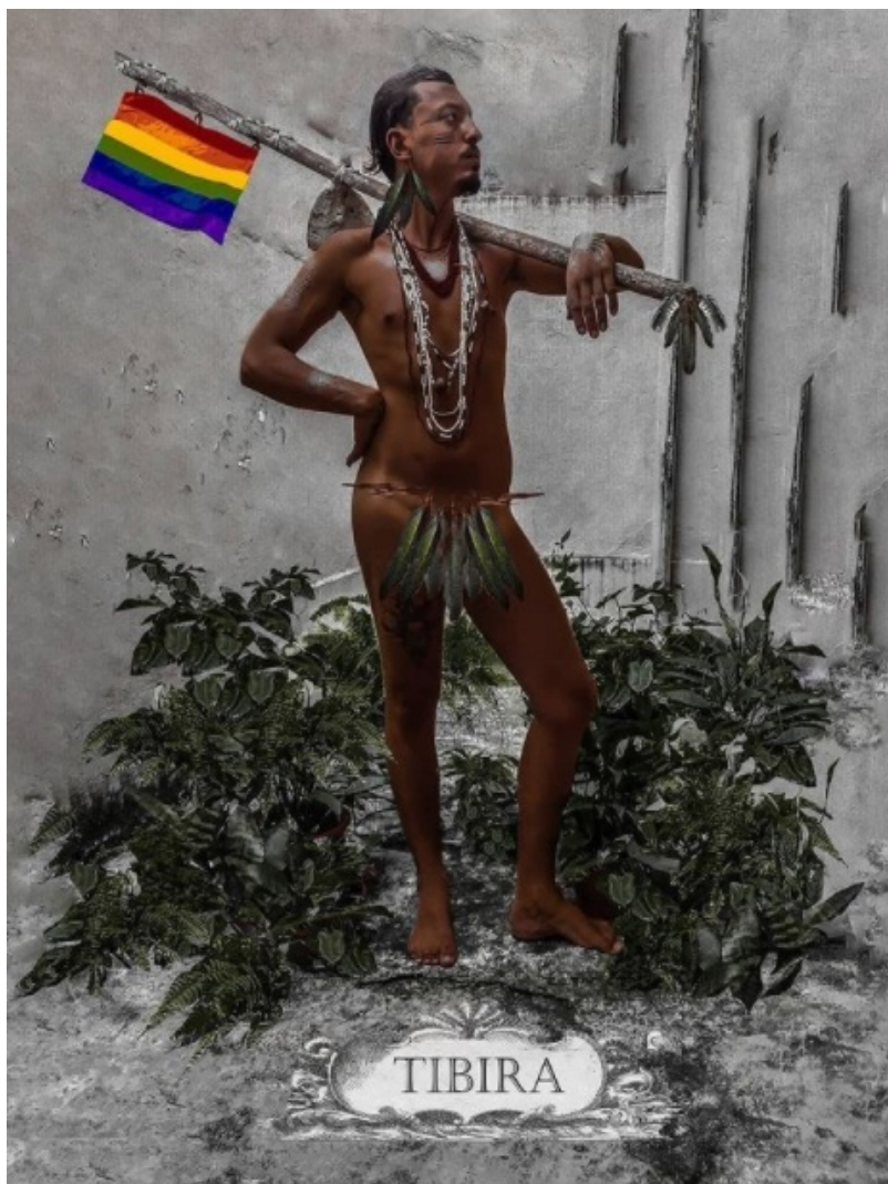
Figure 24 : vision d'artiste de Tibira do Maranhão par le photographe Kayto.

Kiga voit donc le collectif Tibira comme un « réseau de résistance » qui permet aux jeunes LGBTQI+ autochtones de se « fortifier » entre elles/eux, de trouver de l'aide et du soutien quand le besoin s'en fait sentir et de permettre de valoriser leur culture, leur identité et leur sexualité ; mises à mal par les normes de la blancheur et de l'hétéropatriarcat de la société brésilienne. Le nom du collectif, Tibira , est par ailleurs témoin de leur volonté de s'inscrire dans une