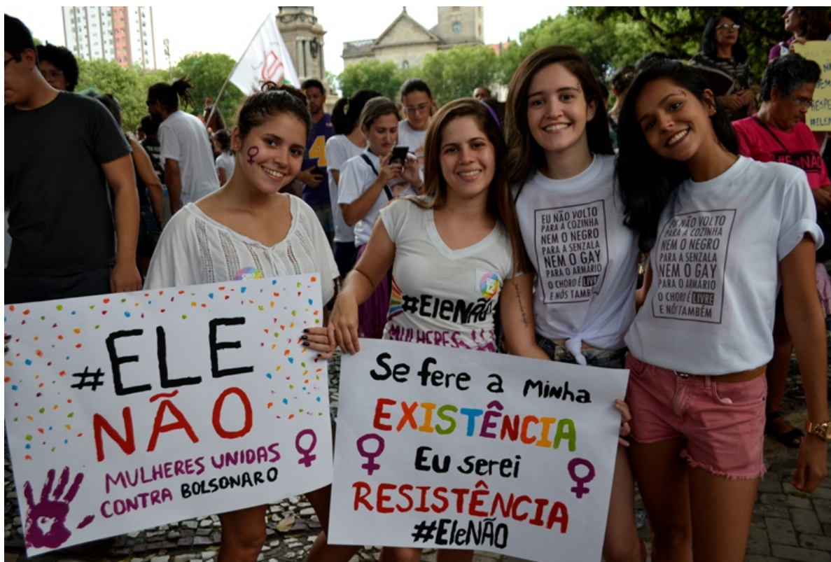
Fig. 10 : des étudiantes de Manaus manifestent en octobre 2018 contre le candidat Bolsonaro. On peut voir sur les pancartes les slogans « #EleNão » (#PasLui) et « Se fere a minha existência eu serei resistência » (Si tu menaces mon existence je serai résistance).