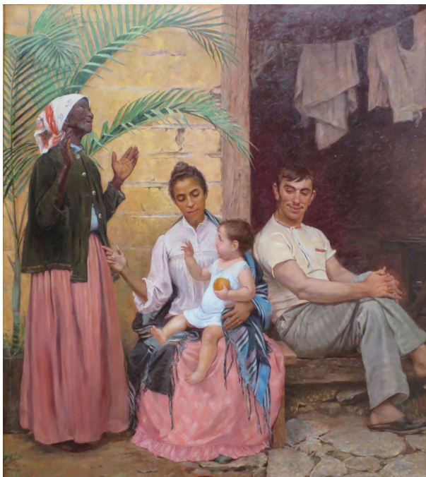
Figure 12 : Modesto Broco y Gomez, A redenção de Cam (La rédemption de Cham), 1895, huile sur toile, 199 x 160 cm, Musée des Beaux Arts de Rio de Janeiro. Il s'agit de la plus célèbre allégorie du « racisme par dénégation » dont parle Lélia González.

Dans son célèbre article La catégorie politico-culturelle de l'américanité , la pionnière du féminisme noir brésilien Lélia González (1935 - 1994) affirme que « le Brésil est une Amérique africaine » qui a volontairement dénié la présence et l'héritage culturel des populations noires déportées du continent africain pendant plus de trois siècles 207 . En rappelant que « celle