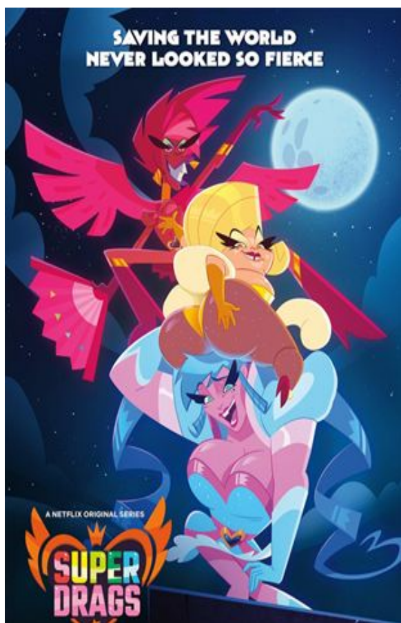
Figure 30 : affiche de Super Drags destinée au public anglophone

participation à la première série animée brésilienne diffusée sur Netflix, Superdrags .