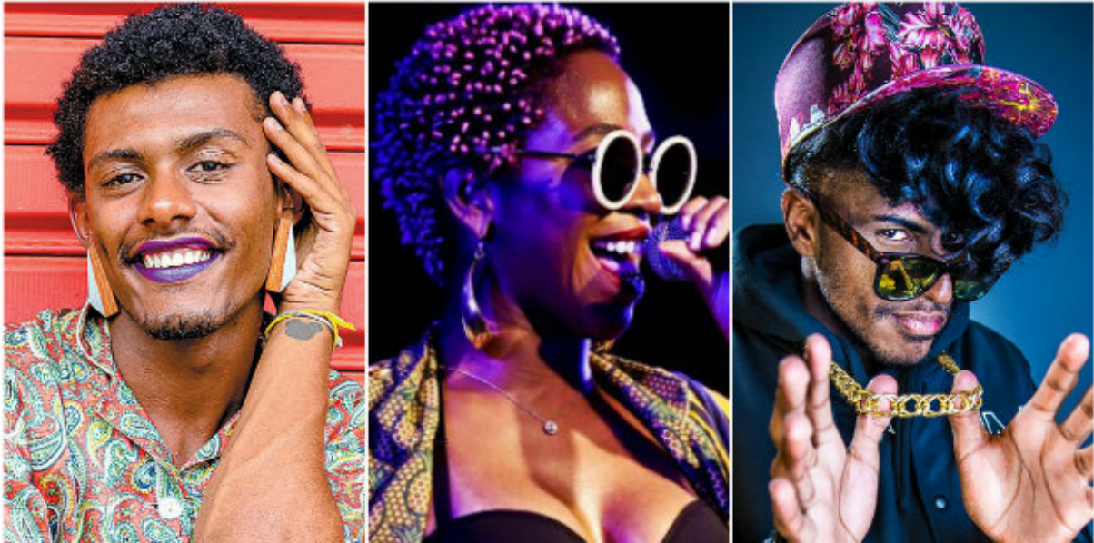
Figure 13 : Liniker, Karol Conká et Rico Dalasam, icônes musicales (parmi d'autres) de la Geração Tombamento (Génération Bascule).