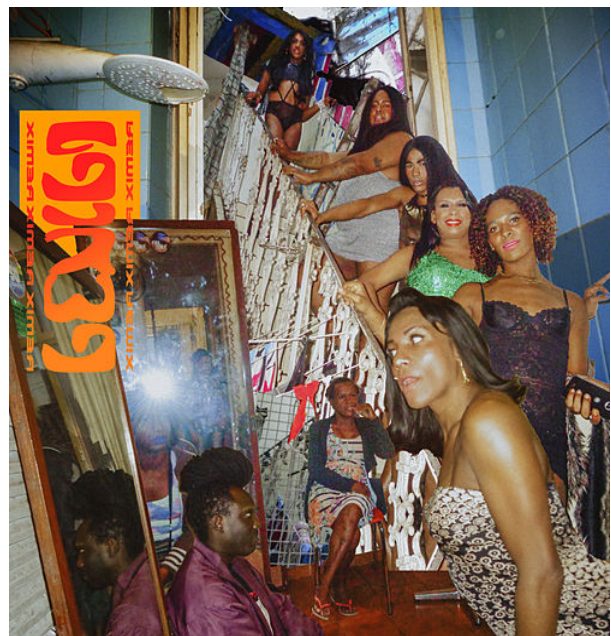
Figure 34: pochette du premier album Bixa Preta (2017) © Vivi Bacco.