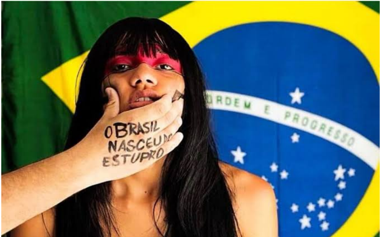
Figure 11 : « O Brasil nasceu do estupro » (Le Brésil est né du viol) © Bruna Nazario, 2017.