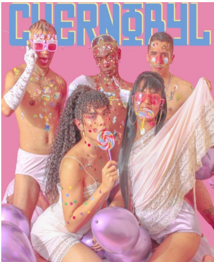
Figure 19 : Affiche de la Chernobyl (novembre 2019).

« Mon corps est un corps qui est déjà extrêmement marginalisé, c'est un corps qui me vulnérabilise quand je marche dans la rue : [ bouge ses mains ] je suis toujours insulté, parfois agressé, tout simplement à cause de l'ignorance des autres. Ma vie est résistance, tu vois ? Tout ce que je fais est un acte de résistance : me réveiller le matin et acheter du pain à la boulangerie est déjà un acte de résistance... Être entouré de personnes qui me veulent du mal et continuer à vivre, c'est déjà un acte de résistance, tu comprends ? Je vis ici à São Paulo dans un quartier très militaire, c'est quelque chose que je ressens donc dans la peau : les personnes me regardent toujours d'un œil différent, font des messes basses quand je passe sur leur chemin... Je suis en train de négocier ma vie tout le temps ! Je pose le pied dans la rue, je négocie ma vie, je négocie mon existence avec d'autres. J'ai souvent peur, car, je sais qu'à tout moment un fou peut vouloir me tuer pour un rien, tu vois ? »