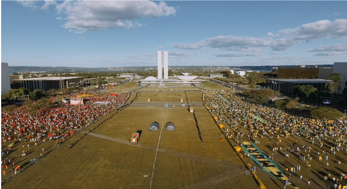
Figure 2 : Manifestations anti et pro-impéachment à Brasília, le jour du vote le 17 avril 2016 © Le Procès (O Processo), Maria Augusta Ramos

141 victimes entre janvier 2019 et mai 2019, avec en moyenne une personne LGBTQI+ qui meurt assassinée ou qui est poussée au suicide toutes les vingt trois heures.