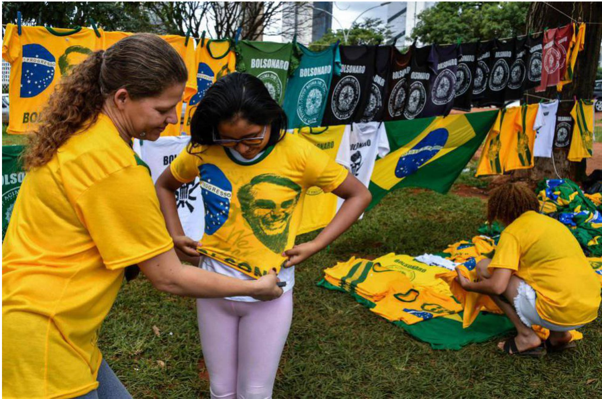
Fig. 5 : Vente de tee-shirts verts et jaunes à l'effigie du candidat J.M Bolsonaro à Brasília, en octobre 2018

Paulo Guedes défendent un agenda ultra-libéral avec toujours plus de privatisations et un alignement géopolitique complet avec les Etats-Unis d'Amérique et son allié Israël.