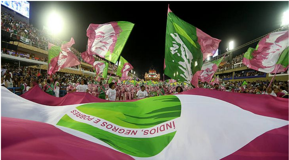
Fig. 3 : L'école de samba de Mangueira rend hommage pendant le carnaval de 2019 à Marielle Franco et aux populations visées par la nécropolitique étatique (Indiens, Noirs et Pauvres)

minorités écrasées pendant 500 ans de Brésil » 69 . Selon les derniers éléments de l'enquête, le clan Bolsonaro (notamment le fils du président, Flavio, conseiller municipal de Rio également) semble être de plus en plus lié à cette exécution sommaire 70 . L'assassinat de Marielle Franco a provoqué un vif émoi au sein de la communauté brésilienne, comme le montrent ces images de centaines de milliers de cariocas qui se sont rendus à ses funérailles en clamant « Marielle presente ! ». Bien que l'identité des commanditaires reste encore mystérieuse, le caractère politique de sa mort est difficilement réfutable. Elle est en effet à l'origine de seize propositions qui ont permis aux populations pauvres et périphériques laissées à l'abandon d'avoir un meilleur accès à l'éducation, à la santé, à la démocratie. A travers ses convictions et sa résistance transversale contre le racisme, le sexisme et les LGBTIphobies, elle était une cible de choix pour une droite conservatrice proche des milices et des mouvements néo-pentecôtistes radicaux (dont est issu l'ancien maire de Rio de Janeiro, Marcelo Crivella) qui se montrent particulièrement virulente contre les féministes et les anti-racistes.