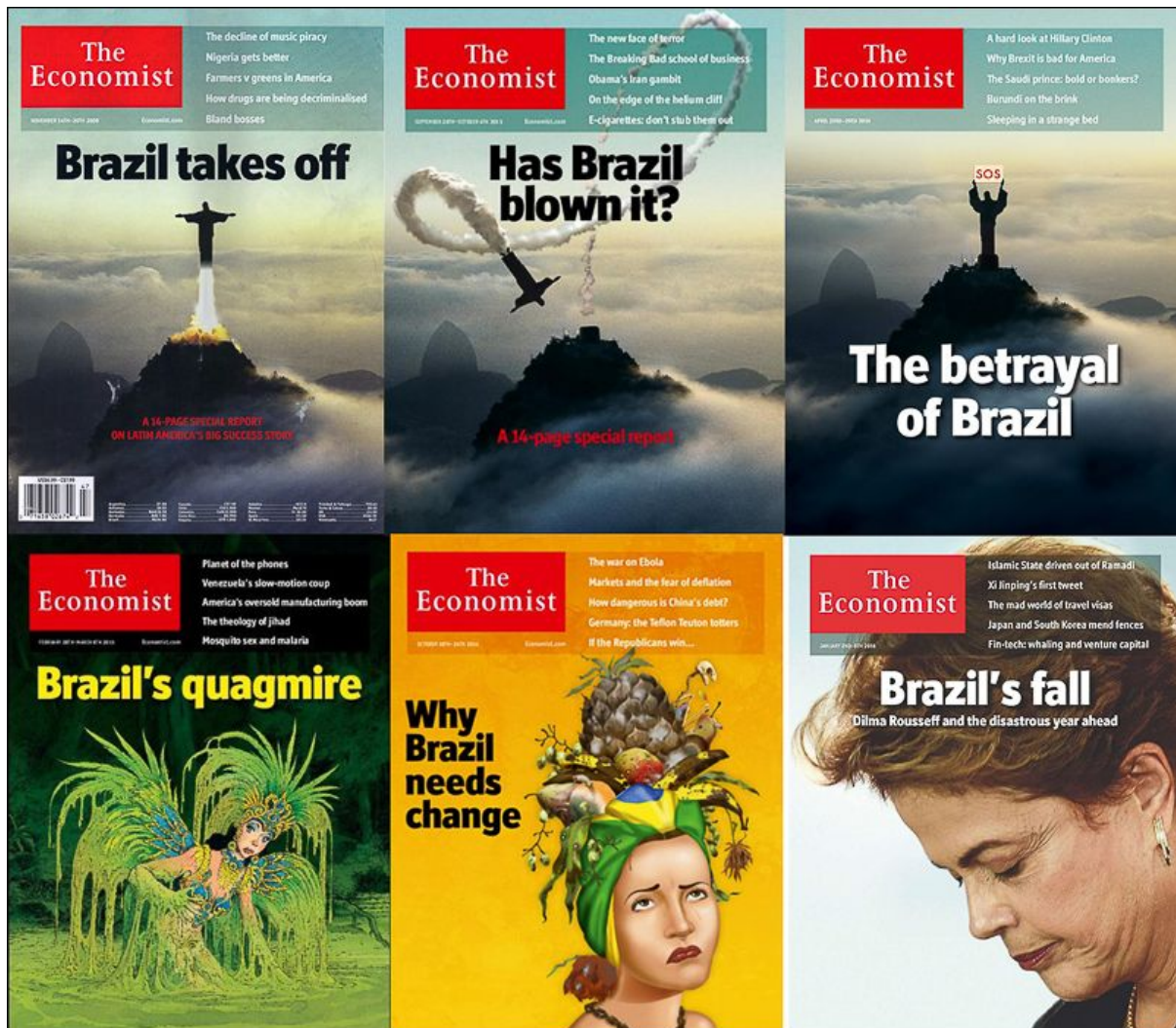
Figure 1 : Couvertures du magazine The Economist