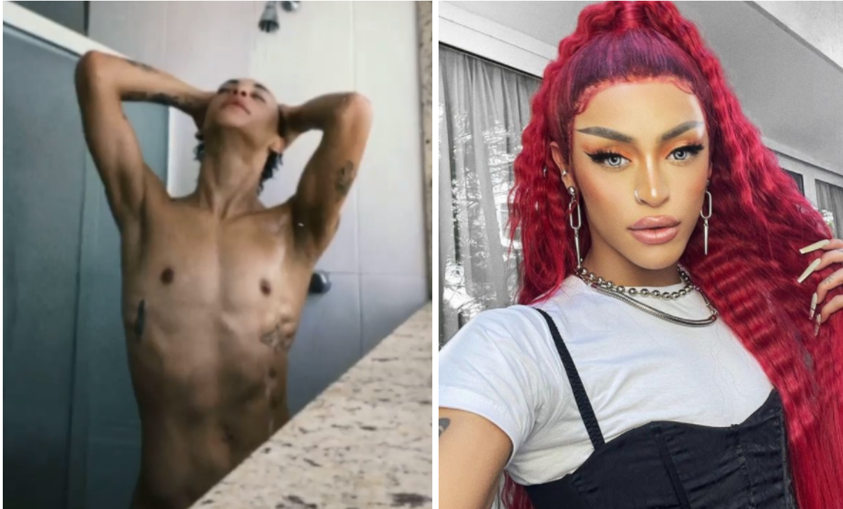
Figures 28 et 29 : les deux facettes du « corps-média » de Pabllo Vittar.

Icône médiatique qui affiche le souci de contrôler l'image qu'elle offre au monde, Pabllo Vittar est en outre devenue un élément incontournable de la représentativité de la communauté queer . Ce processus est une clé de voûte pour comprendre la résistance politique et culturelle des populations marginalisées (en raison de leur couleur de peau, de leur identité de genre, de leur orientation sexuelle, de leur classe sociale...), séculairement contraintes au silence, à l'effacement, et à la politique de mort. J'appelle donc représentativité le fait qu'un individu issu des groupes sociaux minoritaires ait réussi à conquérir des territoires qui lui étaient autrefois refusés par la société. Rendu visible, il possède dès lors une « aptitude d'agir, de parler au nom de quelqu'un d'autre » 298 et peut non seulement défendre les intérêts de sa communauté mais aussi déconstruire l'image négative qui pouvait être accolée à celle-ci. Il existe différents régimes de représentativité, qui peuvent se combiner chez une personne participant à la représentativité de son/ses groupe(s) d'origine : elle ainsi peut être