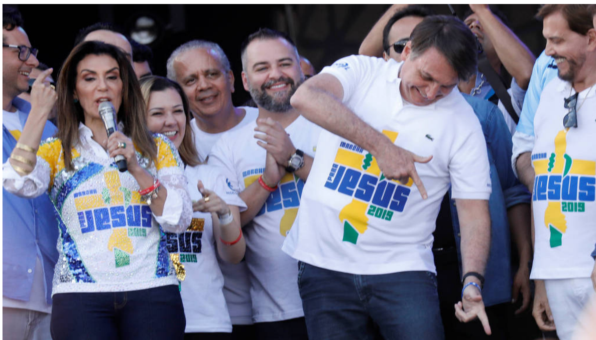
Fig. 6 : le président J.M Bolsonaro faisant les “arminhas” (petites armes) sur la scène de la Marche pour Jésus à São Paulo en juin 2019, auprès de son organisatrice la pasteure pentecôtiste Sônia Hernandes