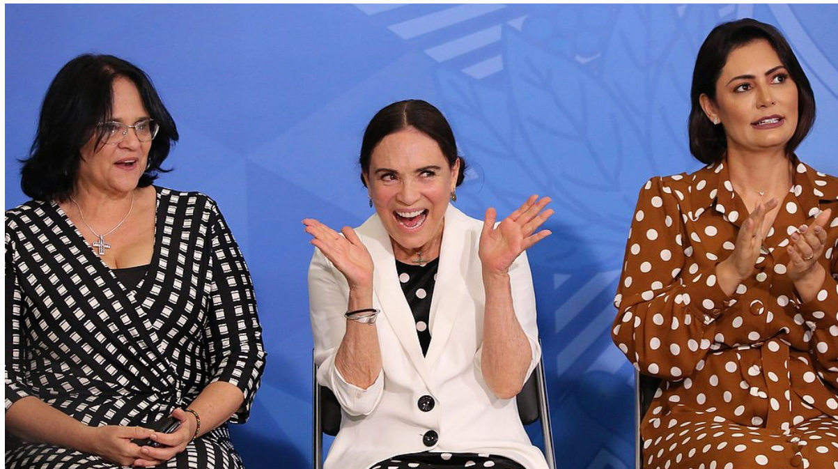
Fig. 7 : Damares Alves (gauche) auprès de l'ancienne Secrétaire de la Culture Regina Duarte (centre) et de Michelle Bolsonaro en mars 2020

choisi le Brésil comme laboratoire de cette théorie, mais nous leur répondons que la blague à assez durée, que nos enfants ne sont pas des cobayes » 153 .