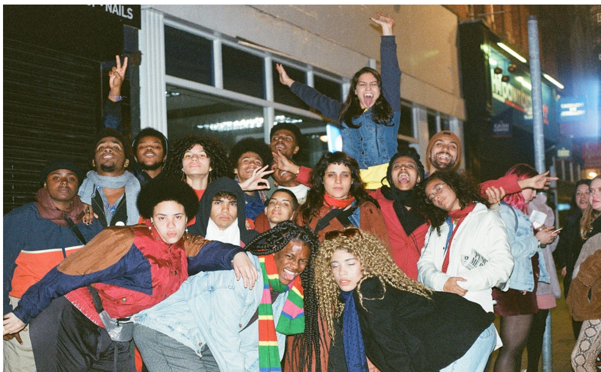
Figure 14: une partie de la Coletiva Ocupação à Leeds (Royaume-Uni) en 2019