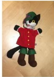
Fiche enquête de Monsieur Chat N° 1

MONSIEUR CHAT CHERCHE LES LANGUES QUI SONT PARLEES A L'ECOLE ET DANS LES FAMILLES DU QUARTIER.