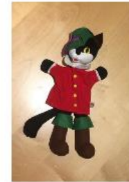
Fiche enquête de Monsieur Chat N° 1

MONSIEUR CHAT CHERCHE LES LANGUES QUI SONT PARLEES A L'ECOLE ET DANS LES FAMILLES DU QUARTIER.