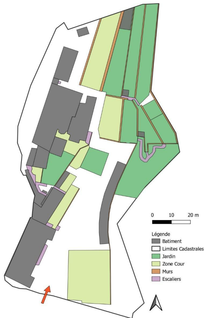
Figure 2. : Plan géoréférencé du tiers-lieu Sainte Marthe à Grasse (06)

Mes savoir-faire acquis en master m'ont notamment permis de réaliser une carte vectorielle et géoréférencée du tiers-lieu en vue du dessus verticale, qui n'existait pas avant cela, et qui m'a été nécessaire pour penser l'implantation du système et estimer les longueurs de tuyau nécessaires pour distribuer le stockage de l'eau sur le tiers-lieu. Ce plan est maintenant disponible sur le cloud de TETRIS, et accessible à toutes les personnes du tiers-lieu qui le souhaitent.