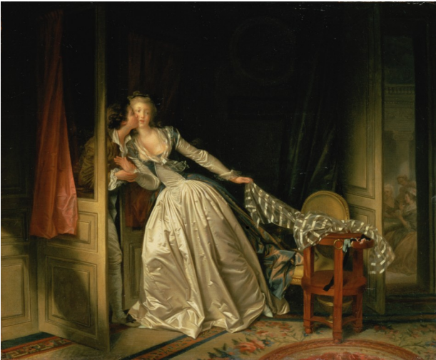
J-H Fragonard, Le Baiser à la dérobée