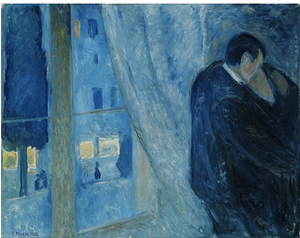
Edvard Munch, Baiser à la fenêtre