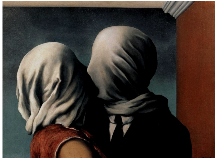
René Magritte, Les Amants I