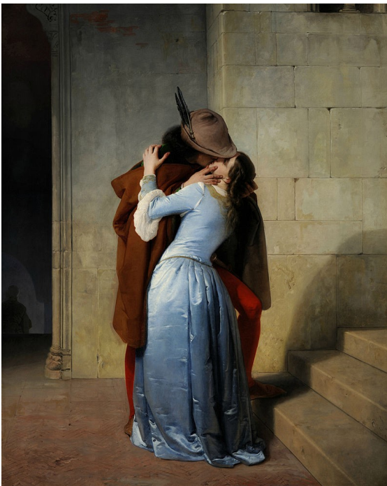
Francesco Hayez, Le Baiser