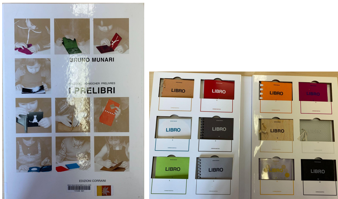
Livre d'éveil Bruno Munari

Un auteur incontournable pour ce qui est de l'éveil de l'enfant à travers les livres, est l'auteur Bruno Munari, qui à travers ses œuvres arrive à transporter le bébé dans un univers de découverte.