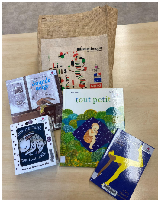
Annexe 6 - Les sacs à histoire