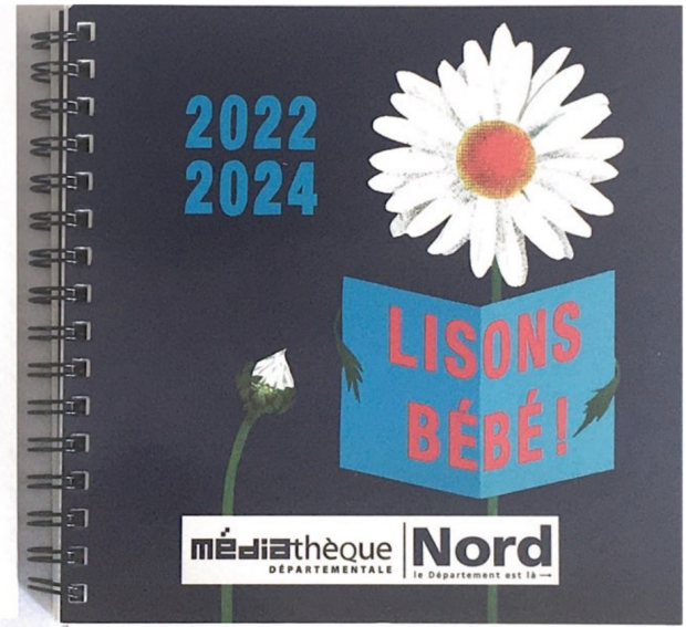
Annexe 5 - Exemples des deux derniers « Lisons Bébé ! »