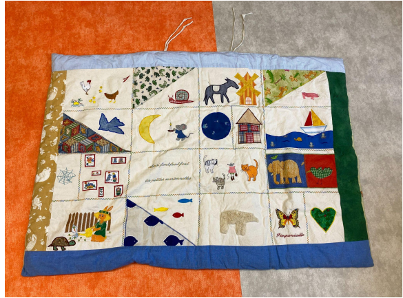
Annexe 4 - Tapis de lecture Étang et Comptines