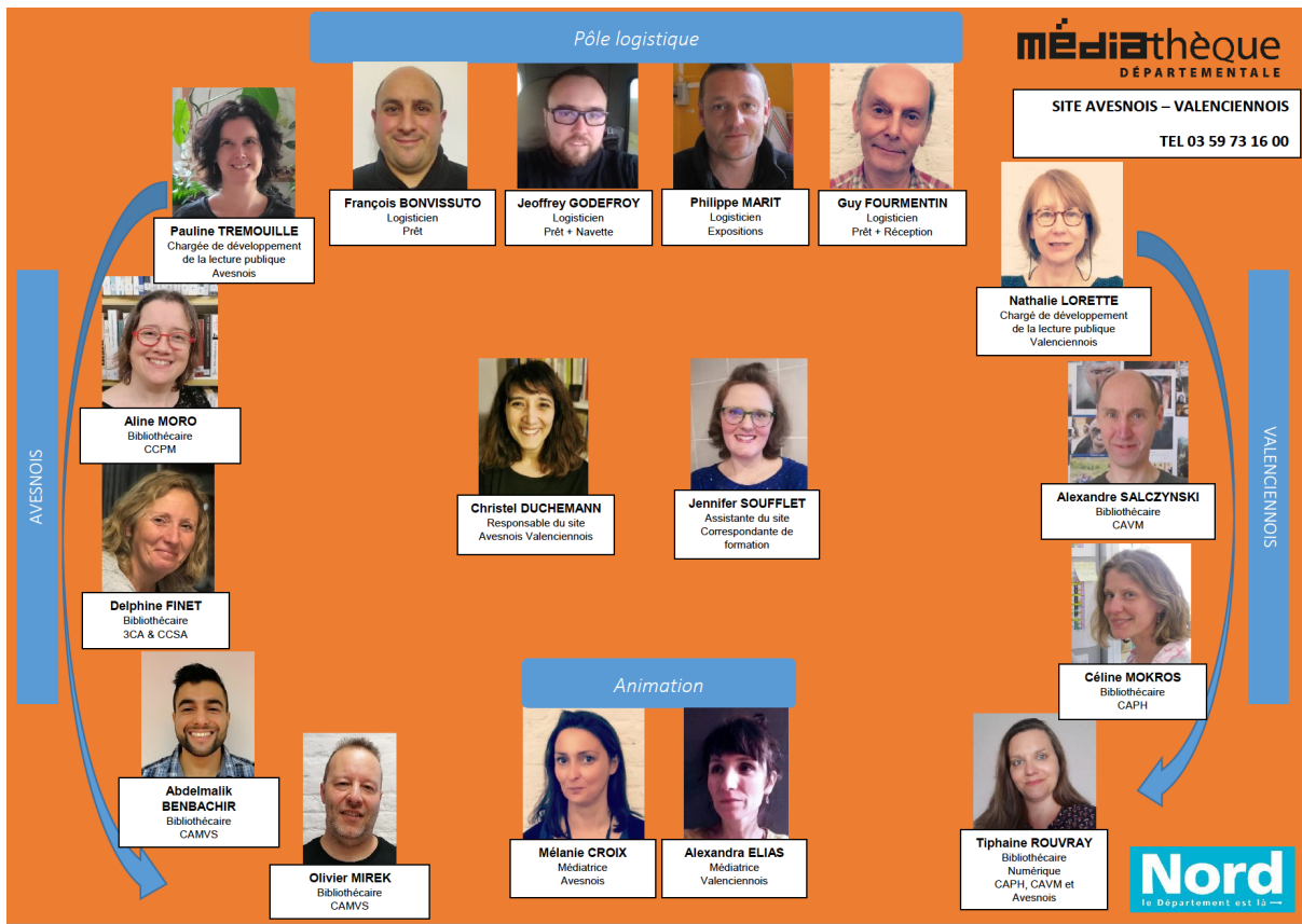
Annexe 2 - Trombinoscope de l'équipe du site Avesnois-Valenciennois