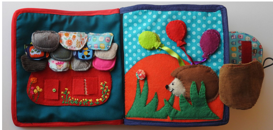
Livre à texture

rendre compte de son environnement en incluant des objets ludiques, qui permettent à l'enfant de développer sa propre motricité.