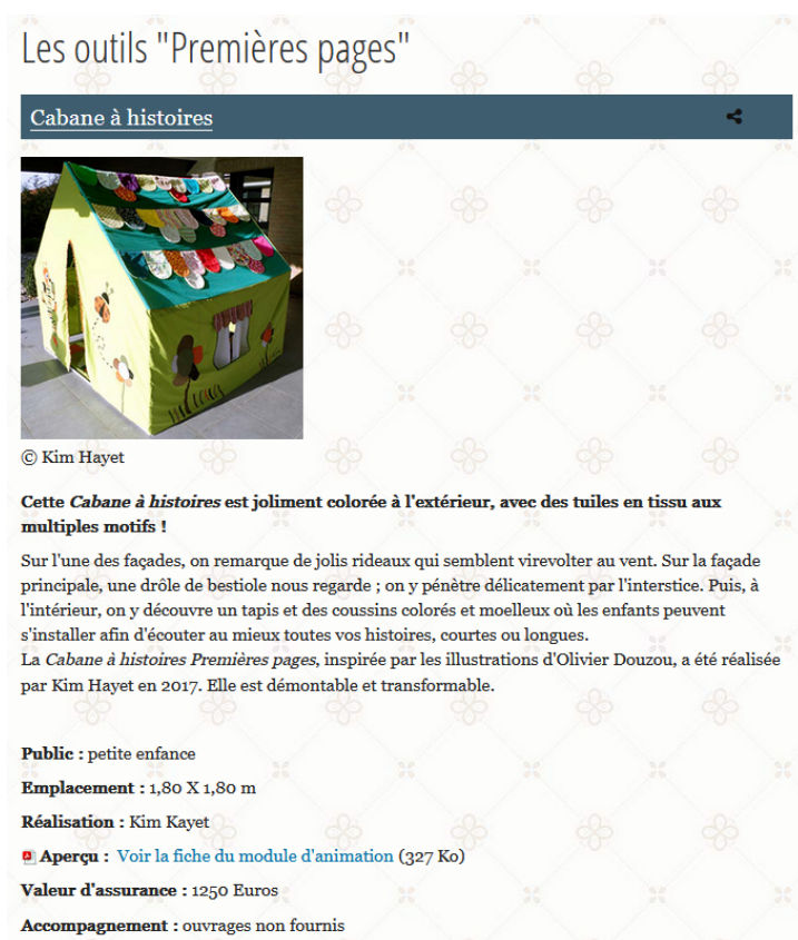
Annexe 7 - Cabane à histoire