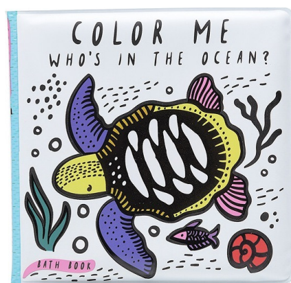
Livre de bain en plastique