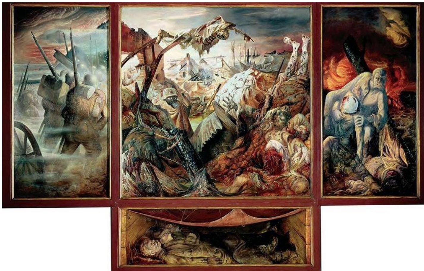
Abbildung 1 – DIX, Otto: Der Krieg , 1929-1932, Tempera sur bois, Panneau Central : 204x204cm, Panneau de Gauche et de Droite : 202x102cm, Prédelle : 60x204cm, Neue Meister Galerie, Dresde.