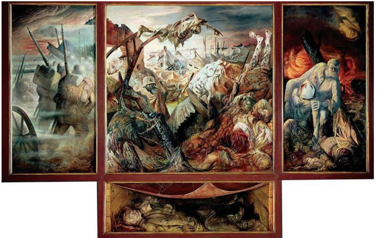
Abbildung 1 – DIX, Otto: Der Krieg , 1929-1932, Tempera sur bois, Panneau Central : 204x204cm, Panneau de Gauche et de Droite : 202x102cm, Prédelle : 60x204cm, Neue Meister Galerie, Dresde.