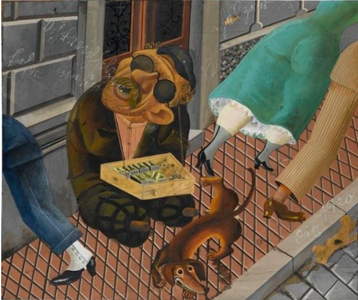
Abbildung 3 - DIX, Otto: Der Streichholzhändler , 1920, Huile sur toile, 141 x 166 cm, Staatsgalerie, Stuttgart.