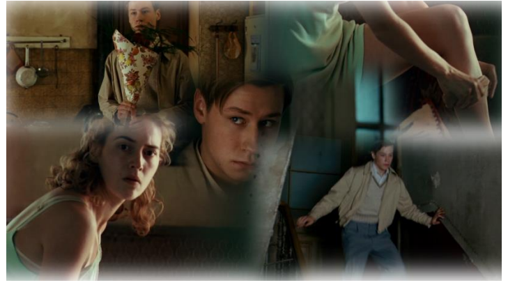
Szene 4.: erneute Begegnung mit Hanna nach drei Monaten der Genesung: die Begegnung zwischen Küche und Flur

Der Film hält sich eng an den Roman, was die erste Begegnung mit Hanna anbelangt. Als Michael Hanna Blumen mitbringt, um ihr zu danken, begreift sie, dass er ihr vorlesen könnte. Sie gibt ihm schon Befehle, und zwar mit strengem Blick und ohne ihn zu begrüßen. „Hanna: Leg sie da drüben in die Spüle. [...] Nein, warte. Ich komm mit dir. Ich muss zur Arbeit gehen. Warte im Flur. Ich ziehe mich schnell um.“ Die Befehle, die sie Michael gibt, sind nicht das Einzige, was hervorzuheben ist. Gleich am Anfang des Films begreifen wir, dass sie Sklavin ihrer gesellschaftlichen Stellung als unterprivilegierte Straßenbahnschaffnerin ist. Sie „muss“ zur Arbeit gehen. Sie hat keine andere Wahl. Sie scheint unzufrieden mit diesem Beruf zu sein und gleichzeitig sieht sie erschöpft, äußerst reizbar. Sowohl im Roman als auch im Film beobachtet Michael, wie sie sich umzieht, wie sie ihre Strümpfe anzieht. Hanna bemerkt, dass er sie beobachtet und er rennt weg. Im Roman (Kapitel 3 § 1) erzählt Michael von seinem Wiedersehen mit Hanna. Er kann sich an alles nicht gut erinnern, vor allem an das, was sie geredet haben. An die Tatsache, dass sie ihre Unterwäsche bügelte, kann er sich aber sehr gut erinnern. Sowohl im Roman als auch im Film kann er nicht wegschauen und scheint, besessen von ihr zu sein. Sowohl im Roman als auch im Film wird er als Spanner / als Voyeur geschildert.