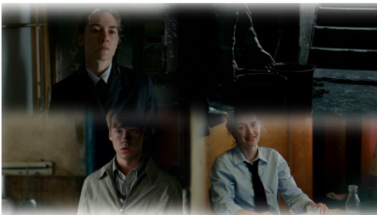
Szene 5.: Hanna als Straßenbahnschaffnerin

„ich erkenne heute im damaligen Geschehen das Muster, nach dem sich mein Leben lang Denken und Handeln zueinandergefügt oder nicht zueinandergefügt haben. [...] Oft genug habe ich im Lauf meines Lebens getan, wofür ich mich nicht entschieden hatte, und nicht getan, wofür ich mich entschieden hatte. Es, was immer es sein mag, handelt; es fährt zu der Frau, die ich nicht mehr sehen will, macht gegenüber dem Vorgesetzten die Bemerkung, mit der ich mich um Kopf und Kragen rede, raucht weiter, obwohl ich mich entschlossen habe, das Rauchen aufzugeben, und gibt das Rauchen auf, nachdem ich eingesehen habe, daß ich Raucher bin und bleiben werde.“ 33