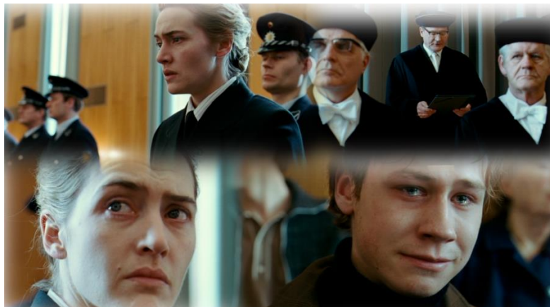
Szene 35 : Hannas Verurteilung

Die Szene, in der Michael Hanna im Gefängnis besuchen will, kommt nicht im Roman vor. Im Film entscheidet Michael, Hanna zu besuchen. Er zögert aber und ändert dann seine Meinung und geht. Hanna wartet vergebens. Michael, verwirrt, kann nicht mit der Situation klarkommen. Er ist unschlüssig. Einerseits will er sie verstehen und andererseits will er sie verurteilen, für das, was sie begangen hat. Diese Szene spiegelt Michaels Zerrissenheit und seine Unfähigkeit wider, sich von Hanna abzugrenzen.