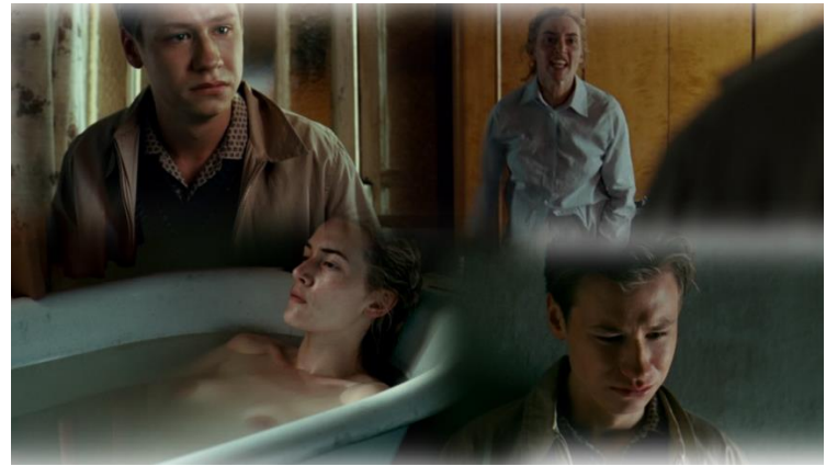
Szene 10 : Erster Streit

Die Straßenbahnszene markiert einen Wendepunkt in ihrer Beziehung. Michael steigt in die Straßenbahn ein. Hanna schaut ihn an, wirkt wütend und ignoriert ihn. Sie schließt sich im Zugführerwagen ein. Michael versteht nicht und sieht verzweifelt aus. Michael wartet auf sie auf ihrem Treppenabsatz, als sie wütend nach Hause kommt. Im Roman wirkt Hanna weniger wütend. Es handelt sich um den ersten Streit zwischen den beiden Protagonisten im Film.