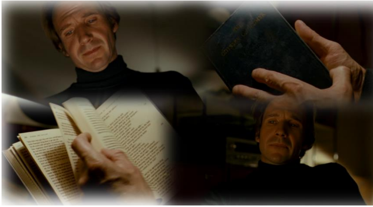
Szene 38 : Michaels Wohnung, 1976