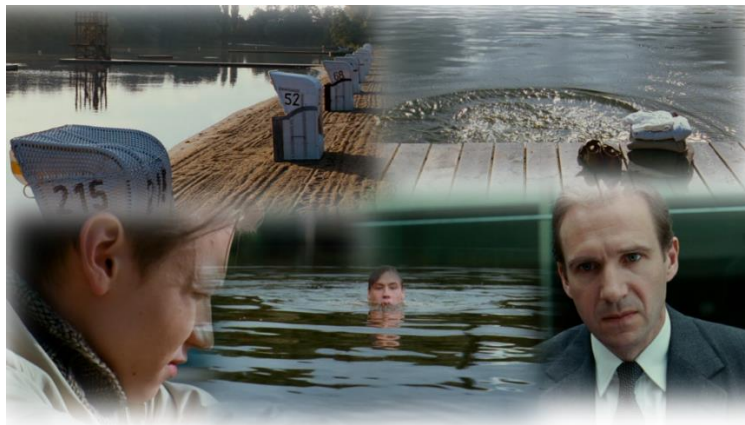
Szene 19 : Hanna verschwindet

Das Lieben ist so zu sagen eine Art geistige Zuflucht für Hanna, ein Mittel, der Realität zu entkommen. Das ist wie eine Zuflucht, bevor sie später wirklich daraus flüchtet. Hannas Weltvergessenheit ist für Michael von Anfang an faszinierend und reizend. Sie erlebt den Sex als Abkehr vom realen Leben, als Selbstverlust. Diese Zurückgezogenheit in sich selbst und in ihren Körper ist hervorzuheben.