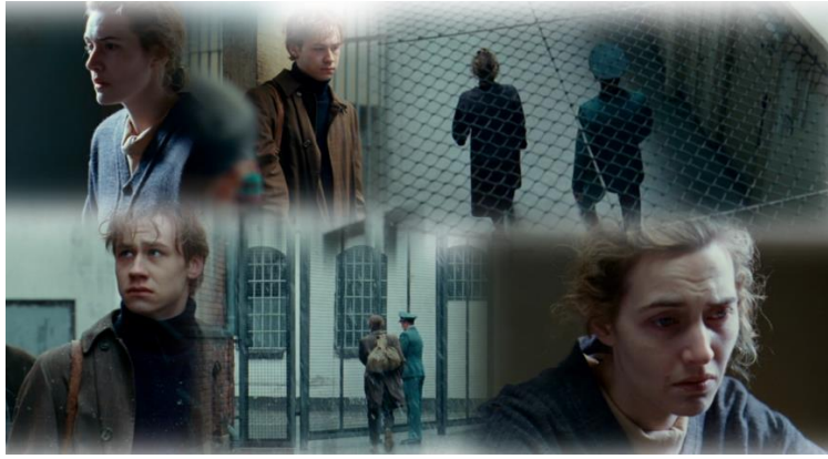
Szene 32 : Gefängnis