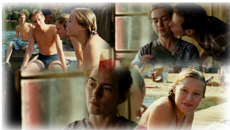
Szene 15.: am See / Hannas Wohnung

Was die Begegnung mit Sophie und das Treffen mit Freunden anbelangt, hält sich der Film eng an den Roman. Der einzige Unterschied ist, dass Michael im Roman seine Freunde nicht am See sondern im Schwimmbad trifft. Sowohl im Film als auch im Roman bemerken wir, dass Michaels Beziehung zu Hanna immer mehr ins Stocken gerät. Es sei Folgendes zitiert: