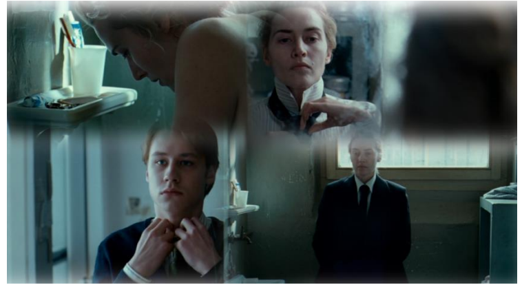
Szene 34 : Hanna in ihrer Zelle / Michael in seinem Schlafzimmer

Die Szene, in der Michael Hanna im Gefängnis besuchen will, kommt nicht im Roman vor. Im Film entscheidet Michael, Hanna zu besuchen. Er zögert aber und ändert dann seine Meinung und geht. Hanna wartet vergebens. Michael, verwirrt, kann nicht mit der Situation klarkommen. Er ist unschlüssig. Einerseits will er sie verstehen und andererseits will er sie verurteilen, für das, was sie begangen hat. Diese Szene spiegelt Michaels Zerrissenheit und seine Unfähigkeit wider, sich von Hanna abzugrenzen.