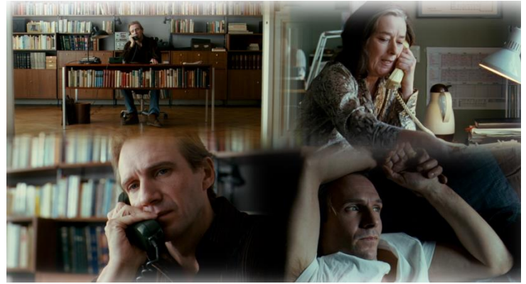
Szene 42.: Anruf der Leiterin des Gefängnisses

20 Jahre nach Hannas Inhaftierung erfährt Michael, dass sie bald begnadigt werden würde. Die Leiterin des Gefängnisses macht ihm deutlich, dass er Hannas einziger Kontakt ist. Wenn er keine Verantwortung für sie übernimmt, hat Hanna überhaupt keine Zukunft. Sowohl im Roman als auch im Film fühlt sich Michael immer noch in Hannas Schicksal einbezogen, indem er sie bei ihrer sozialen Rehabilitation unterstützen muss. Michaels Zweifel und Unentschlossenheit, Hannas zu besuchen, ist im Roman auffälliger, sowie seine Verwirrung. Ein Jahr lang antwortete Michael weder Hanna noch der Leiterin des Gefängnis, bis er eines Tages den Anruf der Leiterin erhielt. Es könnte Folgendes zitiert werden: