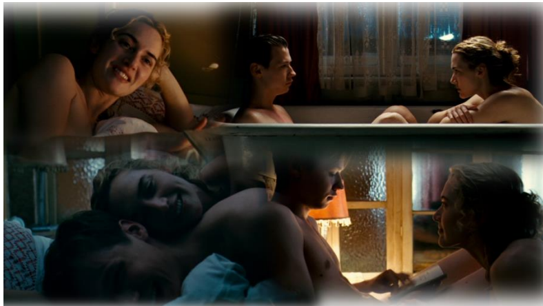
Szene 8.: das Ritual des „Duschen, lieben und [...] beieinanderliegen“

„Auch weil die Frau, für die ich in Gedanken keinen Namen hatte, mich am Nachmittag so verwöhnt hatte, ging ich am nächsten Tag wieder in die Schule. Dazu kam, daß ich die Männlichkeit, die ich erworben hatte, zur Schau stellen wollte. Nicht daß ich hätte angeben wollen. Aber ich fühlte mich kraftvoll und überlegen und wollte meinen Mitschülern und Lehrern mit dieser Kraft und Überlegenheit gegenüberreten.“ 38