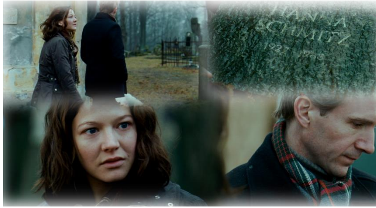
Szene 46 : Michael und Julia gehen zu Hannas Grab – Januar 1995

Die Szene, in der Michael und Julia zu der ländlichen Kirche fahren, kommt nicht im Roman vor. Im Film fahren sie zur ländlichen Kirche, in der Michael mit Hanna gewesen war, als sie den Klängen des „Gloria in Excelsis Deo“ bei der Probe eines Kinderchors in Tränen ausbrach. Sie wurde nämlich dort vergraben. Michael nimmt die Beziehung zu seiner Tochter wieder auf und erzählt ihr zum ersten Mal von Hanna. So lässt er Hannas Andenken weiterleben.