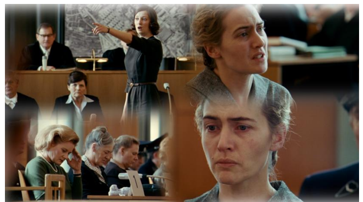
„Szene 27.: Gerichtsaal, Hannas Verhandlung