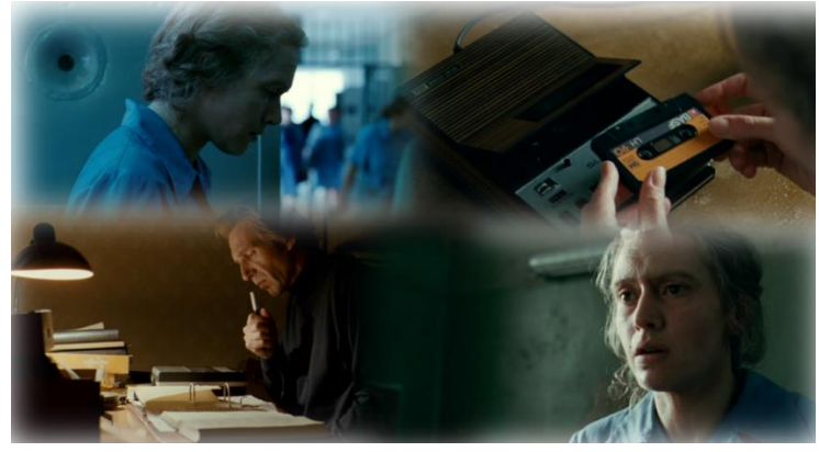
Szene 39 : Hannas Zelle / Michaels Wohnung

Als er einzog und seine Sachen auspackte, stieß er auf Homers Odyssee, lächelte und vorlas wie zuvor, und zwar mit einem von Traurigkeit und Sehnsucht verschleierte Blick. So fing er im achten Jahr von Hannas Haft an, Audiokassetten für sie zu speichern. Die letzte Kassette, die er Hanna geschickt hat, war im achtzehnten Jahr ihrer Haft. Durch das Ausleihen von Büchern und mit Hilfe der Audiokassetten, wird Hanna somit das Schreiben und das Lesen autodidaktisch lernen. In dieser langen Zeit herrscht aber trotzdem eine gewisse Distanz von Seiten Michael aus. Es sei Folgendes zitiert: