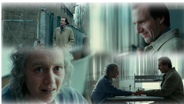
Szene 43.: Michael besucht Hanna im Gefängnis

„Aber den Besuch bei Hanna schob ich vor mir her. Gerade weil sie mir auf so freie Weise sowohl nah als auch fern war, wollte ich sie nicht besuchen. Ich hatte das Gefühl, sie könne, was sie mir war, nur in der realen Distanz sein. Ich hatte Angst, die kleine, leichte, geborgene Welt der Grüße und Kassetten sei zu künstlich und zu verletzlich, als daß sie die reale Nähe aushalten könnte. Wie sollten wir uns von Angesicht zu Angesicht begegnen, ohne daß alles hochkam, was zwischen uns geschehen war.“ 70