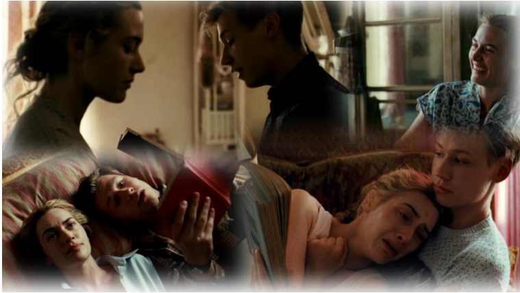
Szene 11 : Liebeskomplizenschaft