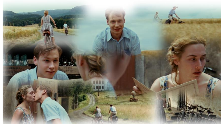
Szene 12 : Ausflug

Das Ritual des „Duschen, lieben und [...] beinanderliegen“ geht weiter. Jedoch verlangt Hanna, dass sie die Reihenfolge verändern. Michael muss ihr zuerst vorlesen und danach können sie sich lieben. Sie stellt immer noch die Bedingungen für den Sex. Schrittweise setzt sie einen Rollentausch fest, vor allem im Film. Hanna weint, wenn Michael ihr vorliest und zeigt ihre Verletzbarkeit. Michael übernimmt die Rolle des Beschützers. Die Szene des Ausflugs fehlt im Roman. Im Film organisiert Michael den Ausflug, arbeitet die Route aus... Er übernimmt somit die Rolle des Reiseführers. Hanna lässt los und lässt sich von ihm führen. Sie vertraut ihm. Diese Szene des Ausflugs, in der es zu keinem Streit kommt, in der nur ein Wohlgefühl herrscht, ist zu betonen. Alles ist friedlich. Sie haben Spaß zusammen. Die Gastwirtin hält sie für eine Mutter und deren Sohn. Es spielt aber keine Rolle für Michael. Er leugnet nicht ab. Sie sind in ihrer Glücksblase und nichts kann sie erreichen.