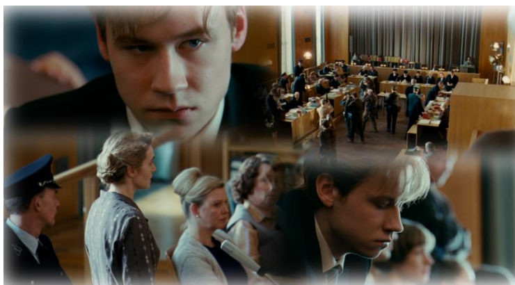
„Szene 23.: Gerichtsaal, Prozess

„Mich nach Hanna nie mehr demütigen lassen und demütigen, nie mehr schuldig machen und schuldig fühlen, niemanden mehr so lieben, daß ihn verlieren weh tut [...] Ich gewöhnte mich ein großspuriges, überlegenes Gehabe an, ich präsentiere mich als einen, den nichts berührt, erschüttert, verwirrt.“ 52