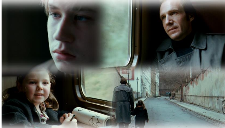
Szene 36 : Im Zug, Neustadt, Westdeutschland 1976

„Als die Verhandlung beendet war und die Angeklagten abgeführt wurden, wartete ich, ob Hanna zu mir schauen würde. [...] Aber sie schaute geradeaus und durch alles hindurch. Ein hochmütiger, verletzter, verlorener und unendlich müder Blick. Ein Blick, der niemanden und nichts sehen will.“ 66