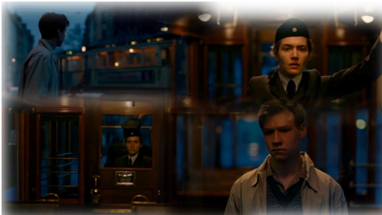
Szene 9 : Szene in der Straßenbahn

„Ich staune, wieviel Sicherheit Hanna mir gegeben hat. Mein Erfolg in der Schule ließ meine Lehrer aufmerken und gab mir die Sicherheit ihres Respekts. Die Mädchen, denen ich begegnete, merkten und mochten, daß ich keine Angst vor ihnen hatte. Ich fühlte mich in meinem Körper wohl.“ 42