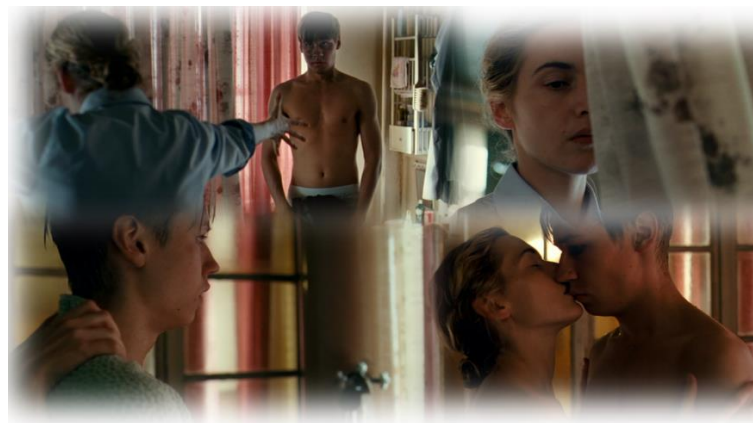
Szene 6.: das Baden und Lieben