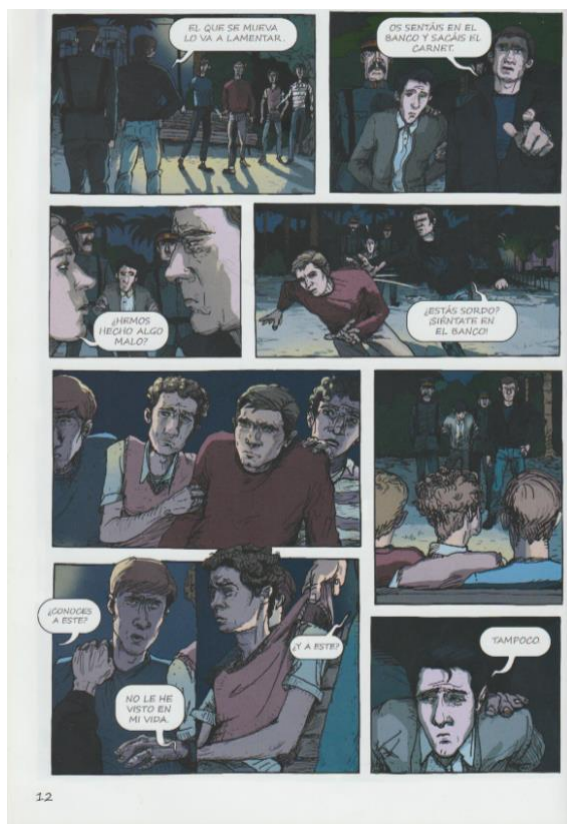
Figure 4 - Planche du roman graphique El Violeta (p.12)