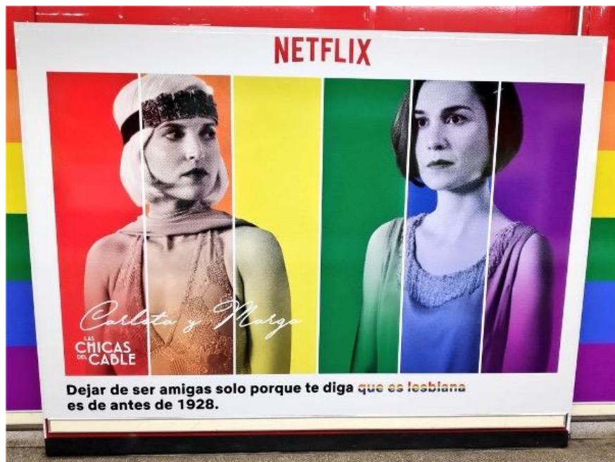
Figure 7 - Affiche de Netflix (pour le projet final)