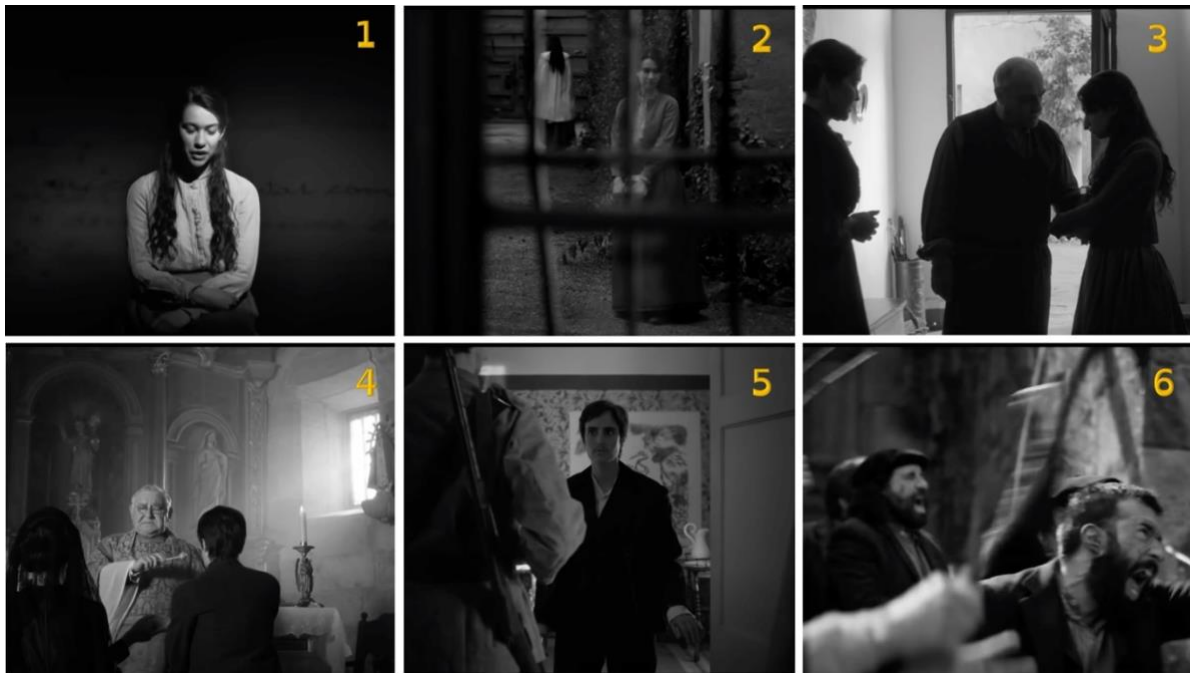
Figure 1 - Photogramme de la bande-annonce d'Elisa y Marcela