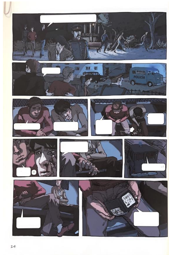
Figure 6 - Planche du roman graphique El Violeta (p.14)