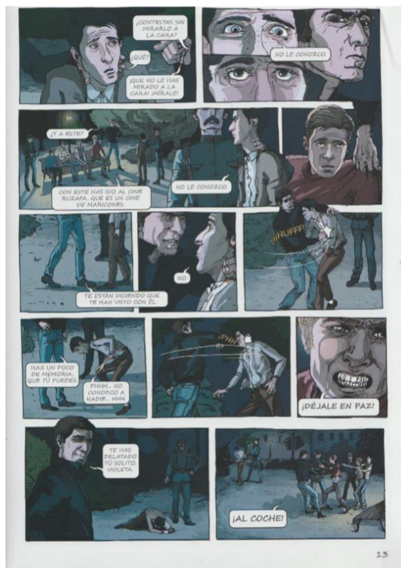
Figure 5 - Planche du roman graphique El Violeta (p.13)