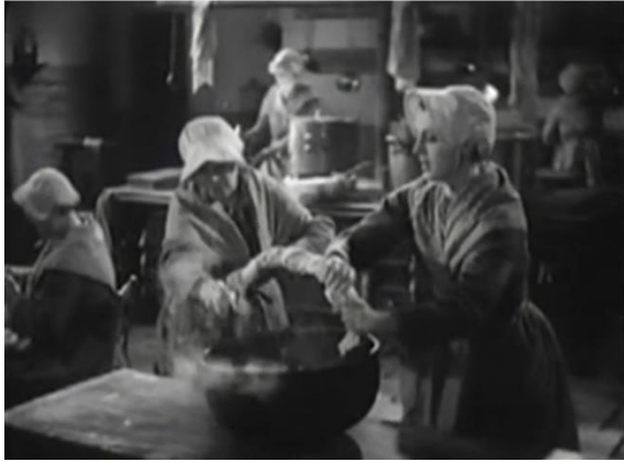
Figure 12 : Travail naturaliste : la cuisine (Prisons de femmes)