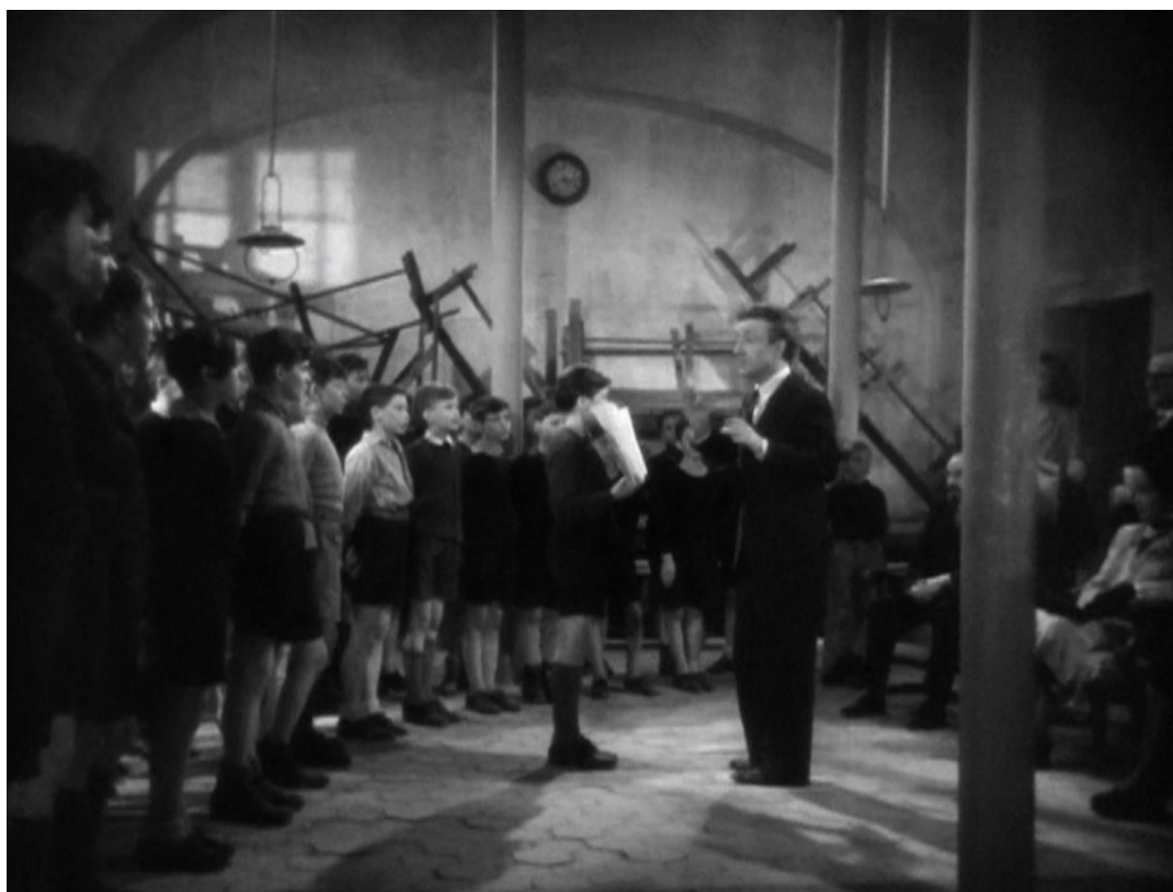
Figure 68 : Organisation constructive du groupe social : la chorale dirigée par le surveillant ( La Cage aux rossignols )

directeur Rachin qui dit que cela remet en cause la discipline, la chorale se développe et finit par attirer l'attention des « dames bienfaitrices de l'Œuvre » dont la présidente, une comtesse, vient visiter l'institution et entendre les enfants chanter. Cela indique que l'orphelinat est une œuvre privée et intègre au corpus une figure philanthropique bienveillante. Ainsi, le film se va, en quelque sorte, à contre-courant de la dénonciation des œuvres privées qui primait depuis les campagnes de presse. La petite troupe présente son spectacle dans le réfectoire, dont tous les bancs et tables ont été poussés contre les murs, recouvrant les injonctions morales qui y sont affichées 273 . L'entreprise de Mathieu finit donc par fragiliser directement l'emprise autoritaire du directeur et de ses valeurs disciplinaires, y compris dans le réagencement des lieux. Par ailleurs, on fait souvent le parallèle entre la chorale du film et celle du centre de rééducation de Ker Goat qui se met en place à la même période, mais Mathias Gardet nous met en garde : « Si ce film n'est pas inspiré par l'expérience de Ker Goat, encore balbutiante à l'époque, les dirigeants de ce dernier vont cependant rapidement le récupérer pour faire la promotion de leur propre chorale 274 . » Ceci témoigne à nouveau de l'imbrication des représentations avec les