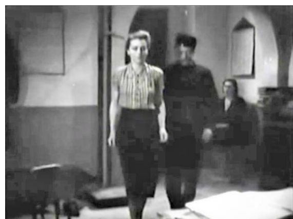
Figure 9 : La fixité conservée malgré le mouvement et l'ellipse 2/2 (Prisons de femmes)

Richebé illustre bien comment, dès l'entrée de la prison, les personnages sont placés dans une voie tant spatiale que comportementale qu'il leur faudra suivre sous peine de sanction et aussi que c'est bien sur le corps des jeunes femmes que la discipline vise à s'éprouver et d'abord par l'intermédiaire des injonctions. Mais il faut bien noter également que cela n'est pas un