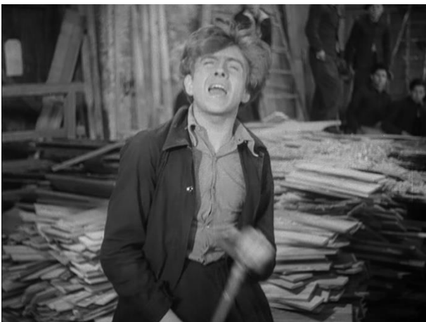
Figure 35 : Aliénation complète du corps livré à lui-même ( Le Carrefour des enfants perdus )

l'émeute, craque émotionnellement et tue le moniteur en question d'un coup de marteau. Il court ensuite, éperdu, dans l'atelier en menaçant ses camarades et en criant « Je vous crèverai. Je veux pas y aller. Non, laissez-moi ! Je veux pas y aller à l'hôpital. » Alors que ses camarades interrompent le saccage et s'éloignent prudemment, le jeune homme tremble, se plie et se crispe, suivi par la caméra, puis vient se poser devant celle-ci, les yeux fermés et replié sur lui-même (fig. 34-35). Ce corps chaotique, incontrôlé, devient ainsi le symbole de la rébellion qui échappe à ses instigateurs et la conséquence funeste d'une révolte sans objet réel puisque le Carrefour est pour eux un lieu d'accueil et non une prison. Mais une telle représentation péjorative de la folie pose problème à analyser pour plusieurs raisons. Un critique dans La Gerbe , journal fasciste et eugéniste, parle de Rougier en ces termes méprisants : « des spécimens