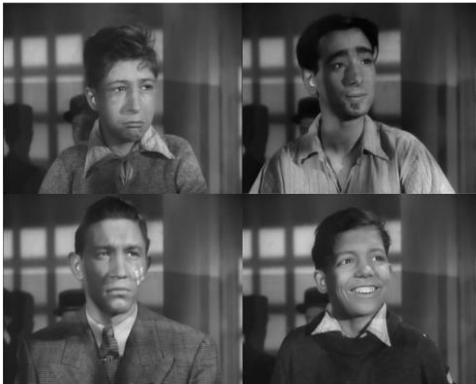
Figure 2 : La série de portraits au tribunal individualise les mineurs ( Le Carrefour des enfants perdus )

Un motif de mise en scène isolé – mais on retrouvera des dispositifs semblables dans la deuxième partie de ce mémoire – rend compte de l'attention portée aux détenus dans leur individualité. Il s'agit de la série de portraits en fondus enchaînés qui se trouve dans la scène du tribunal du Carrefour des enfants perdus (fig. 2). Y défilent les enfants qui assistent à leur