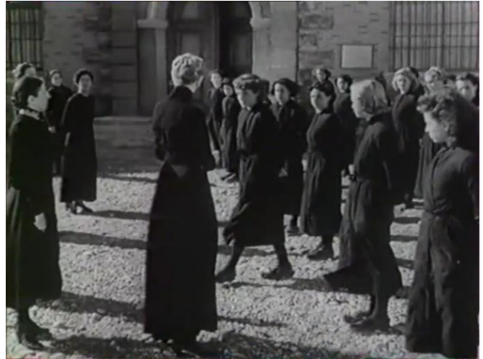
Figure 31 : Une jeune femme brise le rang, tous les regards se focalisent dessus ( Prison sans barreaux )

latéral qui vient rejoindre Appel. Elle insiste ensuite, souriant faussement, pour que celles qui auraient des plaintes à formuler « sortent du rang ». Au bout d'un moment, une jeune fille ose se présenter puis cinq autres qui viennent s'agglutiner les unes aux autres devant la directrice qui les expédie aux cachots (fig. 31). Devant les soupirs de protestation des autres pensionnaires, les gardiennes réinstaurent l'ordre : « Silence ! Reformez les rangs ! Une, deux, une, deux, une, deux... » et la promenade reprend son cours. Les détenues n'ont finalement prononcé aucune parole. En revanche, elles ont modifié l'agencement formel du groupe en sortant du rang et c'est cette faute, malgré la responsabilité de Mme Appel qui la leur a fait commettre, qui leur vaut leur punition. Plus intéressant encore : la séquence témoigne d'une certaine