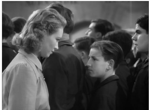
Figure 40 : Vulnérabilité des voleurs de couteaux 2/2 ( Le Carrefour des enfants perdus )

Il est toutefois difficile d'établir pour les personnages que nous venons d'évoquer si leur comportement subversif est dû à leur milieu d'origine ou à la fréquentation des prisons et des maisons de correction. Dans le cas de Nelly dans Prison sans barreaux , par contre, il apparaît clairement qu'elle est une fille issue d'un « milieu banal » aux dires de la surveillante Mlle Pauline, mais que le « drôle de langage » qu'elle emploie, « c'est ici [dans la maison de redressement] qu'elle l'a appris ». On la découvre alors comme un animal sauvage, pris au piège. Encadrée par les gendarmes après son évasion, se débattant et criant, elle a le visage crasseux et les cheveux en pagaille (fig. 41). Sans connaître Yvonne, elle se permet de s'en prendre à elle directement : « Dès que je tourne le dos, on en profite toujours pour faire des innovations. La dernière fois, on avait changé les assiettes, mais on mangeait toujours de la merde. Cette fois-ci, c'est la directrice qu'on change. » Cela rappelle une grande critique faite aux maisons de correction, celle de favoriser l'éducation au crime en permettant à de jeunes enfants d'en côtoyer d'autres, plus âgés et plus engagés dans le vice 157 . L'interprétation du