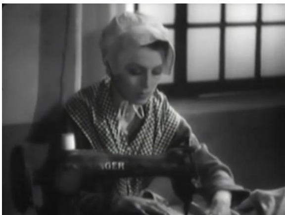
Figure 14 : Travail naturaliste : la couture (Prisons de femmes)

sonore (fig. 14). Ces images, qui traitent le travail de manière naturaliste et fidèle à ce qu'on pouvait observer à l'époque dans les prisons 94 , ont pu participer au désarroi et à la surprise des critiques qui en attendaient une vision infernale. Mais, que l'on ne s'y trompe pas, la contrainte du corps est bien présente à en juger par le jeu des actrices et leurs regards résignés, le personnage de Juliette servant de représentante à l'échelle individuelle du traitement réservé aux détenues en général. Et le personnage de Carco explicite ensuite la critique en qualifiant ces ouvrages bruyants, fatigants et difficiles de « besoins accomplis sans l'amour du travail ni l'espoir d'un encouragement réellement efficace ». Le montage ajoute à cela un sentiment de continuité. Les fondus enchaînés et la grande place qu'occupent ces images dans les séquences de prison montrent l'aspect répétitif et permanent de ces tâches en amplifiant le sentiment d'enfermement. Chaque jour en prison est un nouveau cycle identique au précédent et qui épuise un peu plus les forces des détenues, qui à leur sortie sont payées misérablement et taxées indûment par les gardiennes, comme c'est le cas pour Juliette.