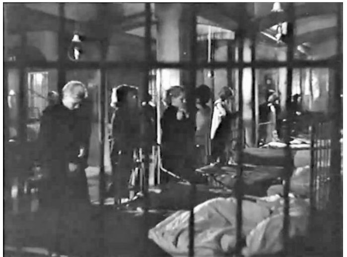
Figure 21 : Scène du couché, des individus isolés dans un groupe contenu ( Prisons sans barreaux )

Un autre parti pris, qui cohabite dans les œuvres avec le précédent, est celui de placer le motif au premier plan. Alors, beaucoup plus apparent, il invite le spectateur ou la spectatrice à poser un regard extérieur sur les détenues, soulignant par là leur enfermement et leur exclusion. On voit cette technique appliquée à des groupes, tels que chez Moguy dans la scène du nettoyage du couloir évoquée au chapitre précédent, dans laquelle les détenues frottent les barreaux,