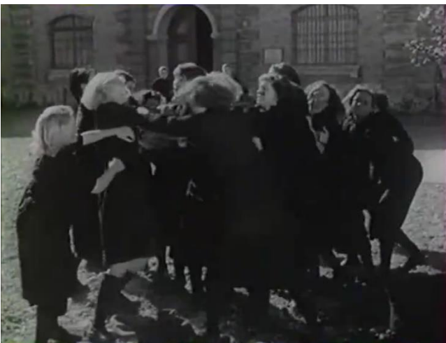
Figure 44 : Explosion de violence, résultat de la brutalité disciplinaire ( Prison sans barreaux )

Les empoignades sont la forme la plus évidente que peuvent prendre les conflits entre pensionnaires, comme celui de Prison sans barreaux que nous avons vu dans le chapitre précédent, quand ils dégènèrent. En effet, la scène qui suit la confrontation entre Renée, Alice