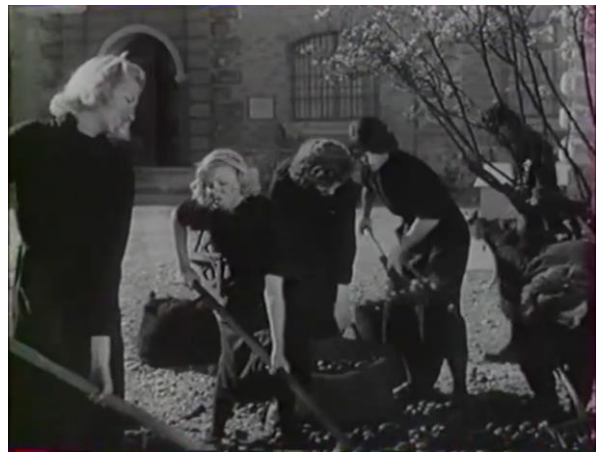
Figure 16 : Usure et dégradation dans le travail au charbon ( Prison sans barreaux )

Outre l'âge, il est aussi fort possible que ce qui pose problème dans le charbon en particulier, c'est que c'est une tâche qui tranche encore trop à l'époque avec les préjugés concernant la nature féminine analysés par Claudie Lesselier 95 . En effet, cette tâche choque peut-être