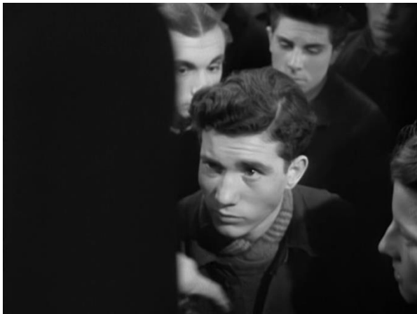
Figure 39 : Vulnérabilité des voleurs de couteaux 1/2 ( Le Carrefour des enfants perdus )

Par ailleurs, c'est surtout la figure de Joris (Serge Reggiani) qui incarne le caïd par excellence. Il parvient dès le premier jour à voler une bouteille de vin, il fume la nuit dans les dortoirs, parle argot et pousse ses compagnons à défier l'autorité pour pouvoir s'échapper. Il fréquente aussi le milieu du crime et ose défier l'autorité. C'est d'ailleurs cette force de caractère qui poussera Jean Victor à voir en lui un chef. De plus, tous ces personnages rappellent encore une fois, par leurs capacités à s'affranchir des règles et leur maîtrise de la clandestinité, l'ancrage de nos films au registre du banditisme très en vogue au cours des années 1930. En effet, ils confèrent aux films un caractère sulfureux et spectaculaire qui rend le récit marquant, mais qui est compensé par leur réhabilitation ultérieure.