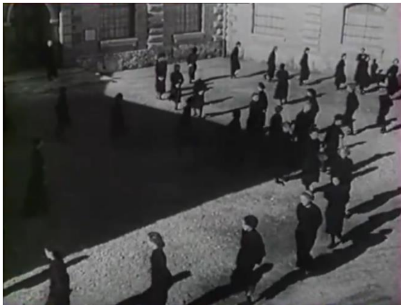
Figure 27 : Ronde des pensionnaires (1/3) : répétition, régularité et domination (Prison sans barreaux)

fronton et le règlement de la maison de correction et, enfin, la cour dans laquelle deux cercles occupent l'espace (fig. 27), les pas des détenues et la voix de la gardienne (« Un, deux, un, deux, un, deux... ») se superposant aux battements de tambour du début. Plusieurs plans, enchaînés en fondus, montrent alors la ronde des détenues qui fonctionne comme un engrenage très mécanique, s'approchant de plus en plus des corps en combinaisons noires identiques et aux mouvements synchrones (fig. 28). Puis on découvre les visages des pensionnaires qui se succèdent à l'écran, mais le fait qu'elles arborent toutes la même expression lasse et abruti et la même direction de regard n'invite pas à les distinguer les unes des autres et les place au contraire dans une même masse (fig. 29). D'une part, on retrouve la place primordiale donnée au son des pas, comme, plus tard dans le même film, lorsqu'au passage d'un bataillon de détenues dans un couloir, le médecin se plaint de ne pouvoir utiliser son stéthoscope à cause du bruit, donnant un léger aperçu de l'abrutissement que ce système peut aussi faire naître chez le