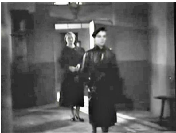
Figure 8 : La fixité conservée malgré le mouvement et l'ellipse 1/2 (Prisons de femmes)