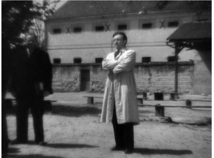
Figure 60 : Malaise de Clément Mathieu, remise en question de la virilité ( La Cage aux rossignols )

Adémaï . La candeur de cet autre personnage crée une forme d'attente autour de l'apparition de Noël-Noël dans La Cage aux rossignols comme en témoignent les journaux de l'époque, satisfaits de reconnaître par moments « la face naïve et goguenarde d'Adémaï 218 » et de voir l'acteur « dans son personnage habituel, avec sa timidité, sa résignation de victime consentante, son regard de poète où passe parfois cette curieuse flamme d'impitoyable ironie mêlée d'une indulgence sans bornes 219 ». On trouve encore bien des qualificatifs pour décrire ce personnage qui évoquent toujours une certaine fragilité : tendre, fin, simple, gentil, touchant, vrai, pur, naturel, craintif, bafouillant, confus, timide, doux, etc. Ce personnage dénote par rapport au monde qui l'entoure et semble le dépasser d'une certaine manière. Georges Zevaco, non sans une