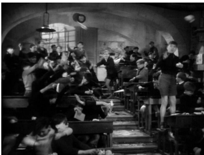
Figure 47 : Esthétique du désordre, le chahut des orphelins ( La Cage aux rossignols )

Mais à ce chaos bon enfant répondent, dans les autres films du corpus, des scènes de révolte plus virulentes qui servent pourtant un propos analogue et sont apparentées