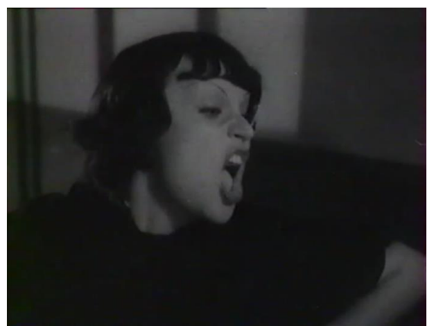
Figure 37 : ...et de la grimace (Prison sans barreaux)