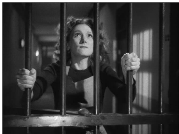
Figure 24 : Capture de Thérèse (2/2) : écrasement et négation de la profondeur de champ (Les Anges du péché)