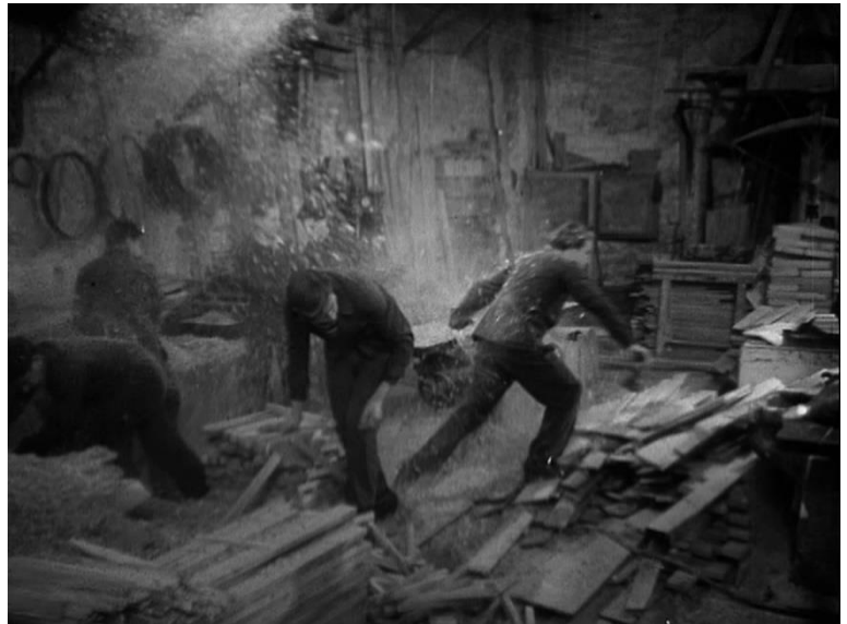
Figure 49 : La menuiserie, saturation du cadre par les copeaux jetés, mouvement, vitesse et spontanéité ( Le Carrefour des enfants perdus )

règles de mise en scène du même ordre : saturation du cadre, mouvements chaotiques, occupation de la profondeur de champ, indifférenciation des individus, effet de foule... Le