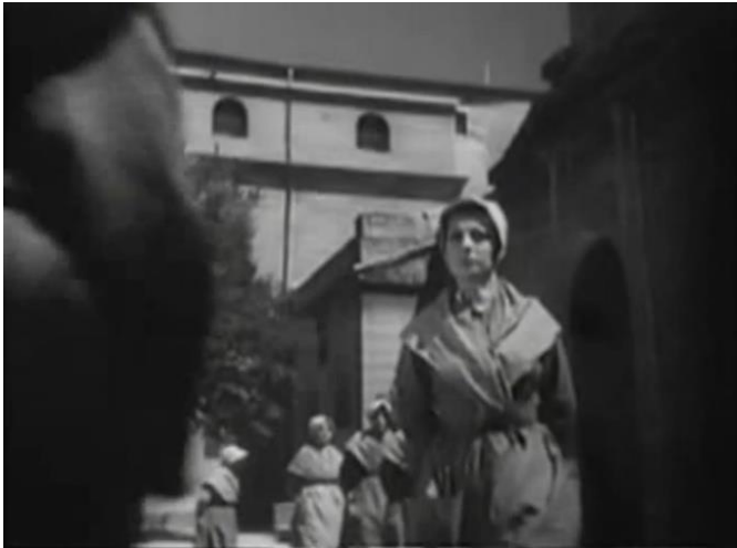
Figure 261 : Ronde des prisonnières (2/2) : écrasement par l'architecture ( Prisons de femmes )

l'on s'approche de leur hauteur. Tantôt en plongée, à hauteur de regard ou même en contre-plongée (fig. 26), l'horizon est bouché par les murs gigantesques qui laissent à peine entrevoir le ciel. Une gardienne sonne une cloche placée très en hauteur et, pour rentrer dans le bâtiment, les détenues passent entre de larges piliers qui couvrent la moitié de la surface de l'écran. La prison comme structure physique est donc en position de grande domination et ramène sans cesse les