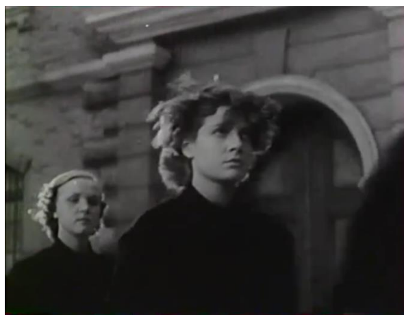
Figure 29 : Ronde des pensionnaires (3/3) : interchangeabilité et communication impossible (Prison sans barreaux)