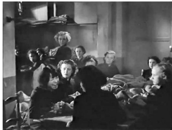
Figure 33 : Rire nerveux : de la détresse physique à la détresse psychique (Prison sans barreaux)

Cette séquence indique bien comment la promiscuité et l'insalubrité des bâtiments doublés du régime disciplinaire favorisent les maladies tant physiques que mentales et comment les unes entretiennent les autres. Dans les faits, la proximité de la mort avait évidemment un fort impact