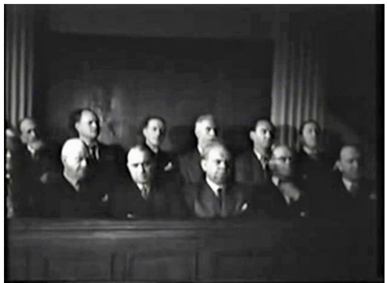
Figure 1 : Le jury, composé d'hommes d'âge mûr, rend le verdict de culpabilité ( Prisons de femmes )

Cette séquence nous intéresse à plusieurs égards. On constate d'abord que, hormis l'accusée et l'assistante de l'avocat, les femmes sont absentes au tribunal. Les hommes ont l'exclusivité de la justice 57 , c'est ce que nous montrent les plans sur les jurés notamment (fig. 1 58 ). Ceci corrobore notre remarque précédente sur la responsabilité masculine, soulignée dans ce film, vis-à-vis de ces femmes accusées de tous les maux. Elle