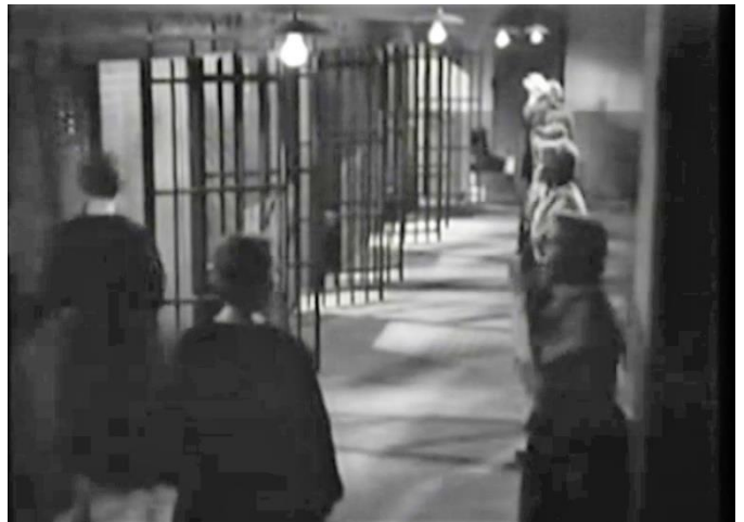
Figure 302 : Interchangeabilité, synchronisation et répétition perpétuelle ( Prisons de femmes )

Mais, en se concentrant sur la dimension sonore de Prisons de femmes , on constate que, plus que les battements de pieds, c'est le silence qui caractérise la formation du groupe par la façon dont il isole les jeunes femmes les unes des autres. Dans tous les films, on voit que la dichotomie du silence et du bruit – cri, rire ou brouhaha – est sans arrêt rappelée par les injonctions au silence des gardiennes ou de la direction, et pour cause : empêcher les détenus de s'exprimer et de communiquer entre eux et entre elles permet d'asseoir sa domination et d'assurer son contrôle. C'est d'ailleurs une des caractéristiques des prisons de femmes les plus critiquées par les conséquences de la déshumanisation qu'elle provoquait. Instaurée en 1839, la règle du silence absolu dans les prisons centrales avait pour but d'empêcher les détenues les plus criminelles d'enseigner leurs