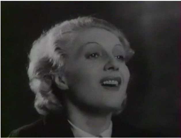
Figure 63 : Le discours prophétique : exposition de nouveaux idéaux ( Prison sans barreaux )

qu'elles sachent que le malheur est illégal, que le bonheur n'est pas un droit, mais un devoir et qu'on ne le gagne qu'en le méritant. Je veux leur apprendre à vivre, à vivre ! À sourire, à redevenir jeunes... »