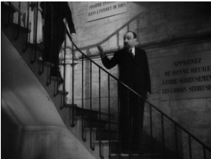
Figure 10 : Rachin donne un ordre, entouré d'appels à l'obéissance ( La Cage aux rossignols )

générales : « Apprenez de bonne heure à faire sérieusement les choses sérieuses », « Il faut respecter la règle dans son propre intérêt et dans l'intérêt de tous », « Savoir obéir n'est pas une faiblesse, c'est une grande force », « C'est quelque chose d'obéir, mais il y a un mérite de plus d'obéir de bonne grâce », « [Obéissance] 87 consentie vaut mieux que discipline imposée », etc. (fig. 10) Il est intéressant de relever que ces injonctions à l'obéissance et à l'ordre, de par leur