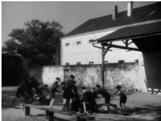
Figure 45 : Résurgence du motif violent ( La Cage au rossignol )

Dans Le Carrefour des enfants perdus et La Cage aux rossignols , ont lieu d'autres scènes de bagarre, mais pour d'autres raisons. Dans le premier cas, Joris veut empêcher ses camarades de