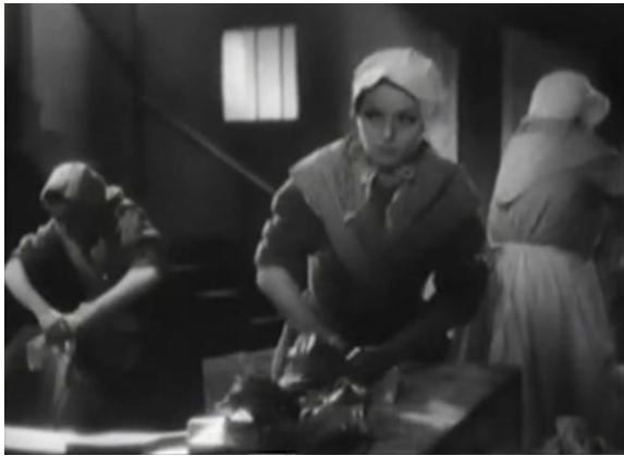
Figure 13 : Travail naturaliste : la blanchisserie (Prisons de femmes)