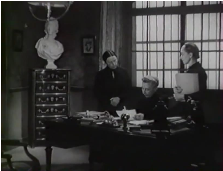
Figure 19 : Jusque dans le bureau de la direction, des fenêtres quadrillées sur plusieurs niveaux ( Prison sans barreaux )

relativement discrets la permanence du statut de détenu – au sens très littéral, avec tout ce qu’il implique de captivité, mais aussi d’appropriation par l’Institution. Souvent, on en trouve des rappels en toile de fond, car ces trois films ont recours à l’affichage à l’arrière-plan de motifs quadrillés, causés par les barreaux ou les croisillons des fenêtres, accentués par l’utilisation d’ombres portées qui en dédoublent et étendent l’effet. Prison sans barreaux confirme que ces motifs sont bien volontaires, car des grilles apparaissent dès le générique d’ouverture et sont, par la suite, omniprésentes dans toute la première partie du film dans les ateliers, les couloirs et jusque dans le bureau de la direction. À l’inverse, elles disparaîtront quasiment une fois qu’Yvonne aura lancé sa réforme. L’observation de la composition des fenêtres, dont au moins