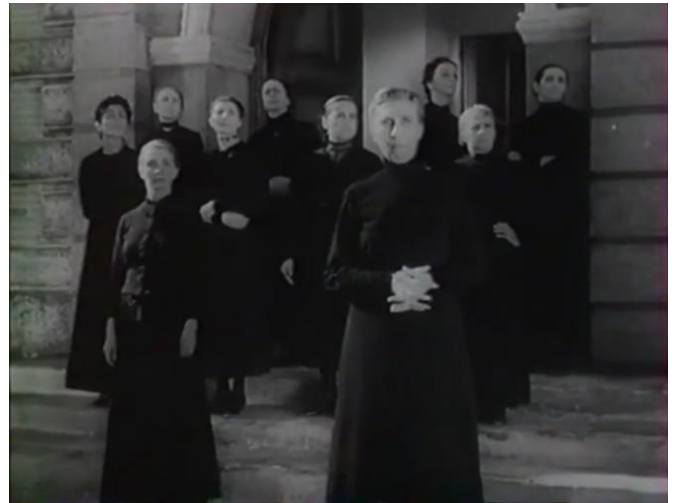
Figure 54 : ...Appel et sa cour, la rigidité austère de l'ancien temps ( Prison sans barreaux )