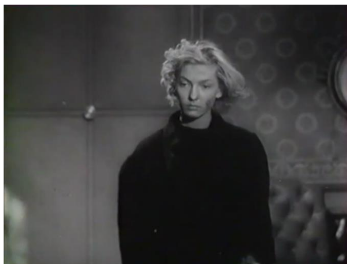
Figure 414 : Visage sale, cheveux en bataille et regard défiant ( Prison sans barreaux )

personnage par Corinne Luchaire est d'autant plus intéressante que l'on apprend dans la communication autour du film qu'elle a visité une maison de correction pour préparer son rôle, alors que c'était défendu 158 , ainsi l'argot employé, bien qu'écrit à l'avance par le scénario, et son personnage revêche et subversif tendent à créer autour du personnage un effet de réel et à mettre en avant la dimension documentaire de ce film.