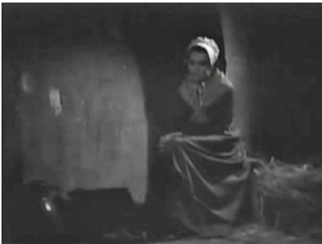
Figure 17 : Juliette au cachot ( Prisons de femmes )