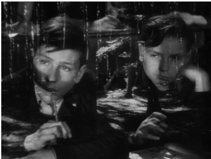
Figure 43 : Rêves d’extérieur et surimpression ( La Cage aux rossignols )

Enfin, une dernière réponse évidente à la situation d’enfermement est d’essayer de s’y soustraire totalement. En s’inscrivant par là dans le registre plus général des films de prison, il est souvent question de tentatives d’évasion plus ou moins fructueuses. Ainsi, Lequerec confie à Clément Mathieu que des enfants s’échappent tous les jours, et on voit effectivement comment