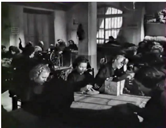
Figure 323 : La promiscuité favorise la transmission des maladies (Prison sans barreaux)

La maladie semble être la cause de décès avancée le plus fréquemment. Une scène au début de ce même film en témoigne. On y voit les pensionnaires entassées sur toute la profondeur de champ dans une grande salle (fig. 32), raccommoquant des pièces de tissu en silence. Tout à coup, l'une d'elles est prise d'une quinte de toux et toutes les jeunes filles se retournent vers elle d'un même mouvement, l'air inquiètes. Elles échangent quelques murmures et tout à coup l'une d'elles est prise d'un fou rire frénétique. Toutes se retournent à nouveau en même temps, alors que la voisine de la jeune femme qui rit la soutient avec compassion (fig. 33). Mme Appel entend le rire depuis le couloir et entre. Toutes les détenues se lèvent ensemble et la directrice s'exclame sèchement : « Qui a ri ? Où est la surveillante ? Vous n'êtes pas ici pour vous amuser ! ». Elle sort, et la détenue qui riait ajoute « On est ici pour crever. » et fond en sanglots.