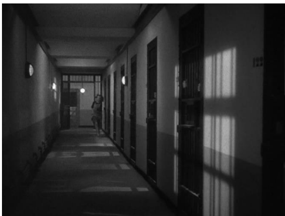
Figure 23 : Capture de Thérèse (1/2) : portes, grilles et lignes de fuite (Les Anges du péché)

automatiquement de la gauche de l'écran vers la droite. L'architecture résiste tant spatialement que métaphoriquement à l'envie accrue d'évasion de la prisonnière en opposant à son désir un mouvement contraire. Elle est d'autant plus déshumanisée par l'automatisme mécanique et la froideur métallique, accentués au son par le vrombissement de la porte et le claquement sec qui marque sa fermeture. À la fin du plan (fig. 24) et dans le contrechamp qui suit, la profondeur de champ est évaporée dans le flou, écrasée sur un seul plan qui ne présente plus que la prisonnière se détachant sur les barreaux. Dans ce film, le caractère enfermant de la prison est accentué d'autant plus par la vie cellulaire des détenues qui occasionne une grande division de l'espace, motif omniprésent du cinéma de Bresson. On en perçoit ici la cohérence avec des représentations plus collectives et contemporaines des espaces carcéraux au moment de la production du film. Dès avant la séquence de fuite, chaque cellule, chaque couloir, chaque pièce est séparée des autres par une porte. Certes, il y a d'autres exemples d'isolement par la cellule