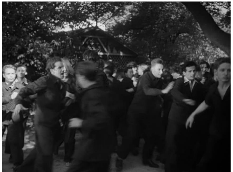
Figure 50 : L'indécision de la foule empêche la cohésion du groupe ( Le Carrefour des enfants perdus )