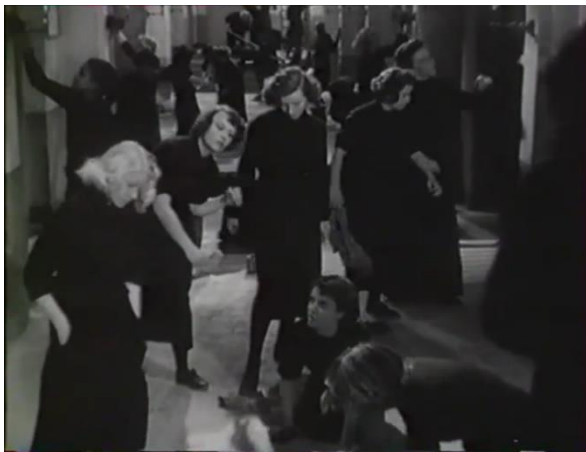
Figure 15 : Engagement du corps dans le travail ( Prison sans barreaux )

Mme Appel : « Depuis vingt ans que je suis dans cette maison, ce sont toujours les détenues qui ont déchargé le charbon. »