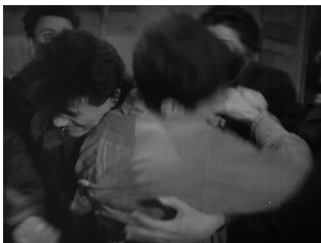
Figure 46 : Proximité de l'action, mise en valeur du mouvement dans la violence ( Le Carrefour des enfants perdus )

passage formel, transition entre l'organisation stricte des élèves dans la cour et la nouvelle organisation en chorale. Cependant, la violence est plus de l'ordre de la chamaillerie, contrairement à la scène du Carrefour des enfants perdus . Celle-ci est plus longue et présente un véritable enjeu dans le chemin que Joris parcourt pour devenir un chef. Ses camarades et lui