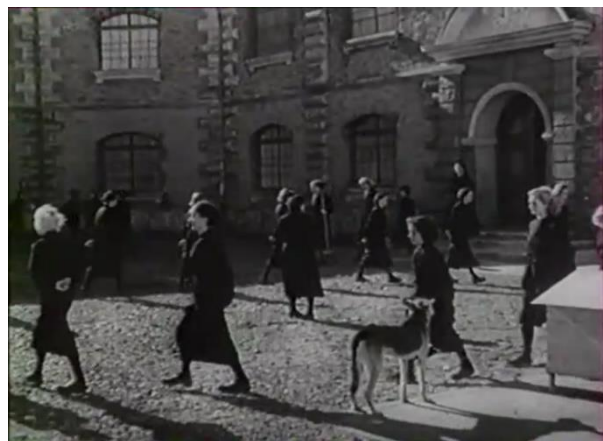
Figure 28 : Ronde des pensionnaires (2/3) : synchronisation parfaite des corps et contrôle rigoureux (Prison sans barreaux)