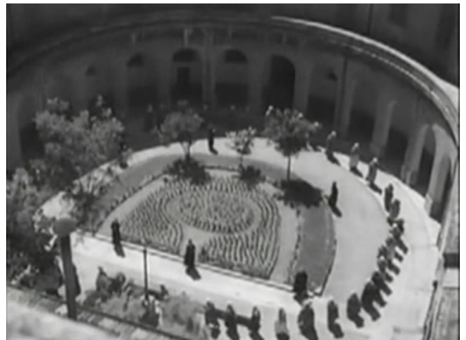
Figure 25 : Ronde des prisonnières (1/2) : encerclement et domination du groupe ( Prisons de femmes )

et dominant cet ensemble en lui donnant une cohérence. La cour est, par définition, à l'intersection de l'extérieur et de l'intérieur : c'est un espace contenu, mais à ciel ouvert. Il occasionne dans les deux films de 1938, Prisons de femmes et Prison sans barreaux , une mise en scène analogue du point de vue architectural. Dans le premier film, un panoramique balaye horizontalement la ville de Montpellier avant de basculer vers l'intérieur de la rotonde de la prison centrale 124 . Les détenues apparaissent