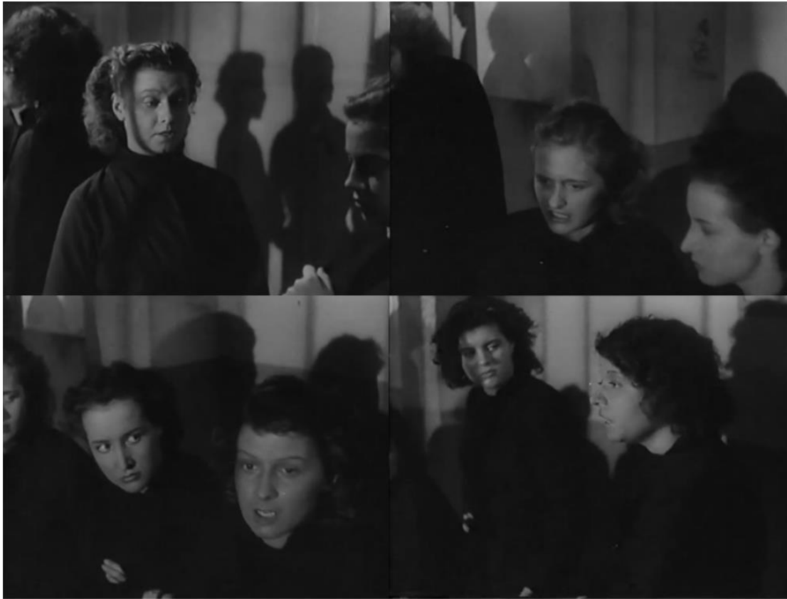
Figure 42 : De gauche à droite et de haut en bas, progression de visage en visage ( Prison sans barreaux )

est contraint et mis à mal par des institutions qui refusent d’y donner crédit. Il suffira donc aux réformateurs d’écouter et d’encourager le développement de ce désir de morale et de liberté.