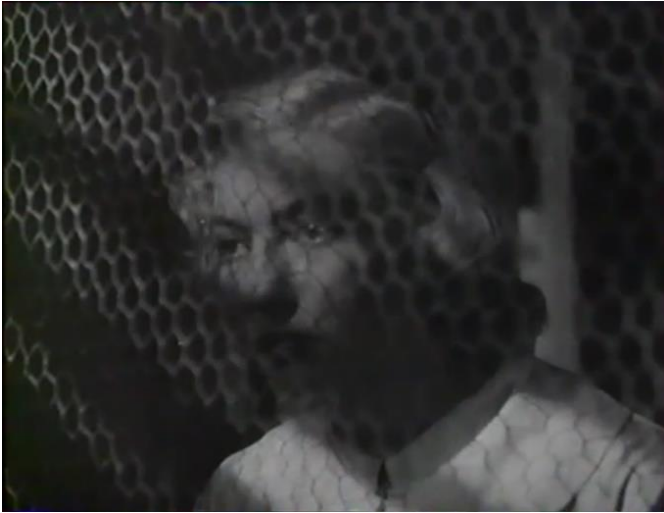
Figure 22 : Représentation hégémonique de l'enfermement (Prison sans barreaux)

prise de conscience momentanée de l'enfermement à un moment précis et leur volonté de sortir. On peut le voir pour Nelly chez Moguy (fig. 22) quand elle voit partir le docteur qu'elle aime ou encore, chez Bresson, alors que Thérèse court le long d'un couloir depuis la profondeur de champ. Son mouvement est accentué par la perspective et l'utilisation d'une focale courte (fig. 23). Alors apparaît de manière inattendue, diabolus ex machina , une grille qui se ferme