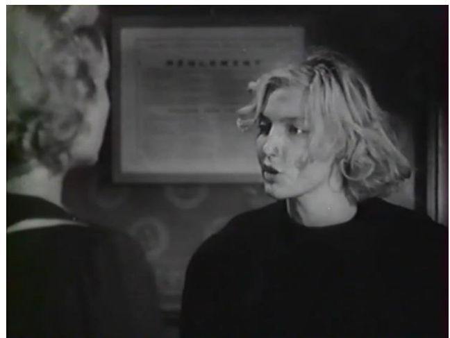
Figure 59 : Contrechamp : Résistance et sauvagerie de Nelly ( Prison sans barreaux )

D'autre part, dans La Cage aux rossignols , Mathieu se distingue justement de l'injonction virile et autoritaire du directeur Rachin. Plutôt timide et réservé, c'est sa sensibilité qui va lui permettre de gagner l'affection des orphelins. Dès son entrée dans le centre, il est écrasé dans un plan très large par le mur de l'orphelinat et, plus tard, ne sait comment se tenir face aux enfants (fig. 60). La voix off vient accentuer le malaise flagrant du personnage qui change sans cesse de position, tentant d'arborer une forme de dureté, mais sans parvenir à l'assumer : « Tous ces jeunes yeux étaient braqués sur moi. Moi, le nouveau. Pour mon autorité future, il me fallait prendre une attitude digne et ferme. Je fis des efforts dans ce sens, mais mon naturel timide ne servit pas mes desseins... » Deux ans après Le Carrefour des enfants perdus , les représentations ont déjà changé et le personnage de Clément Mathieu prend le contre-pied de l'attitude assurée de Jean Victor. Les principes vichystes semblent avoir déjà perdu beaucoup de leur influence au profit de la douceur et de la gaieté. Mais cela relève aussi de la persona de l'interprète Noël-Noël, vedette de l'époque, connu surtout pour son rôle-titre dans la série de films comiques