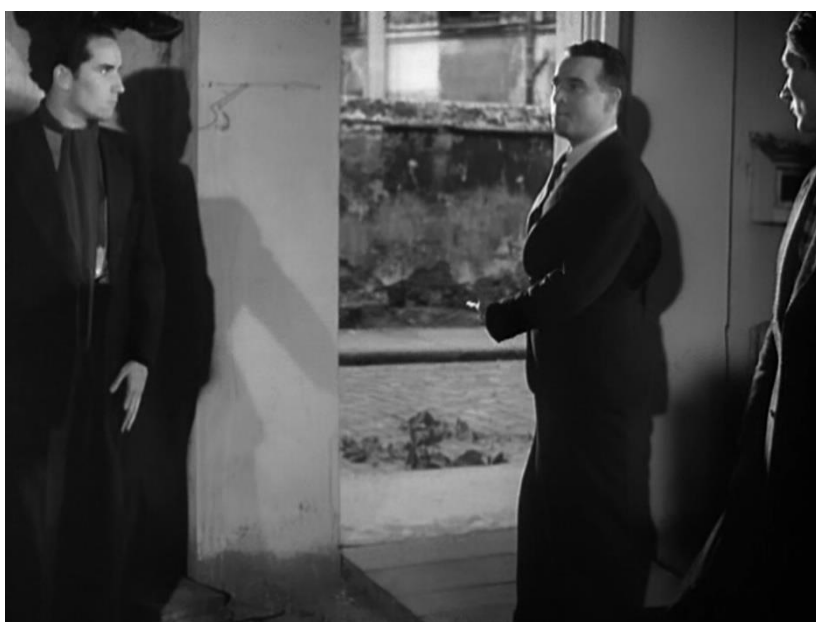
Figure 66 : La porte du centre n'est pas verrouillée, ouverture de la profondeur de champ sur la rue ( Le Carrefour des enfants perdus )

Les objectifs du directeur du Carrefour sont de prendre le contre-pied des patronages en tous points. C'est pour cette raison qu'il pousse les enfants, dès le premier repas au centre, à parler à voix haute, se félicitant même avec ses confrères du brouhaha que cela occasionne. Malory, qui a été marqué par la discipline stricte dans sa jeunesse, a quelques réticences instinctives, mais finit par s'y faire. Jean Victor réemploie, d'ailleurs, plusieurs fois la formule « On n'est pas en prison ici. » et cela se traduit dans la gestion des bâtiments et des espaces. Le réfectoire du centre est une grande salle dans laquelle on mange « tous ensemble, en famille ». Quand la bande de Joris essaye de s'enfuir en passant par-dessus le mur au cours de l'émeute, Jean Victor leur fait remarquer que les portes ne sont même pas verrouillées (fig. 66). Enfin, quand le centre est sauvé par la distribution des bons de solidarité, Gerbault, le fonctionnaire du secrétariat général de la Jeunesse, demande où il veut que l'on déplace le centre – « à la