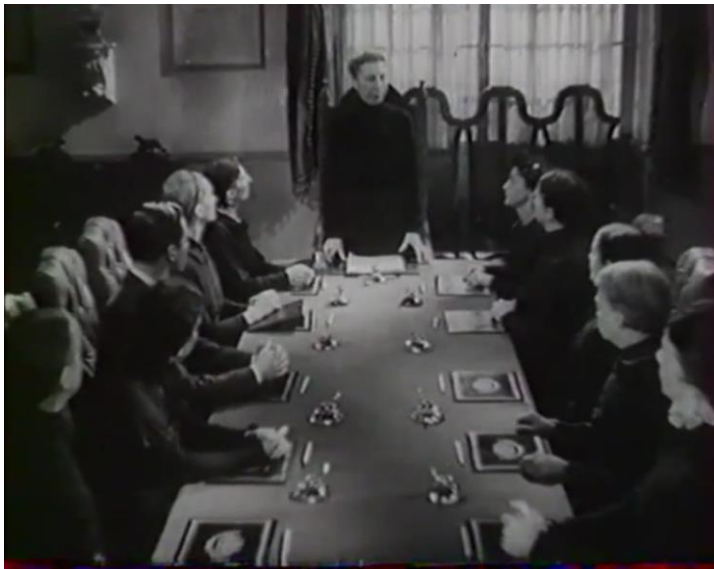
Figure 3 : Mme Appel et son personnel ( Prison sans barreaux )

Mme Appel est interprétée par la comédienne Maximilienne, habituée de ce genre de rôles de vieilles filles sévères et austères. Un journaliste de Marianne décrit la directrice en ces mots : « un profil d'oiseau de proie sur un corps d'échassier, une voix d'une sécheresse et d'une acidité presque insoutenables, un sens aigu de la mesure et de la dureté 78 ». Sa rigueur et celle de ses surveillantes sont soulignées par leurs tenues : elles sont engoncées dans des uniformes noirs,