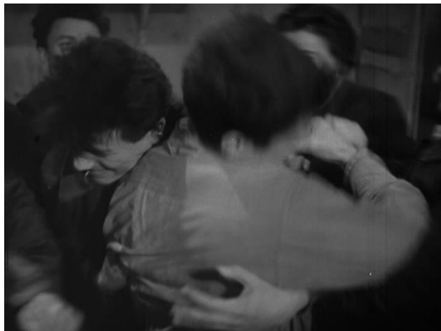
Figure 46 : Proximité de l'action, mise en valeur du mouvement dans la violence ( Le Carrefour des enfants perdus )

passage formel, transition entre l'organisation stricte des élèves dans la cour et la nouvelle organisation en chorale. Cependant, la violence est plus de l'ordre de la chamaillerie, contrairement à la scène du Carrefour des enfants perdus . Celle-ci est plus longue et présente un véritable enjeu dans le chemin que Joris parcourt pour devenir un chef. Ses camarades et lui