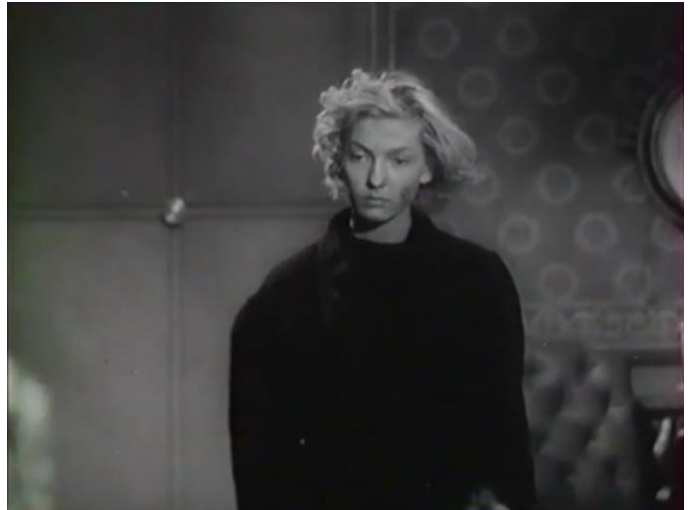
Figure 414 : Visage sale, cheveux en bataille et regard défiant ( Prison sans barreaux )

personnage par Corinne Luchaire est d'autant plus intéressante que l'on apprend dans la communication autour du film qu'elle a visité une maison de correction pour préparer son rôle, alors que c'était défendu 158 , ainsi l'argot employé, bien qu'écrit à l'avance par le scénario, et son personnage revêche et subversif tendent à créer autour du personnage un effet de réel et à mettre en avant la dimension documentaire de ce film.