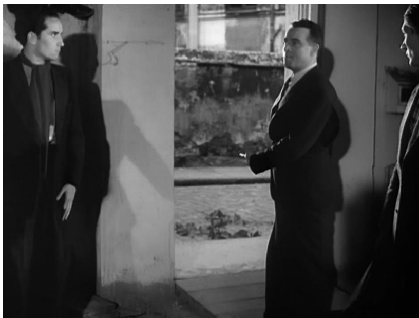
Figure 66 : La porte du centre n'est pas verrouillée, ouverture de la profondeur de champ sur la rue ( Le Carrefour des enfants perdus )

que l'on déplace le centre – « à la montagne, à la campagne ? ». Le directeur décide de s'implanter à Courbevoie, autrement dit « chez eux », « leurs quartiers, les usines, la rue, c'est là qu'il faut qu'ils soient transformés ». Cette position est assez surprenante, car elle répond à une logique inverse à celle du retour à la terre prôné par Vichy et dont les premières versions du projet étaient plus proches, car il s'agissait alors d'aller construire un pont à Aspremont dans les Alpes 248 et, encore avant cela, alors que le projet de film avait pour titre Le Grand Départ , de rebâtir un village abandonné pour l'offrir aux sinistrés de la guerre 249 . De plus, cette décision semble aussi entrer en contradiction avec la nécessité d'isoler les enfants du milieu qui les a mis sur la mauvaise voie, idée que l'on perçoit davantage dans les films qui ont précédé depuis Le Chemin de la vie . Peut-être faut-il en conclure que Jean Victor fait ce choix exprès pour amener les jeunes à refuser par