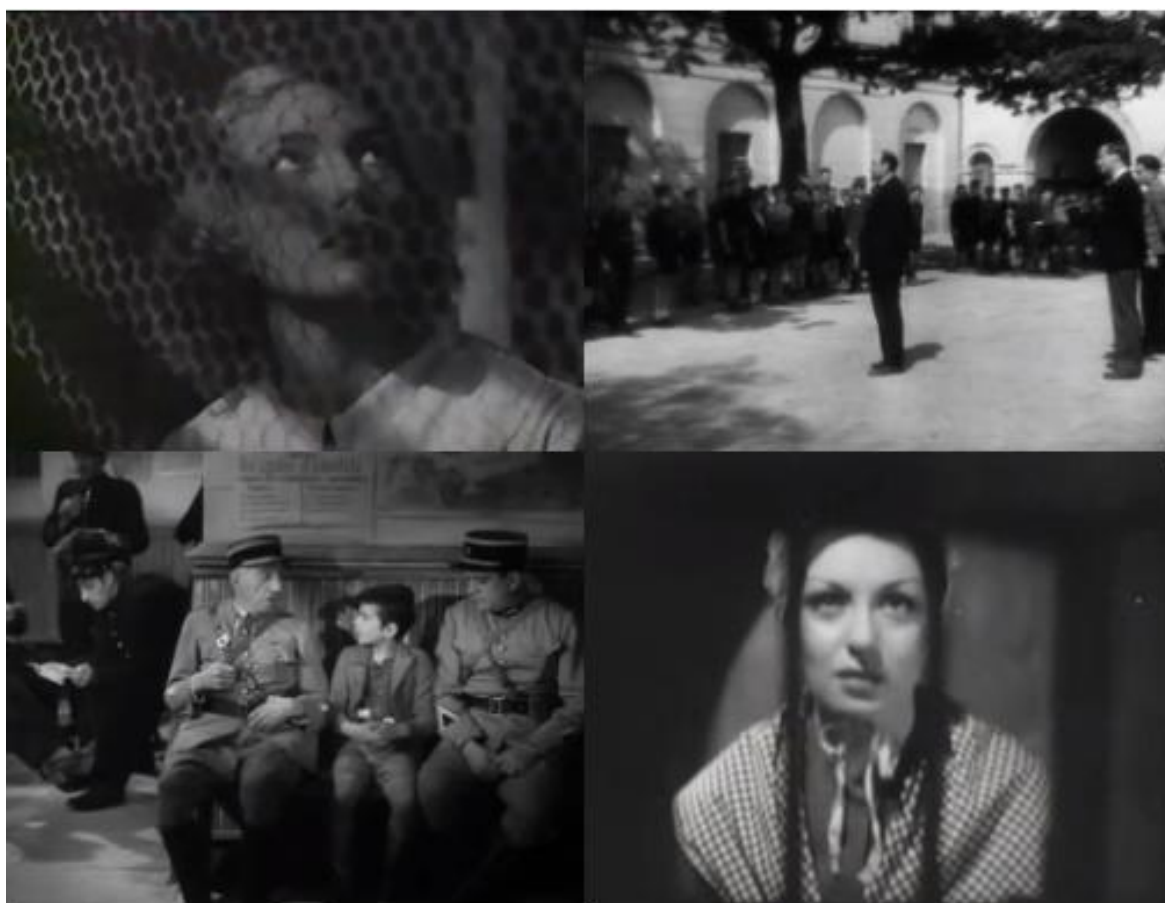
De gauche à droite et de haut en bas : photogrammes issus de Prison sans barreaux, La Cage aux rossignols, Le Carrefour des enfants perdus et Prisons de femmes

Prison sans barreaux de Léonide Moguy (1938) Prisons de femmes de Roger Richebé (1938) Les Anges du péché de Robert Bresson (1943) Le Carrefour des enfants perdus de Léo Joannon (1944) La Cage aux rossignols de Jean Dréville (1945)