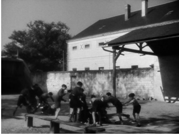
Figure 45 : Résurgence du motif violent ( La Cage au rossignol )

Dans Le Carrefour des enfants perdus et La Cage aux rossignols , ont lieu d'autres scènes de bagarre, mais pour d'autres raisons. Dans le premier cas, Joris veut empêcher ses camarades de