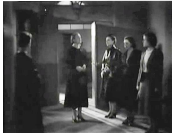
Figure 7 : Arrivée de Juliette en prison, injonctions chorégraphiées 4/4 ( Prisons de femmes )

C'est la mise en scène et la reproduction de motifs analogues tout au long de la scène qui nous permettent ici d'affirmer que Richebé pose dans ce plan l'un des enjeux esthétiques et discursifs essentiels pour comprendre la représentation de la discipline au cinéma : la contrainte et l'obéissance du corps. En effet, la présence du personnel à l'écran est systématiquement accompagnée d'ordres donnés aux détenues suivis de la réponse de celles-ci, limitée, par le silence qu'impose la discipline, aux mouvements du corps. Dans le plan précédent, Juliette était écrasée symboliquement par le fronton de la prison, ici, le placement de l'objectif dans l'axe des deux portes n'indique pas seulement l'enfermement de plus en plus profond et l'écart qui se crée avec l'extérieur, mais le double surcadrage qu'il occasionne répond à la double injonction spatiale des gardiennes. Le déplacement des jeunes femmes est contraint dans ce nouveau milieu et le parcours limité à une seule option qu'on les force à respecter et qui les éloigne de plus en plus de l'extérieur. Il n'y a littéralement pas d'écart possible (ou du moins prévu), ni par rapport au règlement ni par rapport au mouvement imprimé dans le corps par