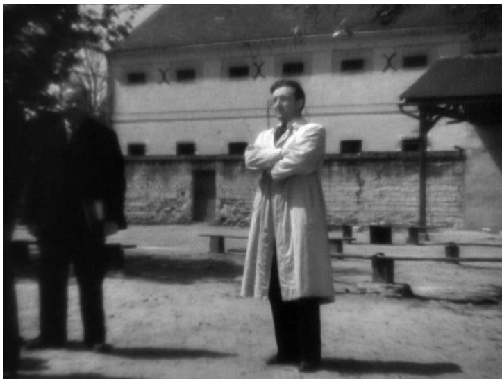
Figure 60 : Malaise de Clément Mathieu, remise en question de la virilité ( La Cage aux rossignols )

Adémaï . La candeur de cet autre personnage crée une forme d'attente autour de l'apparition de Noël-Noël dans La Cage aux rossignols comme en témoignent les journaux de l'époque, satisfaits de reconnaître par moments « la face naïve et goguenarde d'Adémaï 218 » et de voir l'acteur « dans son personnage habituel, avec sa timidité, sa résignation de victime consentante, son regard de poète où passe parfois cette curieuse flamme d'impitoyable ironie mêlée d'une indulgence sans bornes 219 ». On trouve encore bien des qualificatifs pour décrire ce personnage qui évoquent toujours une certaine fragilité : tendre, fin, simple, gentil, touchant, vrai, pur, naturel, craintif, bafouillant, confus, timide, doux, etc. Ce personnage dénote par rapport au monde qui l'entoure et semble le dépasser d'une certaine manière. Georges Zevaco, non sans une