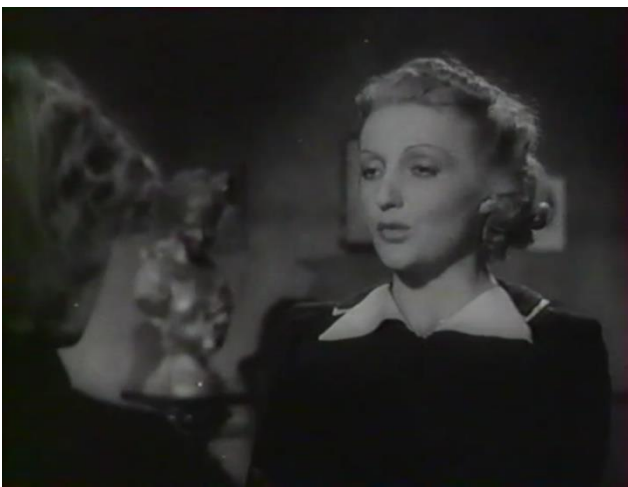
Figure 58 : Champ : noblesse et grandeur d'Yvonne ( Prison sans barreaux )

replaces tendrement une mèche de cheveux de Nelly, mais elle se maintient par ailleurs à une certaine distance. L'arrivée fracassante de Mme Appel qui saisit le poignet de Nelly pour la punir donne une explication à son recul face à Yvonne : dans le pensionnat, le contact physique relève toujours de la violence, de la punition et de l'autorité. Il y a donc bien une forte analogie entre les deux relations éducateur·ice-pensionnaire présentes dans Prison sans barreaux et Le Carrefour des enfants perdus . Elle porte à considérer que la virilité de Joris et Jean Victor n'implique pas une altération fondamentale du schéma narratif et des enjeux du récit, mais relève davantage, à cet égard, d'un choix formel. En d'autres termes, la virilisation des comportements dans Le Carrefour des enfants perdus témoigne de la manière dont la rééducation elle-même peut être esthétisée.