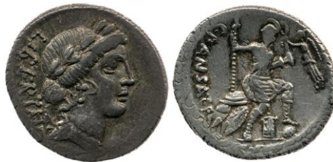
Figure 1 : Denier d'argent frappé par Caius Vibius Pansa en 48 av. J.-C., représentant sur le droit, la Liberté couronnée de lauriers et, sur le revers, la déesse Roma assise sur une pile d'armes, tenant un sceptre dans la main droite et ayant le pied gauche sur le globe. La déesse de la Victoire vole pour la couronner 12 .

Mon étude suivra la chronologie de l'œuvre, afin de mettre en lumière l'évolution dans le traitement du personnage.