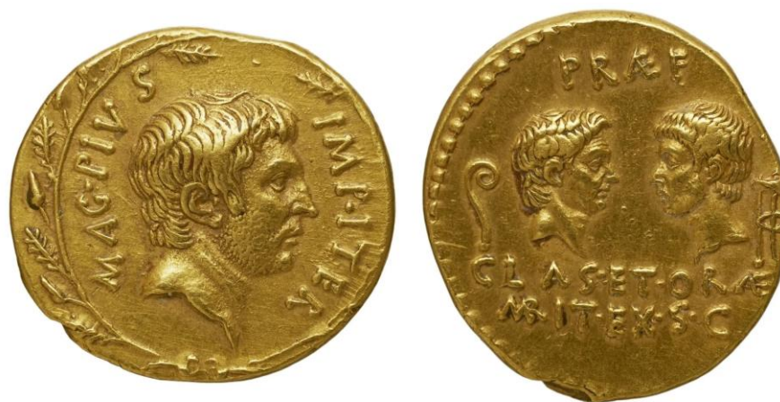
Figure 2 : Au droit : tête nue et profil barbu de Sextus Pompée. Au revers : Têtes de Cn. Pompeius Magnus à gauche et de Cn. Pompeius le Jeune à droite, se faisant face, sur les côtés, lituus et tripode 135 .

Sextus est donc toujours présenté et perçu comme le fils de Cn. Pompée. Son nom le sert et l'oblige. Certes, il jouit du prestige d'une gens et de l' auctoritas qui en découle, mais il se trouve également constamment comparé à son père et son action n'est examinée que par rapport à la sienne en ce qu'elle la complète ou la discrédite, selon le point de vue adopté.