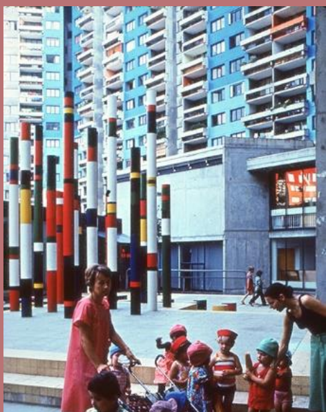
Image 3 : Sans titre (détruite), Guy de Rougemont, 1975 (Galerie de l'Arlequin, Grenoble)

de la construction des quartiers sud-grenoblois, l'association des artistes sur le quartier de l'Arlequin ou des Baladins avaient une intention « de création partagée élargie à l'aménagement de l'espace public » (Le Vot, 2017) qui se voulait avant-gardiste.