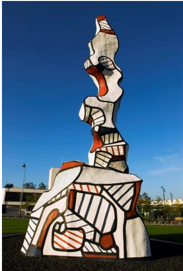
Image 1 : « Chaufferie avec cheminée », Jean Dubuffet, 1996 (Vitry-sur-Seine)

de la rénovation de son centre-ville (Smadja, 2003). Autre exemple avec la création de l'Établissement Pour l'Aménagement de la Défense (EPAD) en 1958, dont le président souhaitait la réalisation de commandes d'œuvres monumentales (Smadja, 2003). Plus tard, il ne s'agira plus de commandes d'œuvres aux artistes mais de leur commander la