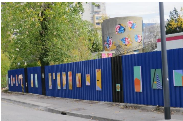
Image 6: Palissade "Bribes", Maud Guerche, 2021 (Grenoble)

L'échelle de projet Grandalpe constitue un autre niveau d'emboîtement : les démarches artistiques s'incluent elles aussi dans ce récit de projet urbain. Au-delà de ce lien avec les transitions, elles font dans leur narration échos aux ambitions de Grandalpe. A travers GR-Grand-Gre, encourager la marche dans la ville rejoint les ambitions de la "ville-parc", proposer une relecture des paysages rejoint cette ambition de changement d'image, créer des sentiers artistiques est une façon de rendre des lieux attractifs. A travers Marbre d'ici, la réutilisation des gravats permet une vision différente des démolitions, l'organisation d'ateliers participatifs rejoint les ambitions d'un projet co-construit avec divers acteurs. De manière plus globale, faire venir des artistes sur le projet témoigne d'un dynamisme et d'un intérêt pour le territoire, montre qu'il y a une volonté d'innover et faire original. Pour illustrer cela, on peut prendre l'exemple de la palissade de Maud Guerche. Une œuvre à vocation plutôt décorative, mais qui propose une « proximité et un rapport direct au sensible ». Les retours qu'elle a pu avoir de la part