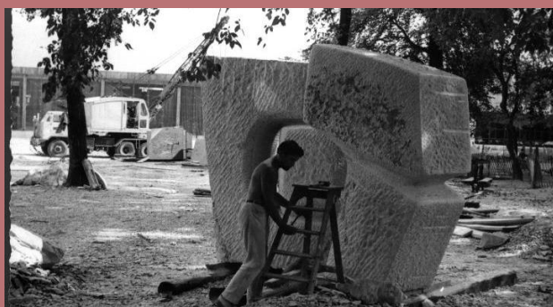
Image 2 : Installation de Naissance d'une chose intérieure, Ivan Avoscan, 1967 ( Village Olympique, Grenoble)