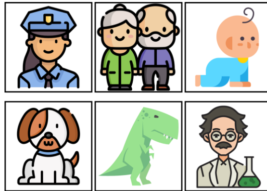
Figure 4. Exemples de cartes personnalisées représentant d'éventuels protagonistes d'histoires

Certaines cartes représentent également des protagonistes à faire intervenir dans les histoires produites par les apprenants.