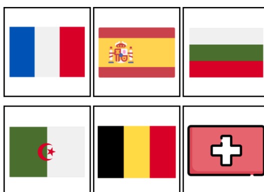
Figure 6. Exemples de cartes personnalisées utilisées lors de la cocréation d'histoires par les apprenants

Pour expliquer l'activité suivante, nous allons brièvement faire référence à une activité d'écriture créative que nous décrirons plus précisément dans le point 3.3.1. de ce chapitre. Lors d'un atelier d'écriture, les petits groupes ont eu l'occasion de concevoir leurs propres personnages. L'élaboration de ces personnages ont donné lieu à la création d'histoires les concernant. Par exemple, lors d'un retour de vacances scolaires, chaque groupe d'apprenants a été invité à imaginer à l'oral les vacances de son personnage. Afin de les guider et de les aider à élaborer une histoire complète et cohérente, nous leur avons distribué des cartes représentant différents thèmes. Pour commencer, ils devaient se mettre d'accord sur la destination de vacances de leur protagoniste. Ils avaient en leur possession plusieurs cartes représentant des drapeaux de pays francophones ou des drapeaux des pays d'origine de nos apprenants comme ci-dessous.