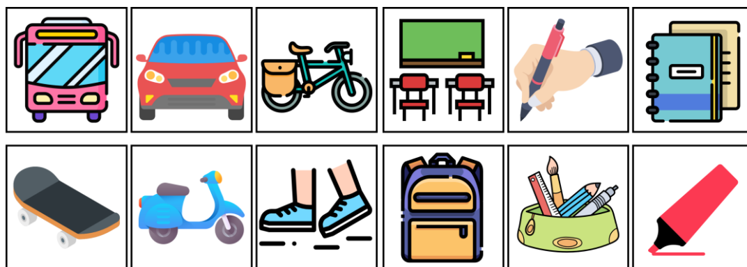
Figure 3. Exemples de cartes personnalisées sur les thèmes des moyens de transport et de l'école

Le premier matériel réalisé pour les classes de FLE de l'IES La Plana a été des cartes d'illustrations personnalisées en fonction des besoins et des intérêts des apprenants. La première étape de l'élaboration de ce matériel a été la création de l'ensemble des cartes au format numérique à l'aide de la banque d'icônes gratuites Flaticon et de la plateforme de conception graphique Canva . Par la suite, les cartes ont été imprimées en couleur et plastifiées afin de maximiser leur durabilité. Les illustrations choisies représentent du vocabulaire à acquérir en première et deuxième année de l'ESO. Par exemple, on retrouve le vocabulaire des moyens de transport et de l'école.