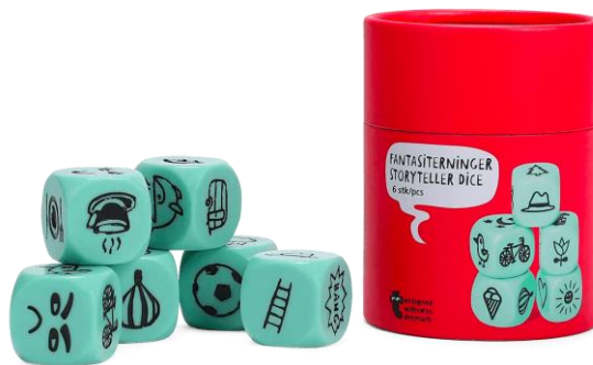
Figure 2. Les dés « déclencheurs d'histoires » de Flying Tiger Copenhagen

Ce jeu de la marque danoise Flying Tiger Copenhagen , est composé de 6 dés à 6 faces. Chaque dé est unique et est constitué de 6 illustrations différentes.