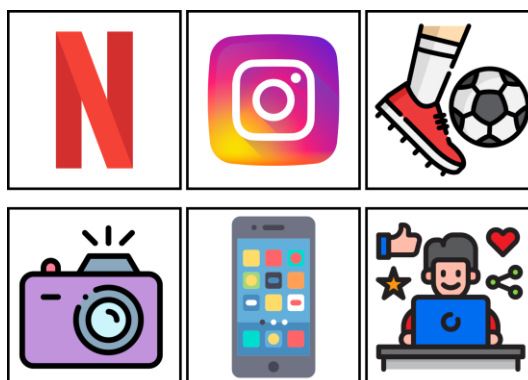
Figure 5. Exemples de cartes créées à partir des goûts des apprenants de la classe de 2ESO

Enfin, grâce au questionnaire (annexe 1) distribué aux élèves en début de projet, nous avons pu mieux les connaître et ainsi personnaliser nos cartes en fonction de leurs goûts et de leurs passe-temps.