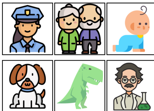
Figure 4. Exemples de cartes personnalisées représentant d'éventuels protagonistes d'histoires

Certaines cartes représentent également des protagonistes à faire intervenir dans les histoires produites par les apprenants.