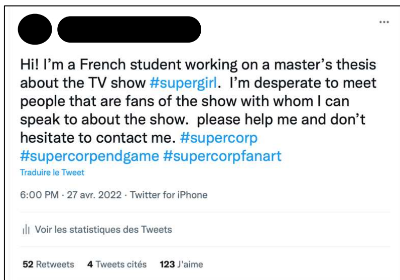
Figure 1 : Tweet de recherche d'enquête-es 69

Ce tweet a eu un succès immédiat car il a notamment été retweeté plus de 50 fois, et j'ai reçu des dizaines de messages de fans acceptant de se soumettre à l'exercice de l'entretien épistolaire.