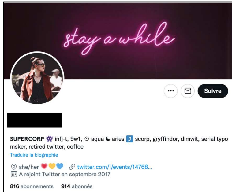
Figure 8 : Capture d'écran du profil Twitter de Clarke, 26 ans, architecte, Angleterre

Les trois captures d'écran ci-dessus sont représentatives de la manière dont les fans Supercorp en général et les enquêtés-fans en particulier se présentent sur Twitter . Tous les profils utilisent soit le terme « Supercorp » soit le #supercorp dans leur biographie pour affirmer ainsi d'abord leur identité de fan avant toute autre identité qui serait un peu plus conventionnelle.