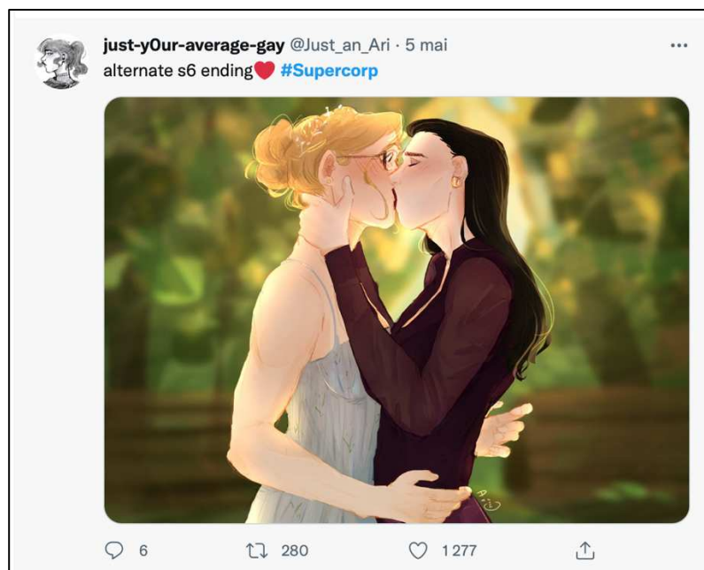
Figure 13 : Exemple de fanart Supercorp sur Twitter