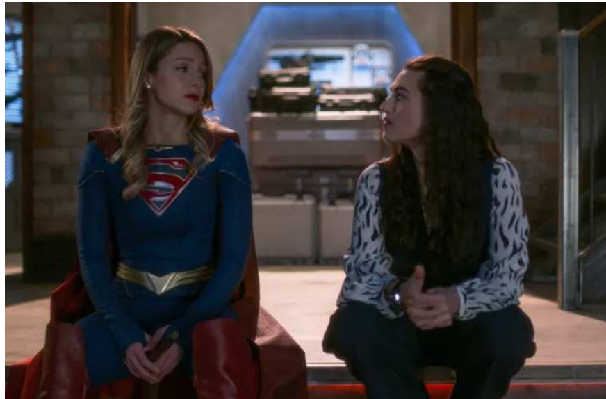
Figure 10 : Supergirl et Lena Luthor (saison 6, ep 13)