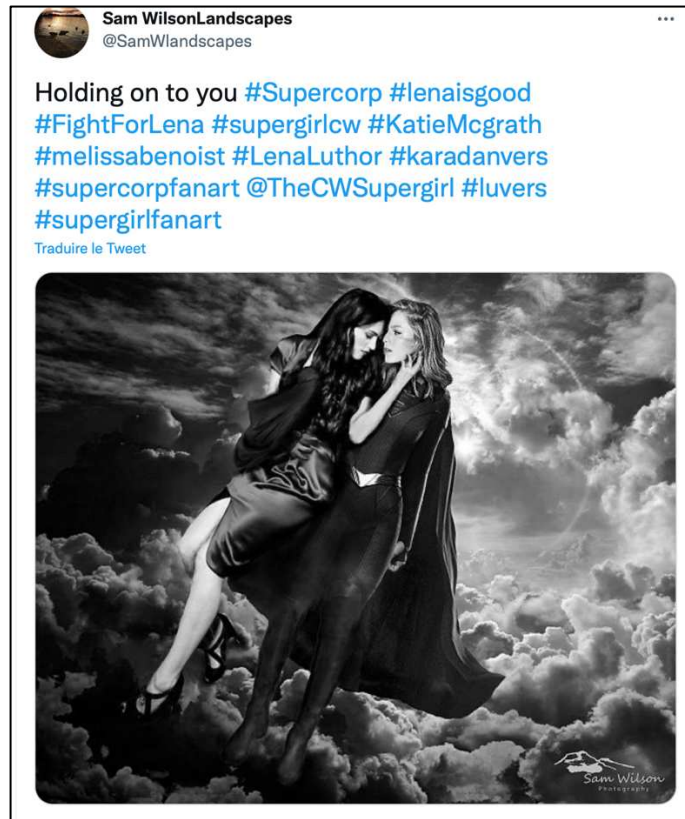
Figure 12 : Exemple de fanart Supercorp sur Twitter