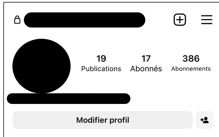
Figure 3 : Capture d'écran de mon profil Instagram

Sur Instagram mon profil s'affiche de la manière suivante :