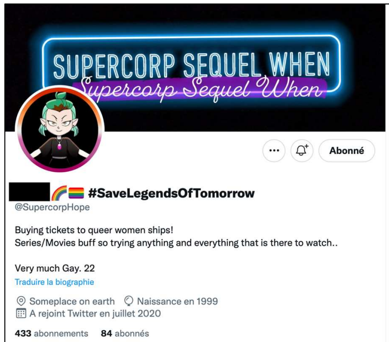
Figure 9 : Exemple d'un profil de fan montrant son engagement militant dans sa pratique de fan

contenus faisant la promotion d'une représentation lesbienne fictionnelle de qualité ; et d'autre part, de la prise de position, sur Twitter , pour « sauver » de l'annulation des séries de l' Arrowverse contre la volonté de la chaîne The CW . Cela est d'autant plus le cas lorsque dans ces séries des couples lesbiens sont présents. L'engagement militant se poursuit également pour réclamer une suite à Supergirl qui soit davantage centrée sur la relation entre les personnages de Kara et de Lena :