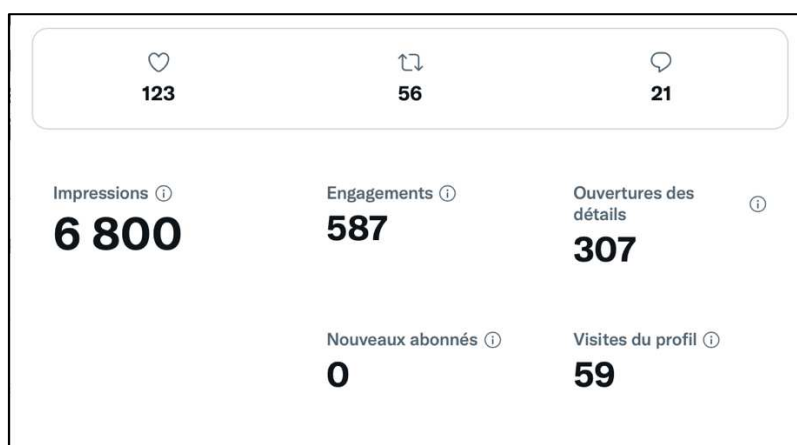
Figure 2 : Réception du tweet par la communauté

Ce tweet a eu un succès immédiat car il a notamment été retweeté plus de 50 fois, et j'ai reçu des dizaines de messages de fans acceptant de se soumettre à l'exercice de l'entretien épistolaire.