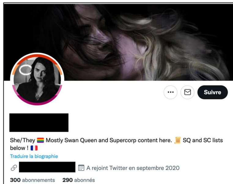
Figure 7 : Capture d'écran du profil Twitter d'Amandine, 21 ans, freelance videomaker, France