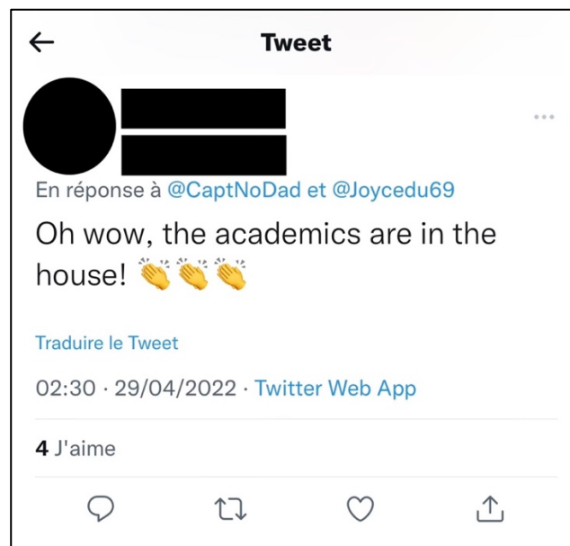
Figure 5 : Commentaire d'une fan sous mon tweet 71

Le sentiment de méfiance a alors pu être dépassé et ma présence en tant que chercheuse n'a plus été perçue comme intrusive mais a pu apparaître non seulement comme nécessaire mais aussi pertinente :