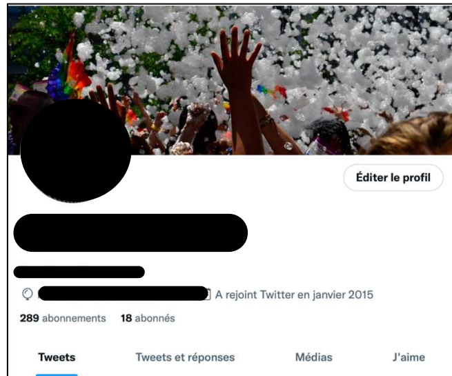
Figure 4 : Capture d'écran de mon profil Twitter

Malgré le fait qu'il n'y ait toujours pas de référence à la série Supergirl , les fans ont dû m'identifier comme queer grâce à ma photo de couverture et m'ont donc perçue comme une alliée.