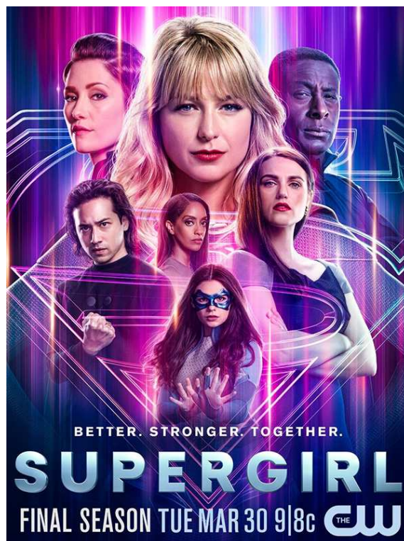
Figure 11 : Casting de Supergirl