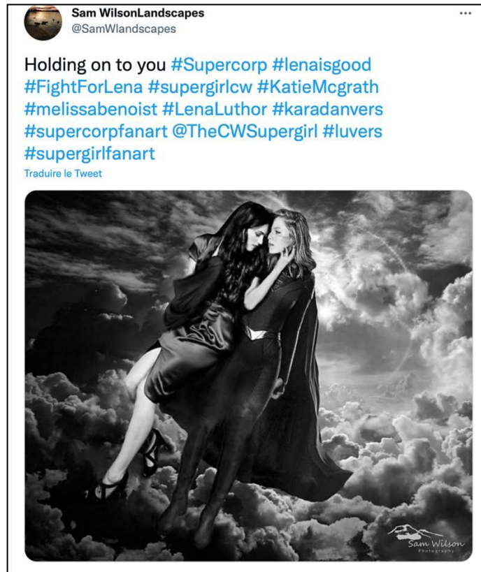
Figure 12 : Exemple de fanart Supercorp sur Twitter