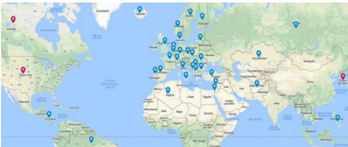
Etat des lieux de la SODEV dans le monde en 2017

L'utilisation est jugée facile dans 18% des cas et moyennement facile dans 73 % des cas. Les principaux facteurs limitants sont la durée de la séance et de la rétroaction parfois jugée trop longue, mais aussi le refus des étudiants. (23)