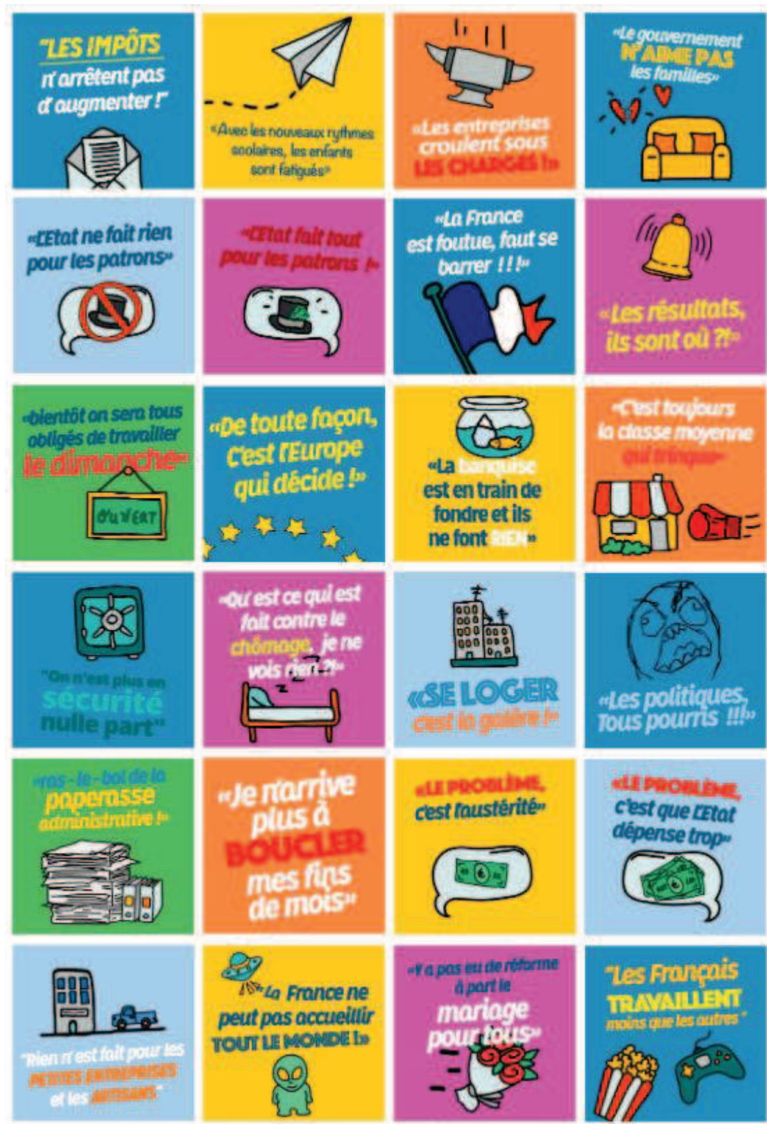
Capture d'écran 5 : Bingo #RepasDeFamille, les idées-reçues