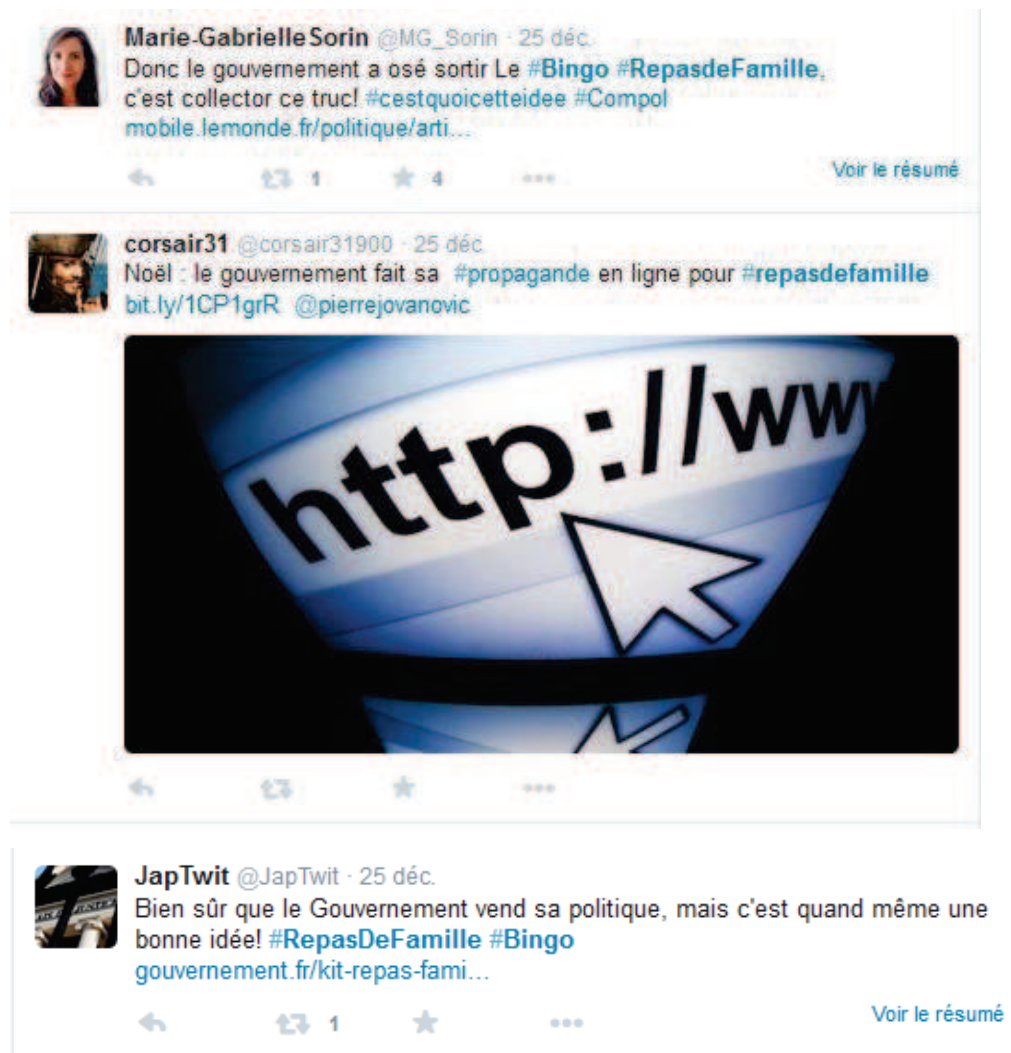
Capture d'écran 7 : Bingo #RepasDeFamille, extrait de conversation en ligne

Enfin, pour ce qui concerne la conversation en ligne suscitée par la campagne, le nombre de mentions (voir supra ) indique clairement que cette conversation est engagée à la suite de la campagne (voir capture d'écran 7 pour quelques exemples de tweets). Pour la qualifier, il faudrait cela dit disposer idéalement d'un accès au SAV @gouvernementFR et pouvoir analyser sur la base d'indicateurs qualitatifs l'ensemble des tweets postés avec les hashtags #Bingo et #RepasDeFamille à partir du 25 décembre 2014, travail d'investigation qui dépasse le cadre de ce mémoire. Une autre analyse intéressante serait celle des discussions engagées sur les forums de la presse en ligne à la suite des articles sur le Bingo et ce, d'autant plus qu'elle offrirait une typologie des commentaires par couleur politique et catégorie socio-professionnelle attachées aux différents lectorats – voir pour exemple en annexe les conversations engagées sur les forums du Parisien.fr et de Libération.fr dans lesquelles les