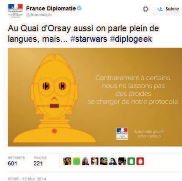
Capture d'écran 1 : Tweet France Diplomatie

La marque sociale gouvernement.fr n'existe pas avant 2014, ce qui peut paraître paradoxal dans la mesure où la marque web est en revanche une des plus anciennes (la version 1 du site gouvernement.fr date de 1995). En lien avec sa fonction interministérielle, le site du Premier ministre et du gouvernement est en effet conçu à l'origine comme un portail qui centralise ou agrège la communication des différents ministères et administrations indépendantes et il n'est alors pas question de donner consistance (sociale) à un « méta ministère » dont l'identité reste abstraite. Pour comparaison, certains ministères ont déjà à cette date, comme l'Elysée, une identité sociale. Le Ministère des Affaires Etrangères et son site France-diplomatie , sont à ce titre emblématiques en termes d'audience et de pratiques digitales. En février 2014, ils postent sur leur compte Twitter une vignette qui fait explicitement référence à Star Wars , une première en matière de communication institutionnelle.