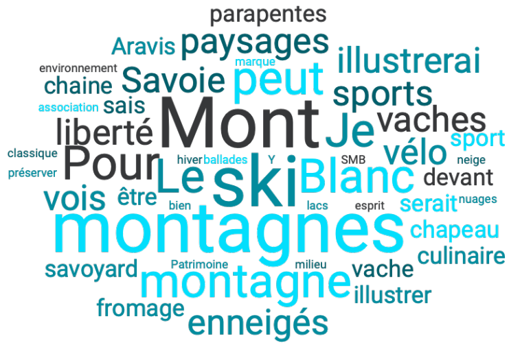
Nuage de mots issu de la réponse à la question « Pour illustrer la marque Savoie Mont Blanc, quelles images utiliseriez-vous ? »