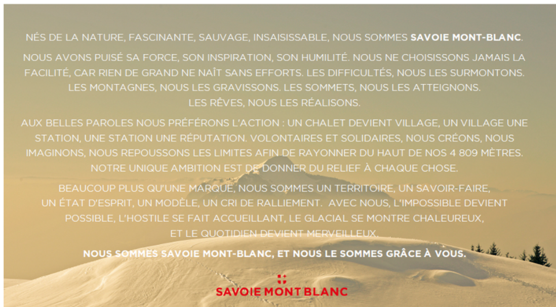
Figure 1 - Manifeste de la marque Savoie Mont-Blanc mis en ligne par l’Agence Savoie Mont-Blanc sur le site web de la marque, consulté le 2 mars 2022.

En naviguant sur le site de la marque Savoie Mont-Blanc nous avons accès à plusieurs documents en lien avec la stratégie de la marque (le plan marketing 51 ), son identité, ses valeurs explicitées dans ce manifeste et dans le document « plateforme de marque 52 ». Ces documents sont archivés dans l’onglet « Espace pro », qui permet au visiteur venu chercher de l’information de rentrer déjà dans une communication dite « B to B », portant ainsi une attitude de professionnel à l’étude et à l’utilisation de ces données.