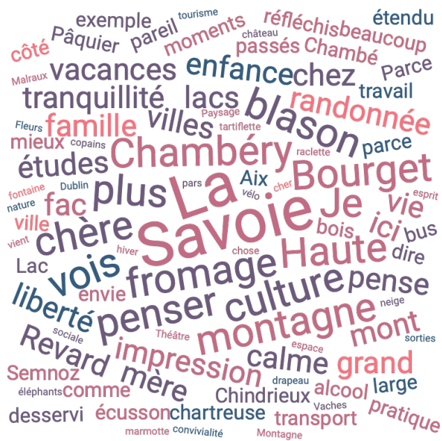
Nuage de mots issu de la réponse à la question « Que vous évoque la Savoie et la Haute-Savoie ? »