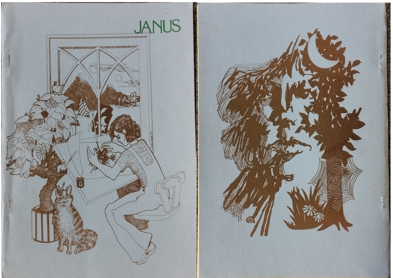
Figure 4 : Première et quatrième de couverture du quinzième numéro dessinées par Jeanne Gomoll