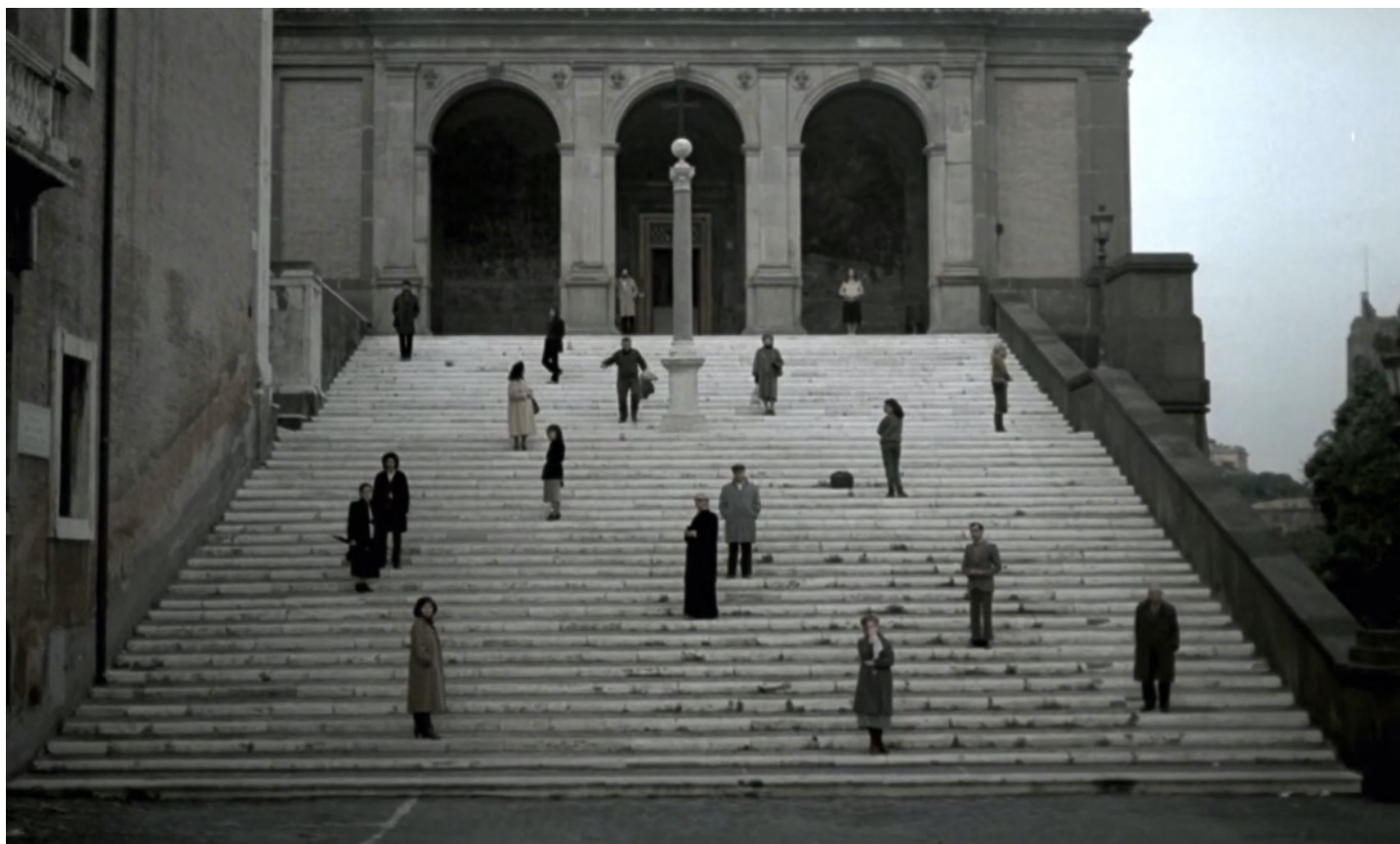
Fig. 17 - L'un des escaliers du Capitole

par la mort de l'homme. L'insensibilité de la foule est, ici, le symptôme d'un état de la société trop étrangère au rêve salvateur que Domenico enjoint de rendre réel.