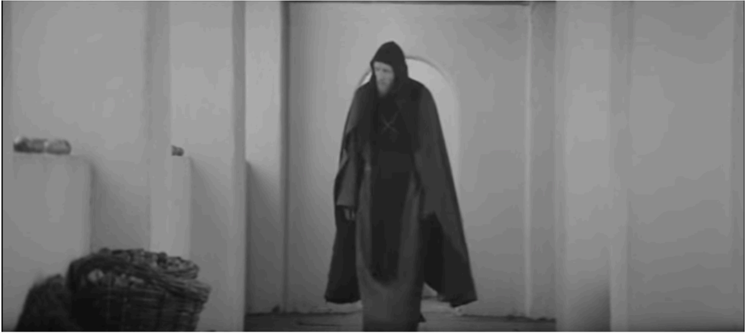
Fig. 8 - Entrée de Roublev au monastère d'Andronikov

C'est principalement parce qu'il est animé d'une foi incertaine qui suscite une quête l'emmenant vers un rapport plus profond au monde que le yourodivy semble fou. Comme dans les Récits d'un pèlerin russe avec lesquels le parcours de Roublev a des résonances, la vie de l'homme pieux est ponctuée d'errements, d'erreurs, de retournement et de moment d'isolement et de recueillement que les hommes du commun ne comprennent pas. Au delà de la folie feinte, la marginalité tient à la découverte d'une vérité profonde nécessairement étrangère à la norme sociale. On le comprend avec l'exemple de Roublev, les caractères latents du fol-en-Christ tendent à s'exprimer réellement lors de moments particuliers. Il s'agit de cristallisations, d'épiphanies, dans lesquels se condensent des vecteurs émotionnels fort : l'isolement volontaire du monde chez Roublev est la marque d'un individu pénétré par la foi, seule voie qui peut le conduire à une révélation incarnée par le retour glorieux à la création à la fin du film. Plus qu'une identité, le comportement singulier du yourodivy est surtout la marque ponctuelle d'une évolution provenant d'un doute, que l'on pourrait formuler comme le fait le peintre à son jeune apprenti « Toute chose contient une vérité qui échappe à la description. »