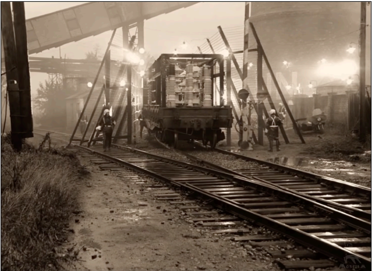
Fig. 18 - Le cordon sanitaire marquant l'entrée dans la Zone

Le Stalker est un passeur. Il sait naviguer l' « espace strié » du périmètre en restant sous le radar, il sait brouiller les codes, les lignes, il sait transgresser les frontières. Le Stalker correspond à ce que Deleuze appelle le « nomade » : il ne se déplace pas dans le périmètre selon les règles prédéfinies, mais en traçant des « lignes de fuite ». Andreï Roublev est aussi, à sa manière, une figure nomadique : pèlerin, il est emporté dans une errance à travers les steppes d'une Russie qui peine à s'unifier, à se centraliser en Etat. La ligne de fuite du yourodivy nomade — passeur ou pèlerin — fait effraction dans l'espace orthonormé du pouvoir. Réfractaire par sa nature même, mobile et errant, il finit parfois capturé ou réprimé par les appareils d'Etat qu'il déstabilisait, comme Alexander arrêté par des infirmiers ou Domenico par la gendarmerie.