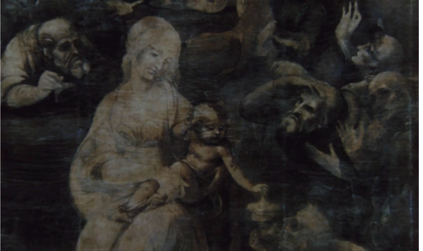
Fig. 24 - Détail de L'Adoration des Mages par Léonard de Vinci