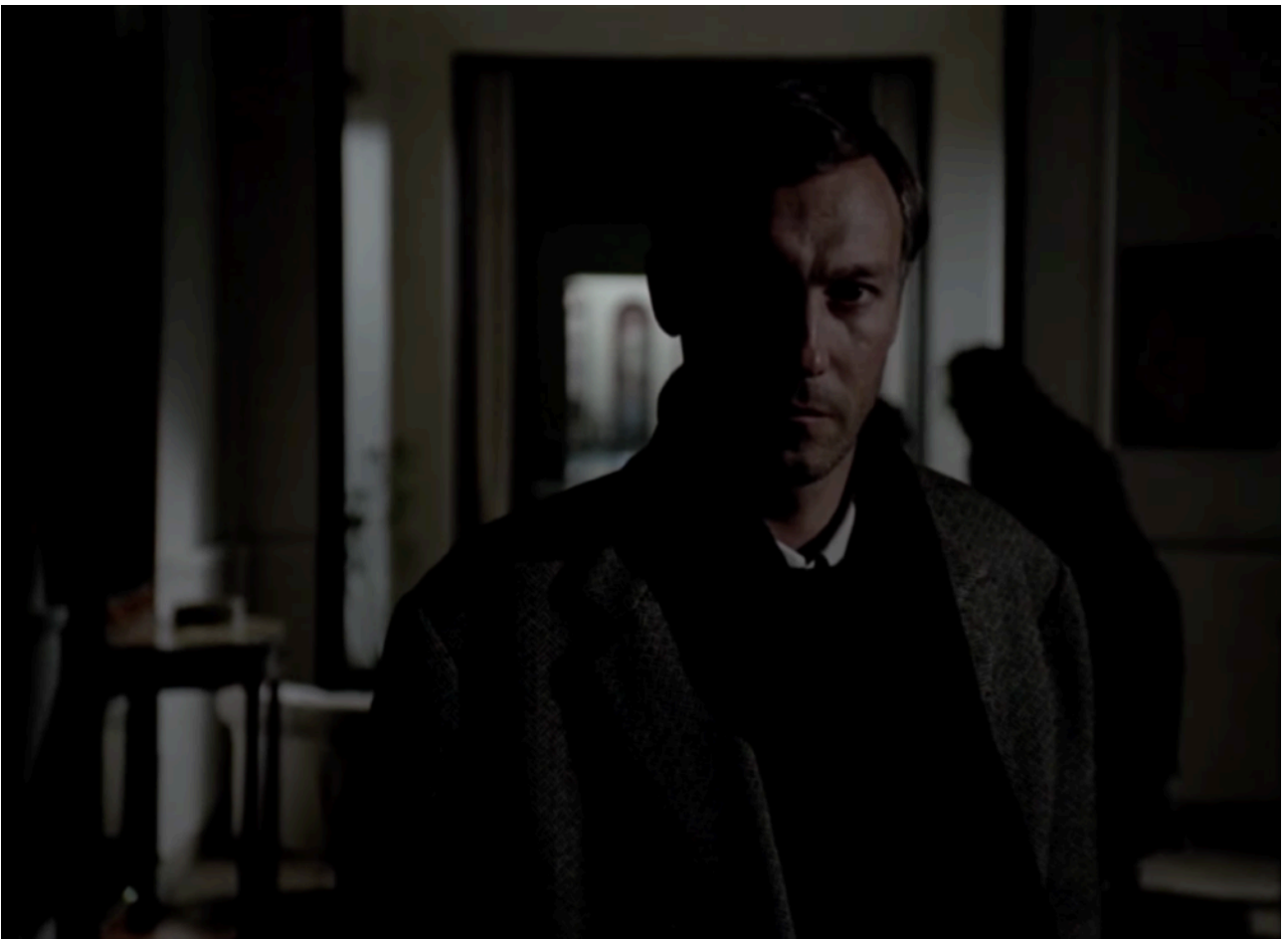
Fig. 12 - Andrei Gortchakov