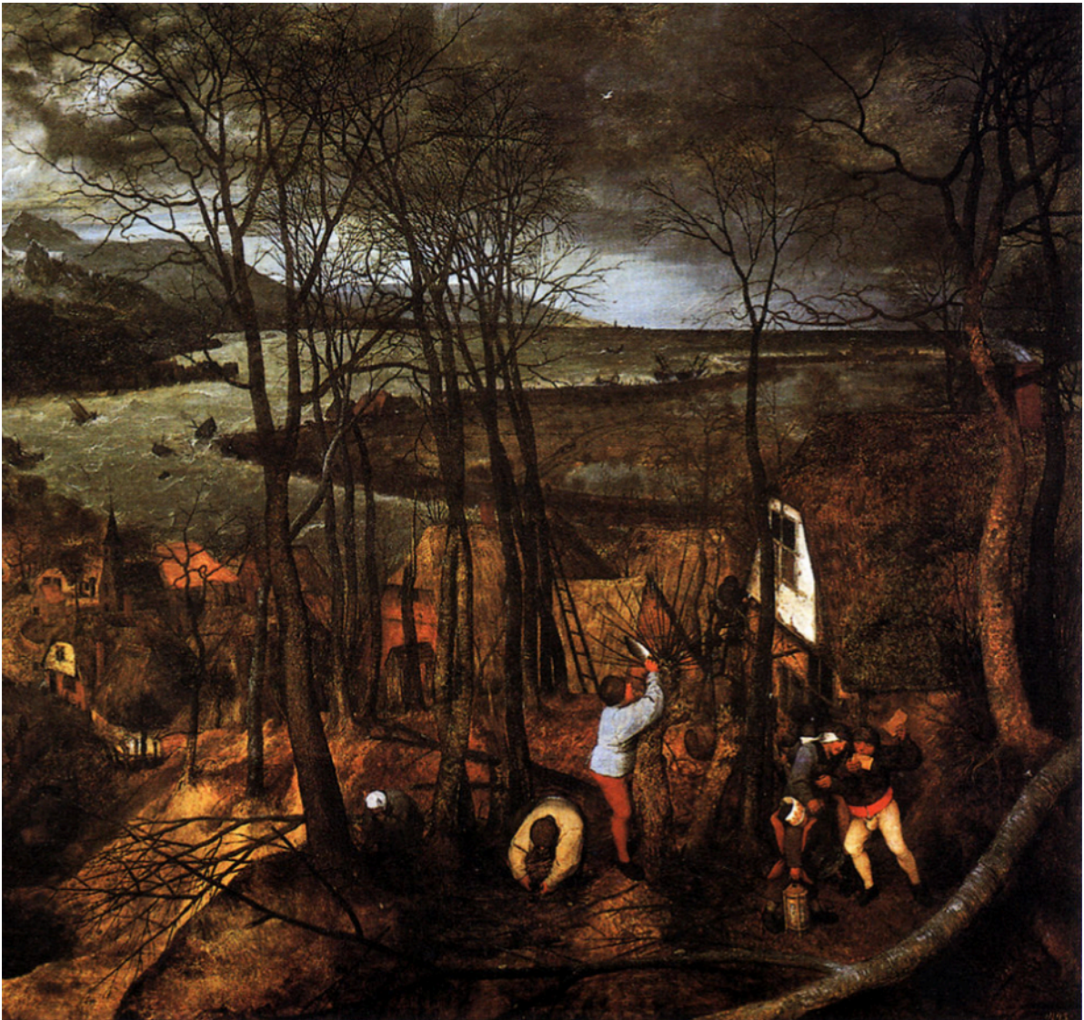
Fig. 7 - La Journée sombre, détail, Pieter Bruegel l'Ancien, 1565