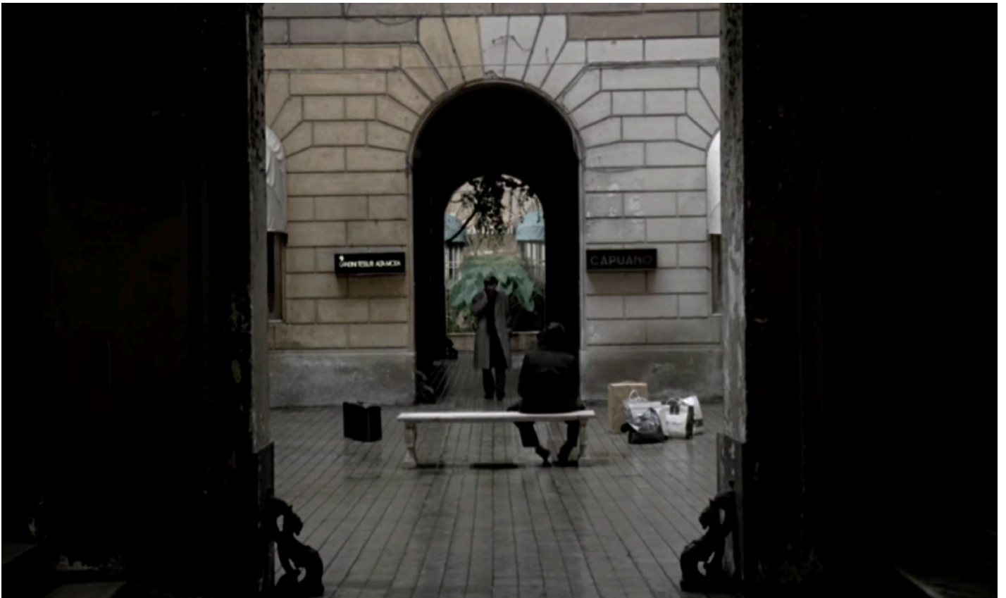
Fig.16 - Gortchakov sortant de hôtel