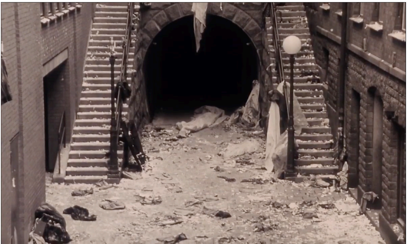
Fig. 21 - La première scène de rêve