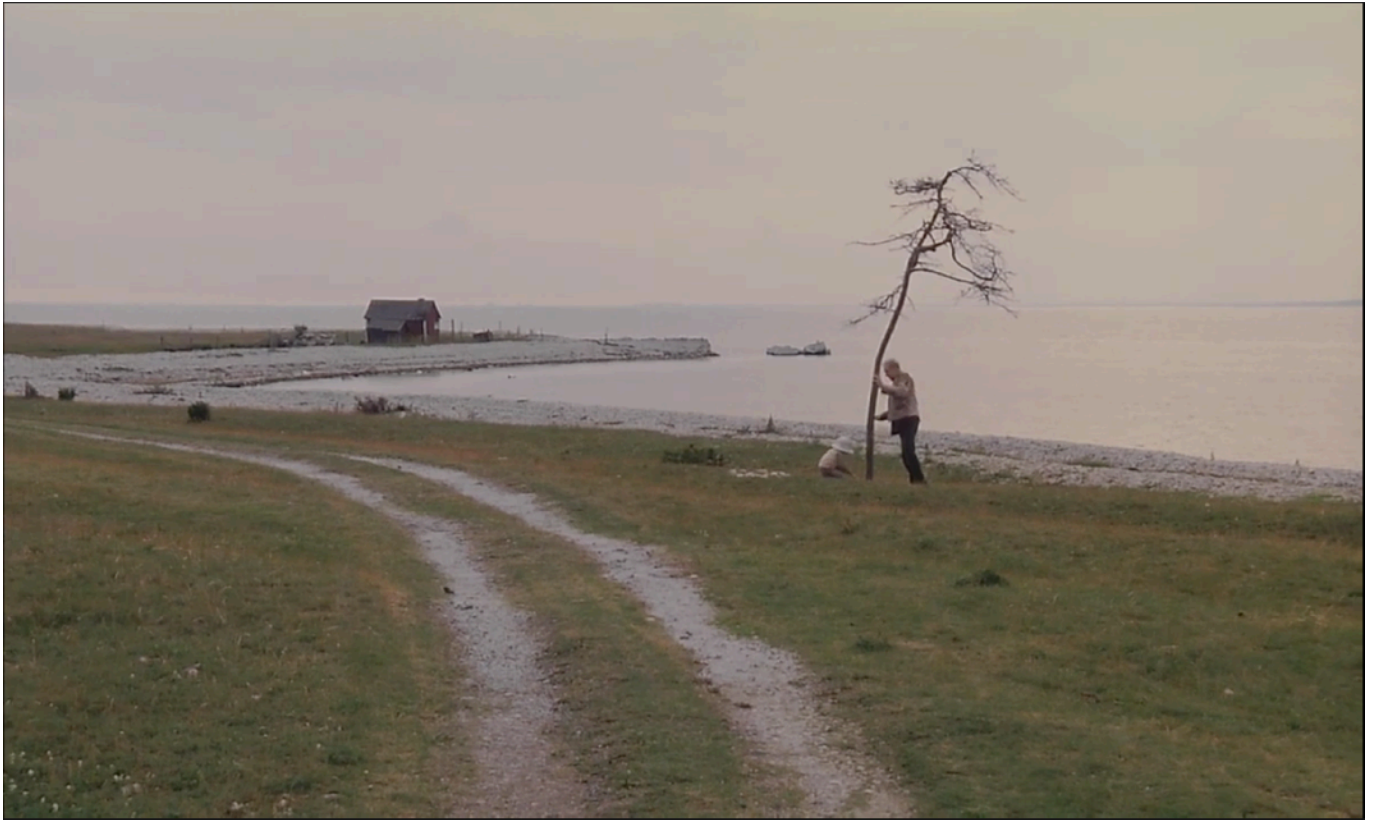
Fig. 20 - Alexander et son fils plantent l'arbre mort

cet instant, l'intérieur comme l'extérieur sont filmés avec des couleurs affadies, tendant vers le niveau de gris. Le décalage brutal entre la scène précédente et les prémisses de l'apocalypse suggère