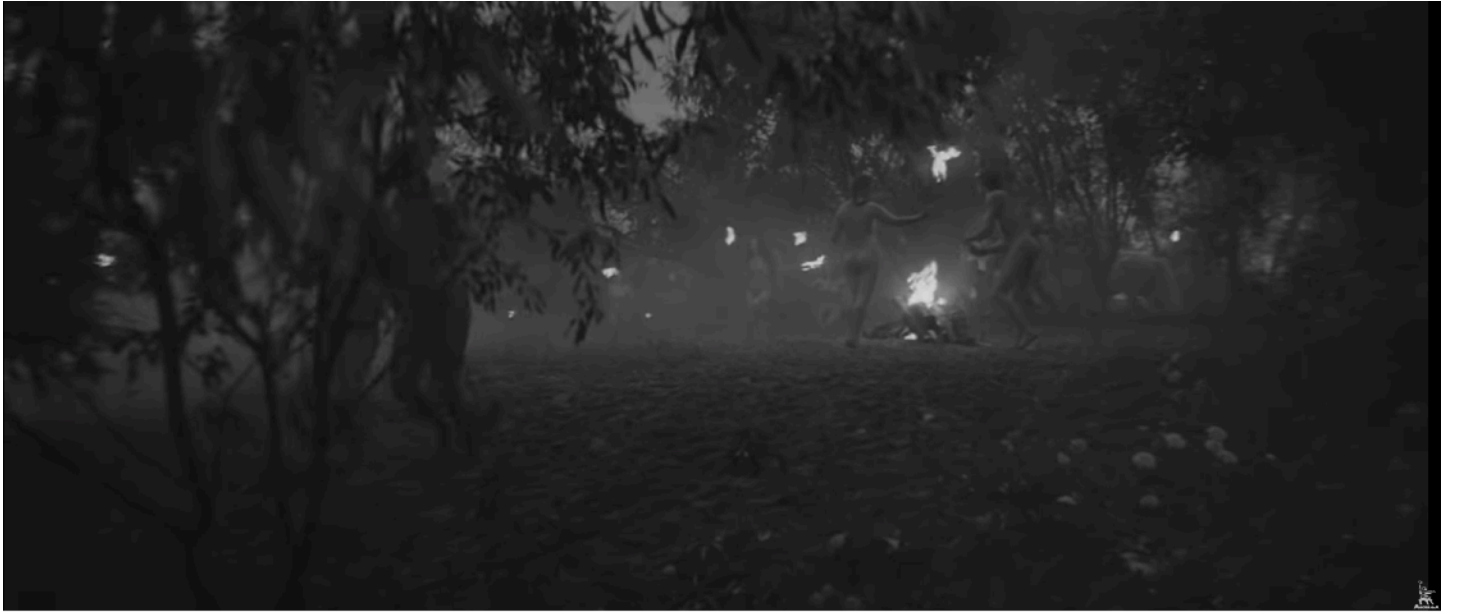
Fig. 6 - La fête païenne