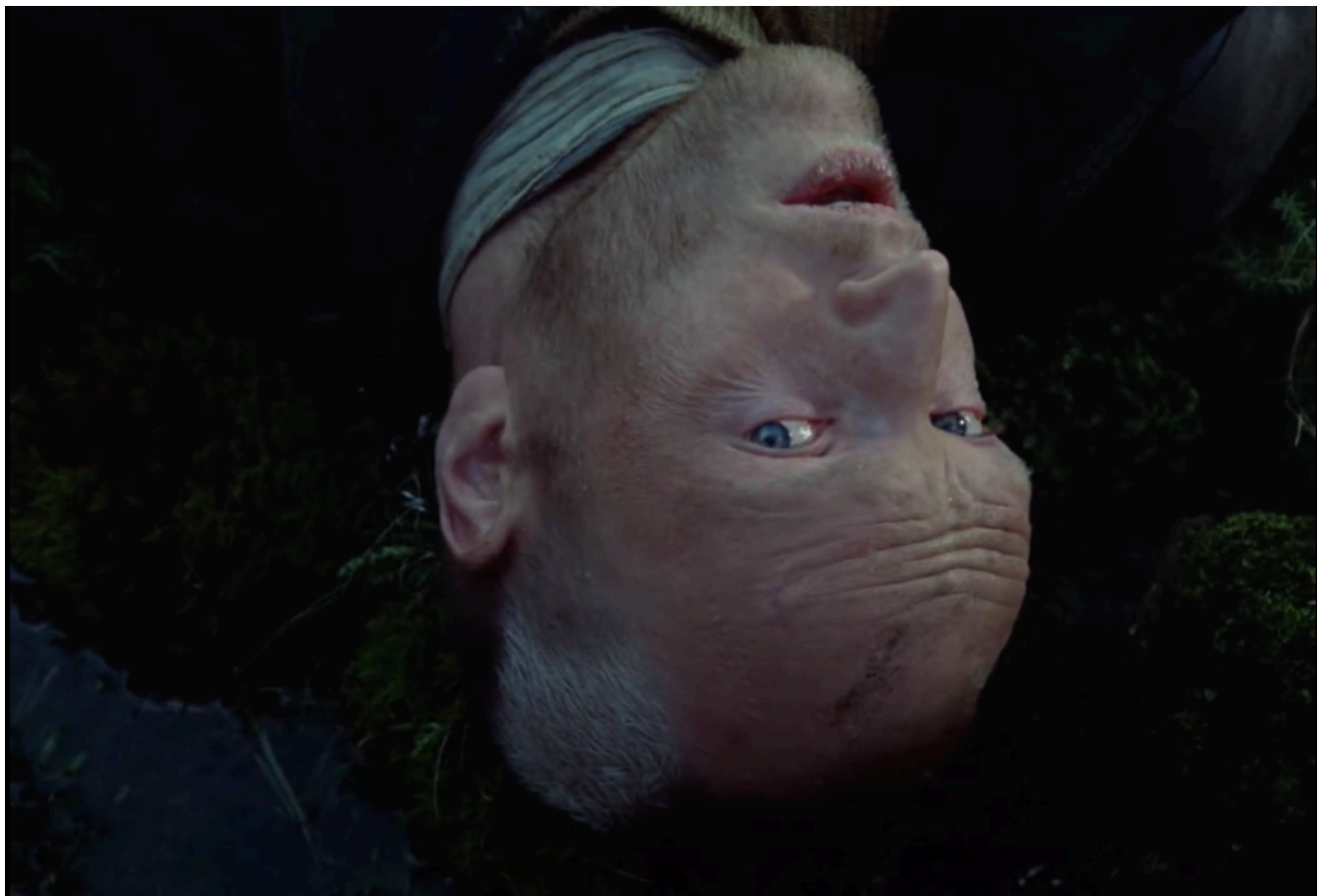
Fig 2. - Le Stalker (Alexandre Kaidanovski)