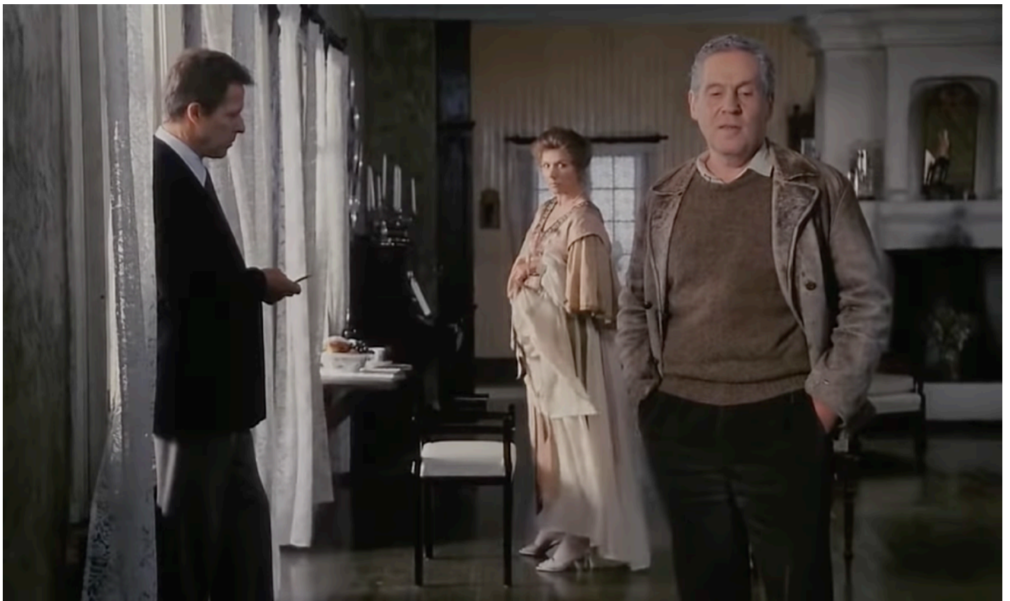
Fig. 10 - Alexander, sa femme et son beau-frère

Ainsi, Alexander dans sa propre demeure ne partage pas exactement le même espace que sa famille, l'interprète et s'y meut différemment. A quelques rares exceptions, notamment avec Petit Homme, son fils, il ne partage aucune proximité physique avec les autres membres du groupes. Son regard ne va jamais vers eux et il est rarement, dans un dialogue, inscrit dans un champ-contrechamp. La répartition dans l'espace identifie donc clairement un groupe homogène, celui des autres membres, et un cas singulier, le père de famille. La figure 10 explicite clairement ces jeux de représentation. La répartition des personnages est théâtrale : trois individus placés sur trois plans, engagés dans une discussion. Les regards ne sont pas partagés : le beau-frère regarde la femme d'Alexander qui le regarde. Mais seul ce dernier a les yeux dirigés vers le vide, il semble plus absorbé par ses pensées que par le moment, pourtant une célébration de son anniversaire. Il ouvre sur un hors-champ dont on suppose qu'il ne présente aucun intérêt. Plus encore, il appartient à une autre strate spatiale que les deux autres personnages : le beaux-frère est dans l'encadrement de la fenêtre, sa femme, en pied, proche du bureau. Lui semble se détacher au premier plan, comme