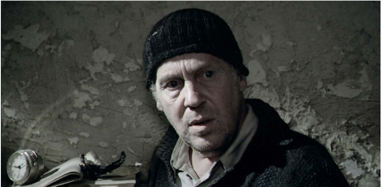
Fig3. - Domenico dans Nostalghia (Erland Josephson)