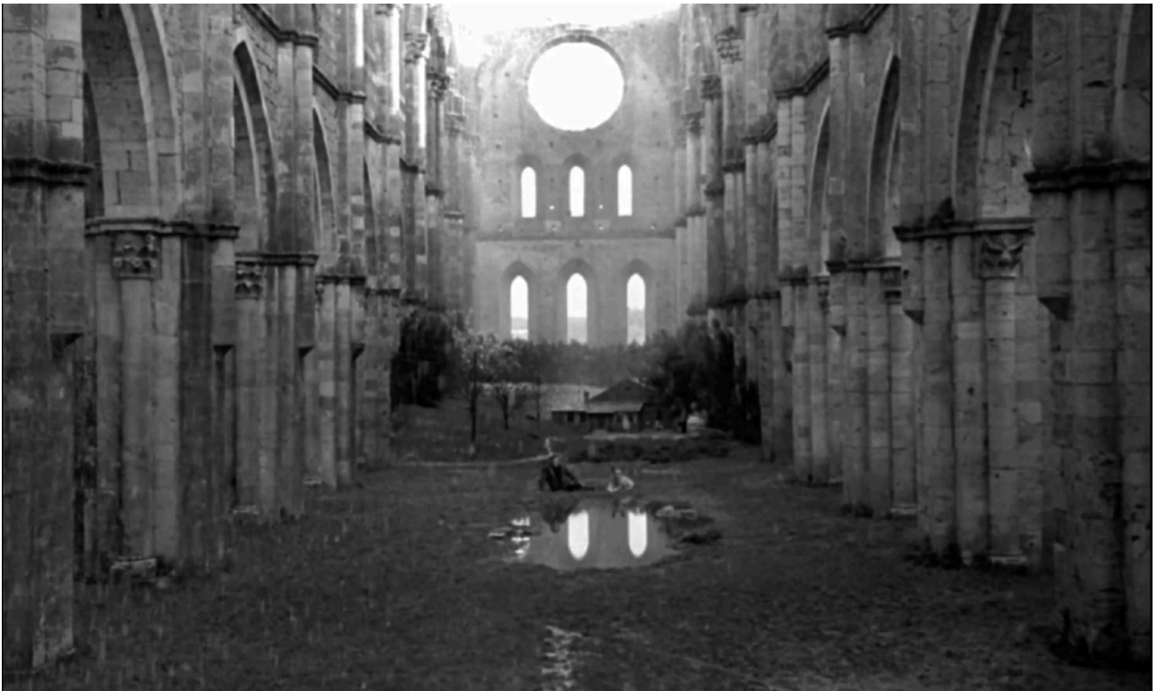
Fig. 9- Scène finale de Nostalghia