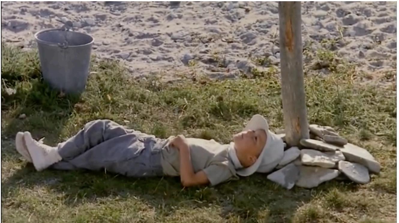
Fig. 14 - Petit-Homme à la fin du Sacrifice

le mode de l'ouverture et de la génération : vers l'espoir, vers l'avenir. Enfin, il se trouve nimbé de miracle : avant son avènement, pendant son déploiement lorsque le film amorce sa conclusion 25 , mais également dans ce qu'il suscite. D'où vient, dès lors, que le langage, élément le plus évident de la communication humaine, est corrélé à l'incroyable, au possible qui ne semblait pas devoir advenir ?