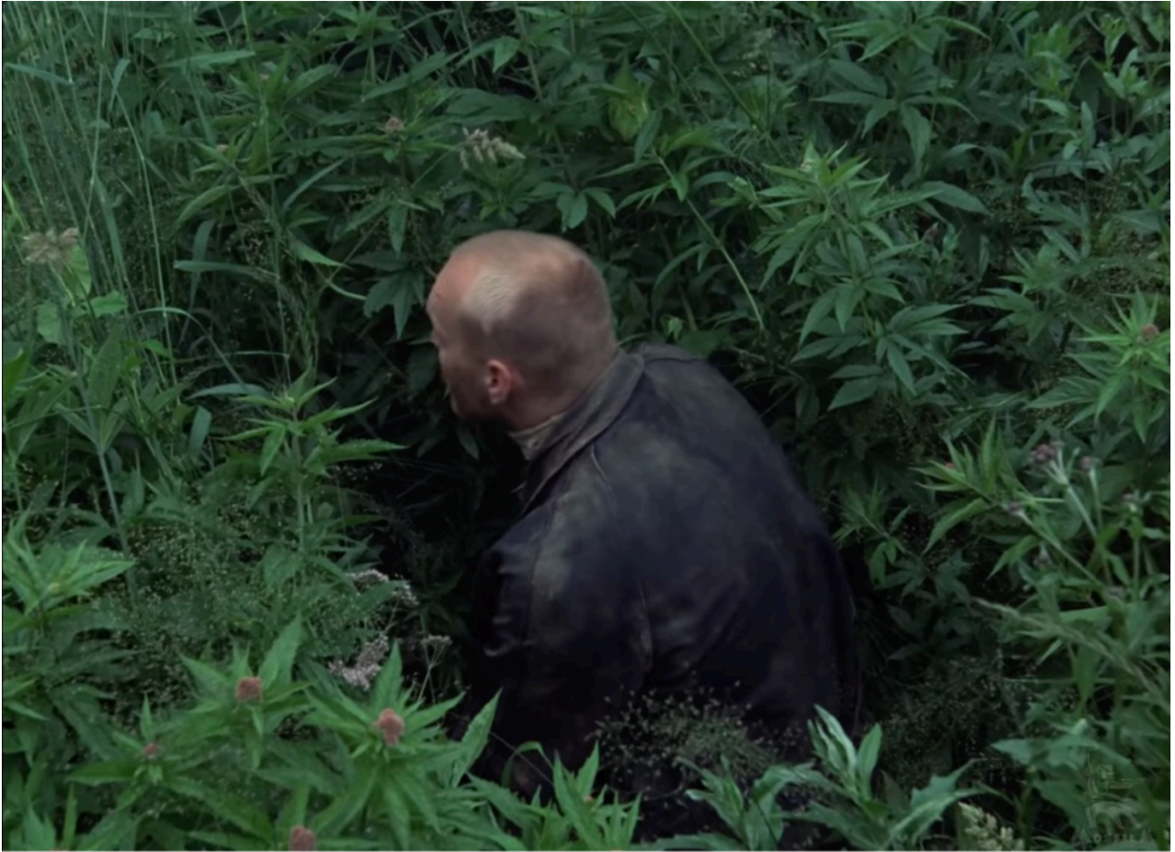
Fig. 19 - Le Stalker peu après son arrivée dans la Zone