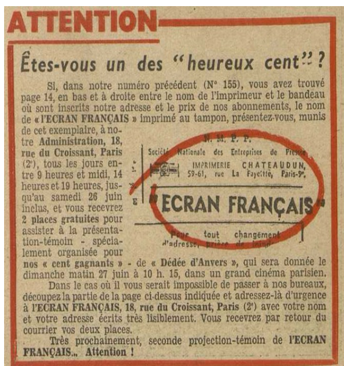
Figure 3: L'Écran français , « Êtes-vous un des heureux cent », n°156, 22 juin 1948, p. 19.