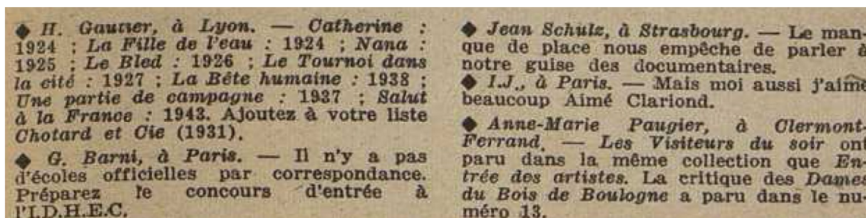
Figure 2: L'Écran français , "Petit courrier", n°119, 07 octobre 1947, p. 15.