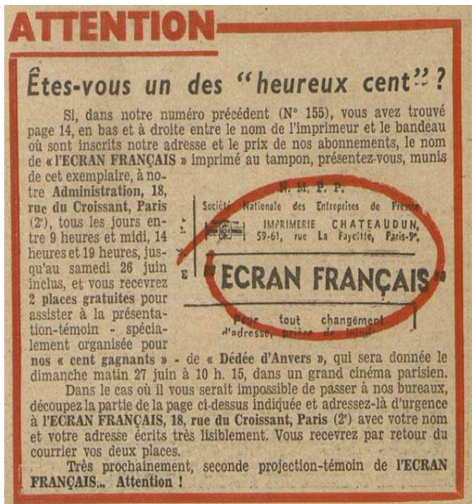
Figure 3: L'Écran français , « Êtes-vous un des heureux cent », n°156, 22 juin 1948, p. 19.