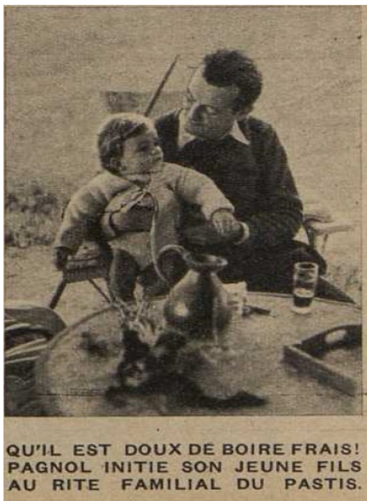
Figure 5: L'Écran français « Marcel Pagnol va faire tourner Tino Rossi... Orson Welles... et quelques autres immortels », n°114, 02 septembre 1947 p. 7.

Cependant, ces comptes rendus de projections-témoins ne sont pas les seules rubriques auxquelles participent des lecteurs professionnels du cinéma. En effet, certains courriéristes de « Prête-moi ta plume » entretiennent des liens avec l'industrie cinématographique. Beaucoup moins nombreux (nous recensons quatre épistoliers professionnels signant de leur véritable identité), le contenu de leur courrier reste toutefois intéressant. Dans la grande majorité des exemples, ces courriéristes interviennent dans « Prête-moi ta plume » pour réagir à des articles ou encore à d'autres missives de lecteurs. La polémique liée au dramaturge et réalisateur Marcel Pagnol illustre parfaitement ce cas de figure. Un article publié dans le numéro 114 du 02 septembre 1947 de L'Écran français , évoquant la carrière de l'auteur marseillais est à l'origine de l'histoire. Une photographie (voir figure 5) présentant Pagnol avec son fils sur les genoux, un verre de pastis devant eux est légendée : « Qu'il est doux de boire frais ! Pagnol initie son jeune fils au rite familial du pastis 218 . »