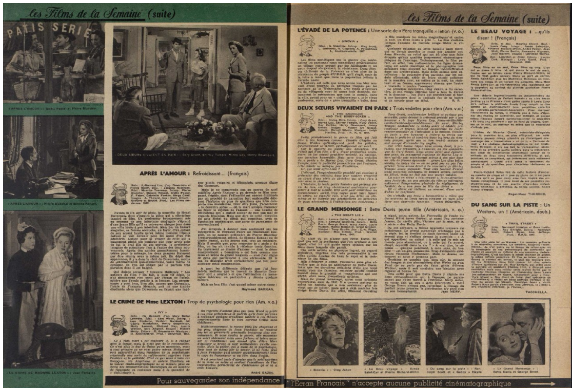
Figure 1: L'Écran français , "Les films de la semaine", n° 135, 27 janvier 1948, p. 13.

dessin de Minotaure (voir figure 1) dont l'expression faciale (souriant quand le film est bon, dépité quand c'est un échec...) représente l'avis de la revue sur les œuvres. Ce Minotaure est un emprunt à la librairie éponyme tenue par Roger Cornaille qui collabore également à la revue. La bête mythologique va devenir l'un des emblèmes de L'Écran français , utilisée également par les rédacteurs dans les actualités pour imager la rubrique. Les dernières pages du périodique se concentrent sur la programmation hebdomadaire des différents cinémas parisiens chaque semaine. Enfin, chaque numéro se conclue sur le courrier des lecteurs de l'Ami Pierrot, intitulé « Prête-moi ta plume ». Ce courrier des lecteurs, inauguré dès la fin 1945 permet ainsi aux lecteurs de communiquer avec la revue, de poser des questions et de faire passer leurs envies ou leurs idées. Comme nous le verrons dans ce mémoire, c'est, entre autres, grâce à ce cahier que le public peut exprimer et partager sa culture cinématographique au sein de L'Écran français . D'autres rubriques comme les référendums, les projections-témoins ou encore la programmation télévisuelle (à partir de 1951) prennent également place de façon plus irrégulière au sein des colonnes de L'Écran français . Grâce à son contenu à la fois attractif et spécialisé, ainsi qu'à ses couvertures valorisant des vedettes de cinéma, le périodique fut ainsi l'un des plus populaires de l'immédiat après-guerre.