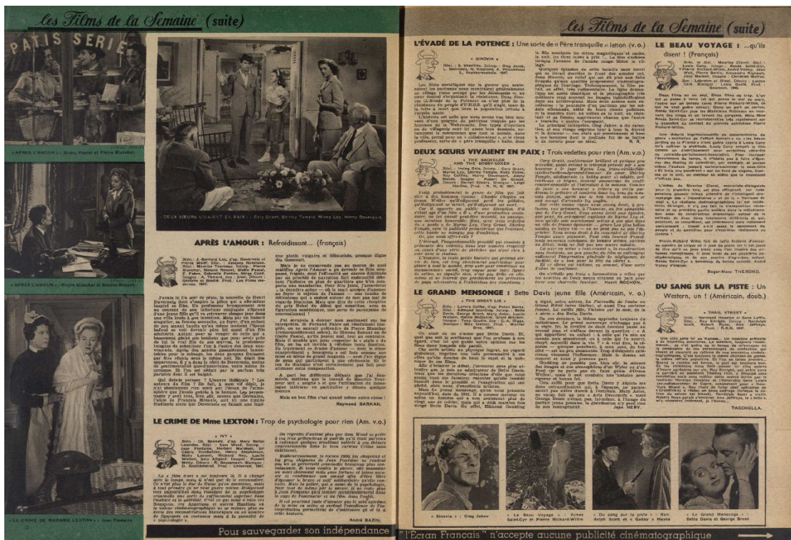
Figure 1: L'Écran français , "Les films de la semaine", n° 135, 27 janvier 1948, p. 13.

dessin de Minotaure (voir figure 1) dont l'expression faciale (souriant quand le film est bon, dépité quand c'est un échec...) représente l'avis de la revue sur les œuvres. Ce Minotaure est un emprunt à la librairie éponyme tenue par Roger Cornaille qui collabore également à la revue. La bête mythologique va devenir l'un des emblèmes de L'Écran français , utilisée également par les rédacteurs dans les actualités pour imager la rubrique. Les dernières pages du périodique se concentrent sur la programmation hebdomadaire des différents cinémas parisiens chaque semaine. Enfin, chaque numéro se conclut sur le courrier des lecteurs de l'Ami Pierrot, intitulé « Prête-moi ta plume ». Ce courrier des lecteurs, inauguré dès la fin 1945 permet ainsi aux lecteurs de communiquer avec la revue, de poser des questions et de faire passer leurs envies ou leurs idées. Comme nous le verrons dans ce mémoire, c'est, entre autres, grâce à ce cahier que le public peut exprimer et partager sa culture cinématographique au sein de L'Écran français . D'autres rubriques comme les référendums, les projections-témoins ou encore la programmation télévisuelle (à partir de 1951) prennent également place de façon plus irrégulière au sein des colonnes de L'Écran français . Grâce à son contenu à la fois attractif et spécialisé, ainsi qu'à ses couvertures valorisant des vedettes de cinéma, le périodique fut ainsi l'un des plus populaires de l'immédiat après-guerre.