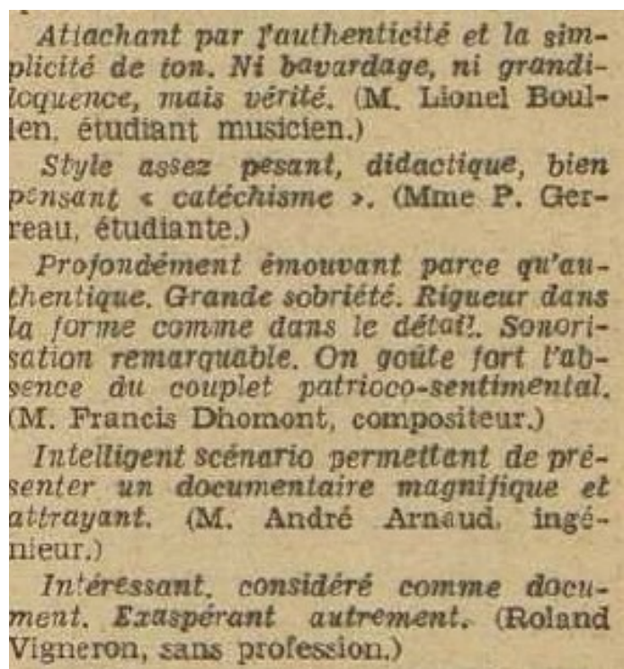
Figure 4: L'Écran français « Troisième projection-témoin de L'Écran français », n°174, 26 octobre 1949 p. 3.

Dédée D'anvers et Il pleut toujours le dimanche , les deux films évalués sur vingt, obtiennent respectivement 16,21 et 16,82. Dans cette continuité, la moyenne des neufs longs-métrages notés sur dix atteint 7,87, prouvant que ces projections ont toujours satisfait les spectateurs. Précisons ainsi que les trois sections possèdent un nombre de commentaires très inégal. En effet, les observations exclusivement négatives envers les films sont logiquement bien moins présentes. Le compte-rendu de l'École Buissonnière réalisé par Jean-Paul Le Chanois montre parfaitement cette répartition inégale des témoignages. En effet, pour ce film obtenant une note moyenne de 8,55 (la plus élevée de toutes les projections-témoins), nous comptabilisons onze commentaires positifs, sept mitigés pour seulement cinq avis négatifs. Précisons également que parmi ce quintet, quatre d'entre eux pourraient en réalité se placer dans la catégorie « pour et contre », tant leur avis nuancé. Le témoignage désapprouvant le plus le film, celui de Fabienne Cavallé, contient malgré tout quelques éléments encourageants « Beaucoup trop de longueurs, quelques bon passages. Ensemble trop conventionnel. Seul B. Blier est excellent. Le reste de l'interprétation est médiocre. Dans l'ensemble, manque de naturel 178 . »