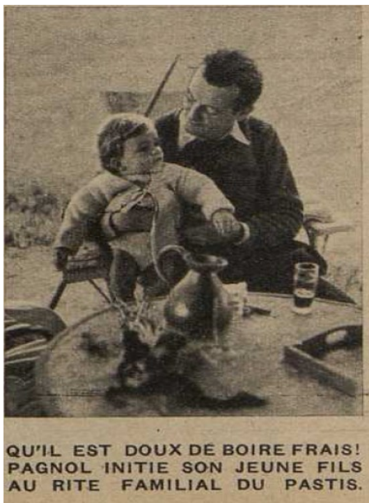
Figure 5: L'Écran français « Marcel Pagnol va faire tourner Tino Rossi... Orson Welles... et quelques autres immortels », n°114, 02 septembre 1947 p. 7.

Cependant, ces comptes rendus de projections-témoins ne sont pas les seules rubriques auxquelles participent des lecteurs professionnels du cinéma. En effet, certains courriéristes de « Prête-moi ta plume » entretiennent des liens avec l'industrie cinématographique. Beaucoup moins nombreux (nous recensons quatre épistoliers professionnels signant de leur véritable identité), le contenu de leur courrier reste toutefois intéressant. Dans la grande majorité des exemples, ces courriéristes interviennent dans « Prête-moi ta plume » pour réagir à des articles ou encore à d'autres missives de lecteurs. La polémique liée au dramaturge et réalisateur Marcel Pagnol illustre parfaitement ce cas de figure. Un article publié dans le numéro 114 du 02 septembre 1947 de L'Écran français , évoquant la carrière de l'auteur marseillais est à l'origine de l'histoire. Une photographie (voir figure 5) présentant Pagnol avec son fils sur les genoux, un verre de pastis devant eux est légendée : « Qu'il est doux de boire frais ! Pagnol initie son jeune fils au rite familial du pastis 218 . »