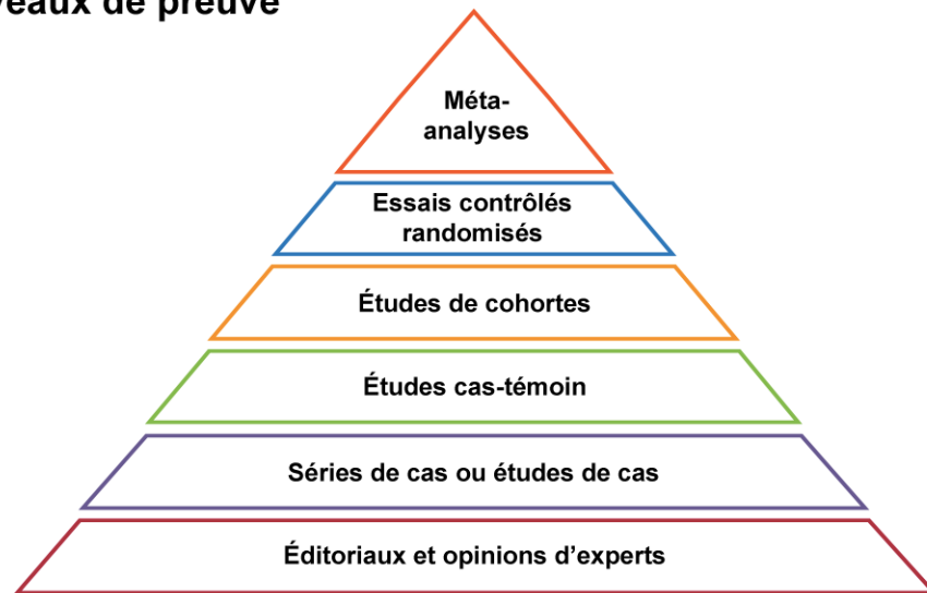
HIÉRARCHIE DES DIFFERENTS NIVEAUX DE PREUVES SCIENTIFIQUES (13)