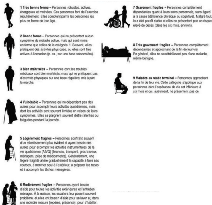
Figure 8 : Score de fragilité clinique