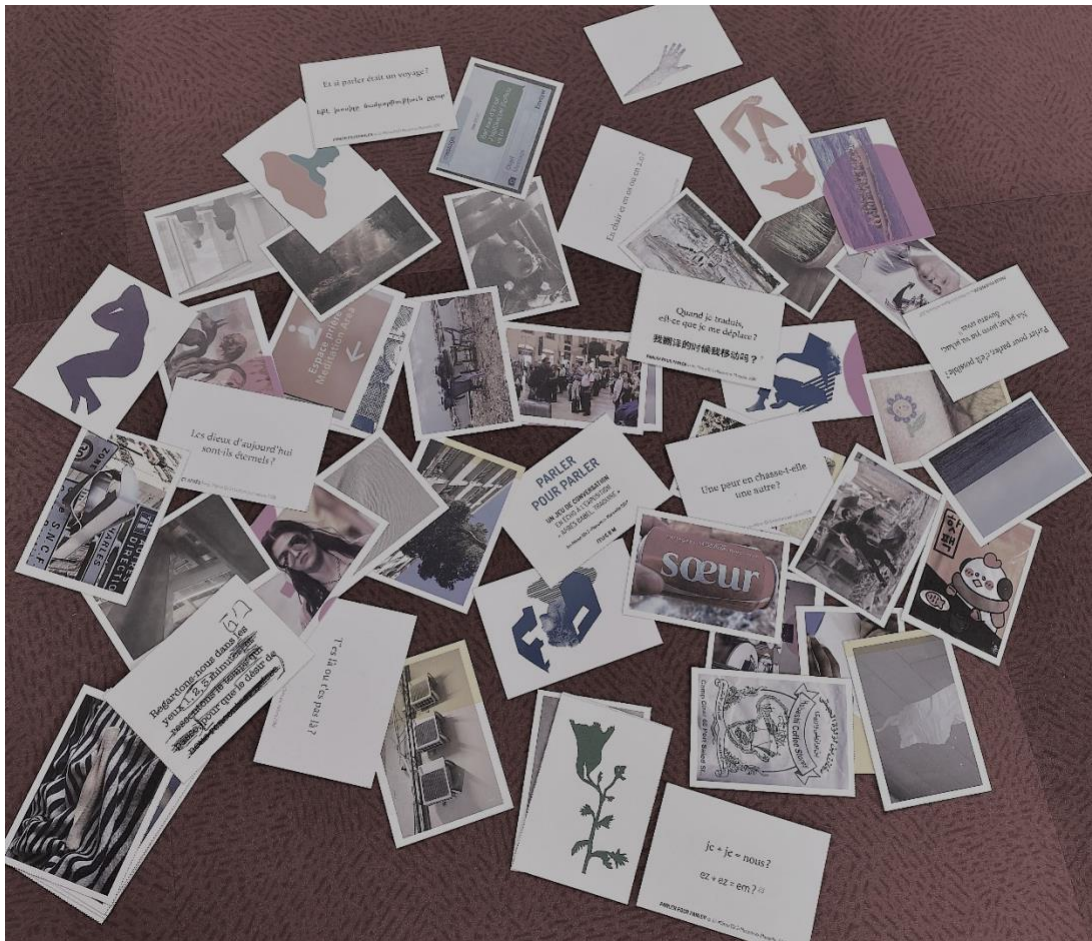
Figure 1 : Les jeux de cartes « Et après ? » et « Parler pour parler » du collectif Ici-Même.

Master Urbanisme et Aménagement Parcours Transformative Urban Studies Année universitaire 2021-2022