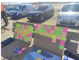
Figure 10 : Atelier post-its sur la plage du casino à Sfax.

Ce huitième terrain a été réalisé dans un milieu culturel différent, en Tunisie, à Sfax. Dans le cadre de nos études en Urbanisme, nous avons proposé un projet d'aménagement et avons pour cela réaliser un atelier de concertation sur notre terrain d'étude, la plage du casino à Sfax. Celle-ci comprend des enjeux multiples liés à une volonté de réappropriation de cet espace par la société civile.