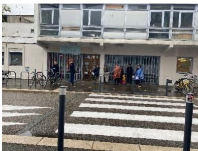
Figure 2 : Les artistes d' Ici-Même jouant le Dactyloband devant la MDH Chorier-Berriat.

Un peu avant 17h30, le 31 mars, je suis arrivée aux alentours de la Maison des habitant-es Chorier-Berriat. J'étais un peu perdue car je ne savais pas où allait se dérouler la performance. Le temps était menaçant. Je les repère de loin, un groupe d'artistes avec des ponchos de pluie, de l'autre côté de la route. Je me suis approchée doucement, ne sachant pas quelle forme l'activité allait prendre exactement. A 17h30, soit au même moment que mon approche, les artistes ont commencé leur lecture théâtralisée : « Dactyloband, récit de la journée du 31