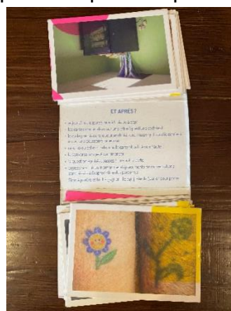
Figure 5 : Règles du jeu « Et après ? » d'Ici-Même.

J'ai dû m'éclipser du jeu avant la fin de celui-ci ayant déjà trop reporté mon retour au Département de l'Isère.