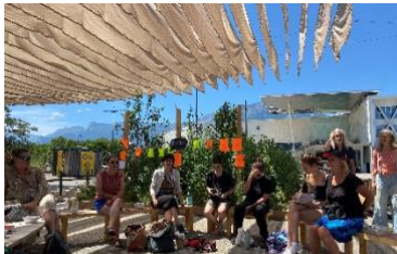
Figure 12 : Atelier de discussion sur le care sur le parvis de Pôle Sud.

Je suis arrivée aux alentours de 12h30 sur le parvis de Pôle Sud, le mercredi 6