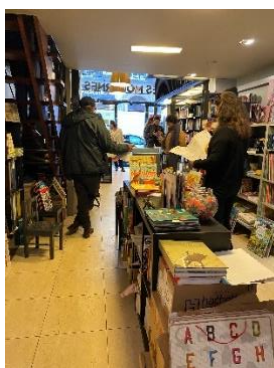
Figure 6 : Les artistes d'Ici-Même jouant le Dactyloband dans la librairie Les Modernes.

Le dactyloband devait avoir lieu à 17h à la librairie Les Modernes , ce mercredi 6 avril. Je pensais alors arriver juste à l'heure, peut-être même que la performance aurait déjà commencé. Arrivée quelques minutes après 17h, je n'ai trouvé personne dans la librairie. J'en ai donc profité pour parcourir les ouvrages féministes au fond de la boutique. Puis aux alentours de 17h30, le collectif arriva. Les artistes se baladèrent rapidement dans le magasin puis prirent place dans la première partie de la boutique, proche de l'entrée. Il y avait d'un coup plus de monde. Des personnes étaient arrivées entre temps. Les mots de la journée ont donc été comptés sur le même exemple que lors du terrain 1. Je suis alors restée à l'arrière du magasin et je les observais depuis là. Une fois la performance terminée, j'ai échangé avec certaines artistes puis je suis restée dans la librairie parcourir d'autres livres. Une fois la librairie quittée, je me suis enregistrée pour garder une trace de ce que j'avais observé.