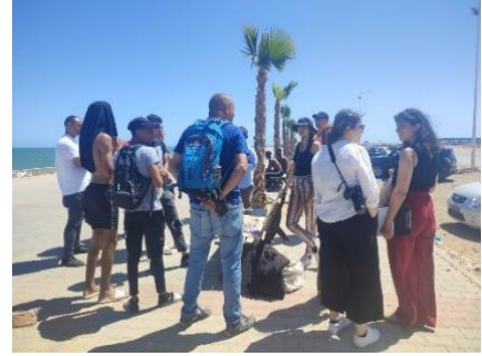
Figure 11 : Groupe autour de l'atelier post-its sur la plage du casino à Sfax.

bancs. Puis sur un autre banc étaient installés des post-its, crayons, le matériel nécessaire pour concerter. Nos installations ont alors intrigué les passant-es. Certain-es se sont arrêté-es. Nous en interpellions d'autres pour tenter de les faire s'arrêter. Les personnes venaient observer les photos, d'autres directement discuté avec nous. Ainsi, des petits groupes se sont formés. Nous nous occupions chacun-e ou à deux d'un groupe de personnes voulant discuter et faire des propositions. J'ai particulièrement aimé ce moment. Nous avons rencontré plein de monde, recueilli de nombreux témoignages et d'envies. Cela a été un moment très riche humainement. De plus, nos professeur-es et camarades de Master sont venu-es nous voir. Cela faisait encore plus de monde autour de stands, encore plus d'émulsion. A la fin de la journée, vers 17 heures, nous avons ramassé notre matériel rempli d'idées et nous sommes reparti-es en taxi. Pendant l'atelier, je n'ai, à aucun moment, pensé ou agi en fonction de mon mémoire. Puis avec le recul, je me suis rendu compte que ce moment, exemple de participation citoyenne classique, pouvait rentrer dans mes terrains de mémoire. J'ai alors utilisé les notes prises pendant l'atelier de projet.