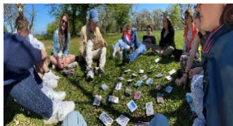
Figure 8 : Groupe jouant au jeu « Parler pour parler » sur le langage à Thonon.

Deux jours après la partie de jeux de cartes du terrain 6, j'ai vu un groupe de copain-ines du lycée, étant rentrée pour le week-end dans ma famille. J'avais gardé le jeu de cartes avec moi et j'étais très intriguée de le tester de nouvelles fois. Cet après-