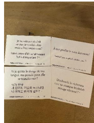
Figure 9 : Certaines questions du jeu « Parler pour parler » sur le langage d'Ici-Même.