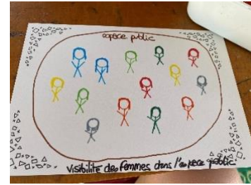
Figure 13 : Mon dessin lors de l'atelier dessin Enfantzine.

Après l'atelier de discussion et les échanges informels que j'ai eus avec certaines personnes après celui-ci, j'ai traversé la route pour rejoindre l'atelier de dessin. Je me suis approchée doucement, en observant autour de moi. J'ai regardé les gens dessiner. L'animatrice s'est approchée de moi et m'a proposé de participer en m'expliquant le principe. Je devais faire un dessin puis choisir de l'afficher, de le donner à quelqu'un-e ou de le mettre dans une boîte. En échange, j'avais le droit de choisir un jeu pour jouer sur place. Je me suis donc installée, j'ai dessiné le fabuleux dessin que vous voyez. Je suis ensuite retournée voir l'animatrice pour lui dire que je voulais afficher mon dessin. J'ai dessiné ce dessin et j'ai voulu l'afficher pour rendre visible cette idée de « femmes dans l'espace public ». L'animatrice m'a alors proposé de choisir un jeu mais au même moment, une marche sensible allait être lancée et Corinne d' Ici-Même venait de m'inviter à participer, j'ai donc rejoint le groupe de la marche sensible.