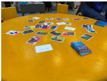
Figure 3 : Le jeu de cartes « Et après ? » d' Ici-Même sur une table dans la bibliothèque de Saint Bruno.

Je suis arrivée vers 10h15, le samedi 2 avril, à la bibliothèque de Saint-Bruno où le collectif Ici-Même proposait une animation à travers des ateliers de dialogue et d'échanges sans objectifs précis. Des artistes d' Ici-Même étaient par deux à côté de deux machines à écrire. Une était disposée juste à l'entrée, l'autre un peu plus loin à l'intérieur. J'avais au départ pour projet de participer aux discussions qui avaient lieu devant les machines à écrire mais j'ai voulu en amont faire le tour de la bibliothèque que je n'avais jamais visitée. En m'enfonçant au fond de la bibliothèque, j'ai rencontré