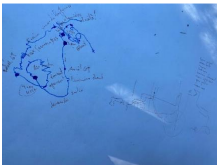
Figure 14 : Mon parcours dessiné de la marche sensible.

Nous étions quatre binômes à côté de l'atelier dessin, aux alentours de 16 heures. Corinne a expliqué le principe de la marche sensible pour ceux et celles, qui comme moi, n'en avaient jamais faite. J'ai mis le casque sur mes oreilles, j'ai fermé les yeux et je me suis laissée guider par mon binôme. Nous avons alors déambulé tout autour de Pôle Sud et Grand Place. Je ne vais pas raconter tout ce que j'ai pu ressentir car cela est dans mes résultats de recherche. Néanmoins, l'expérience m'a beaucoup plu et interpellée. Je me suis rendu compte que mes autres sens que la vue étaient décuplés quand je ne voyais pas. J'ai fait attention à des choses auxquelles d'habitude je ne pense jamais. Par exemple, le toucher du sol avec mes pieds. J'entendais avec