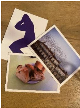
Figure 7 : Cartes du jeu « Parler pour parler » sur le langage d'Ici-Même.

sorti-es de la salle de classe pour aller faire notre activité dans la cour de l'Institut d'Urbanisme et de Géographie Alpine sur une table de pique-nique au soleil. J'ai