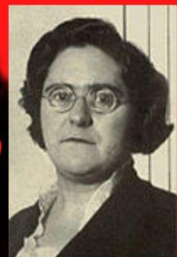
Mis primeros 40 años (1987)

Master 1 LLCER études hispaniques - juin 2022