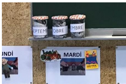
Les pots des mois

En effet, un pot de confiture représente le pot du mois. A l'intérieur il y a les étiquettes du calendrier Ephéméride des jours passés qui sont froissés. Ainsi, au fur et à mesure que le mois passe, le pot se remplit.