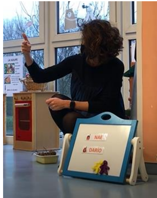
Représentation analogique des quantités « un » et « deux » avec les doigts