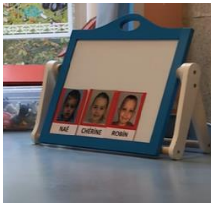
Etiquettes enfants malades

Lors de cette étape du rituel, il y a deux phases. Une première où les élèves choisis doivent aller chercher un bonhomme qui représente un malade et venir le placer sous l'étiquette de l'enfant malade et une deuxième phase où l'enseignante dénombre la quantité.