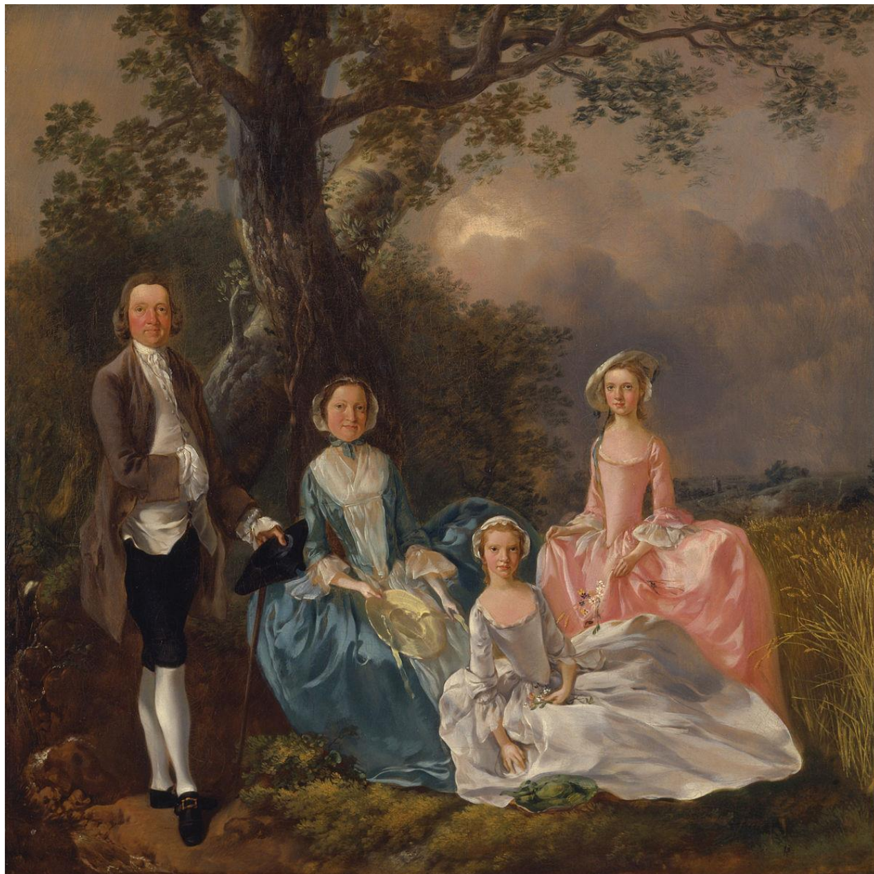
The Gravenor Family , 1754 (tiré du manuel I Bet You Can! 6ème, Paris, Editions Magnard, 2017)