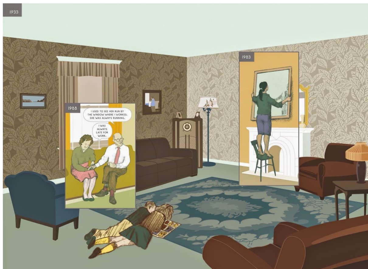
Illustration de l'une des pages de la bande-dessinée Ici (2014), Richard McGuire. Il n'y a pas de numérotation de pages dans l'œuvre : les seuls repères sont les dates inscrites dans le coin des cadres.

de ceux qui l'habitent à travers les siècles. Dans cet espace délimité, les existences se croisent, s'entrechoquent et se font étrangement écho, avant d'être précipitées dans l'oubli » 11 . Mais même une fois oubliées, la maison porte leurs traces. Au fil des pages, nous voyons les paroles, les habitudes, les réalités de personnages se déployer au sein de plusieurs cadres datés et incrustés dans l'image de la maison qui les préserve en son sein.