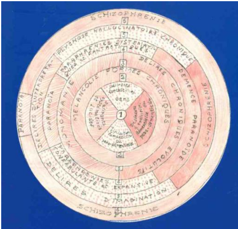
Figure 2. Histoire des classifications des délires chroniques (par Henri EY) 1 .