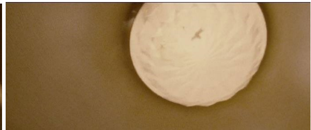
[1h08 et 00min39]

Néons permettant le passage du tunnel souterrain à l'ascenseur, puis d'un ascenseur à l'autre.