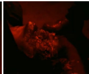
[24min34 et 1h17]