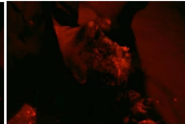
[24min36 et 1h17]