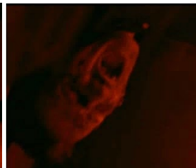
[24min05 et 1h16]