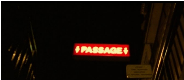
Le panneau « PASSAGE ». [44min01 et 40min34]