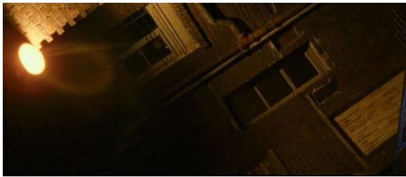
[4min06 et 1h17] Lumière et façade introduisant la scène de la prison.

Tout le long du film, les plans de la ville servent de raccords dans le montage