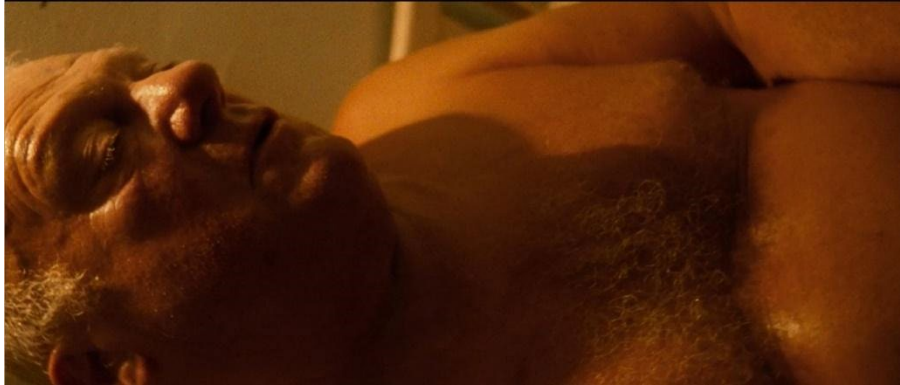
« Le Temps détruit tout » dit le boucher. [5min15 et 1h18]

Scène d'ouverture de la version de 2002 et scène de fermeture de la version de 2020 d' Irréversible . Le boucher chevalin, déjà présent dans d'autres films de Gaspar Noé, est en prison et avoue son crime : il a violé sa fille.