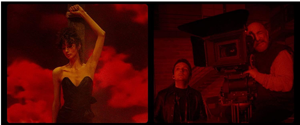
L'actrice souffre sur le bûcher devant le réalisateur qui en redemande. Le montage fait coïncider des actions simultanées.