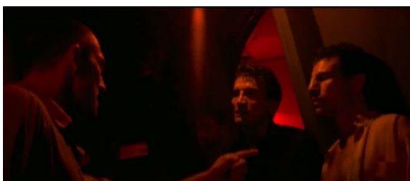
[22min38 et 1h15]