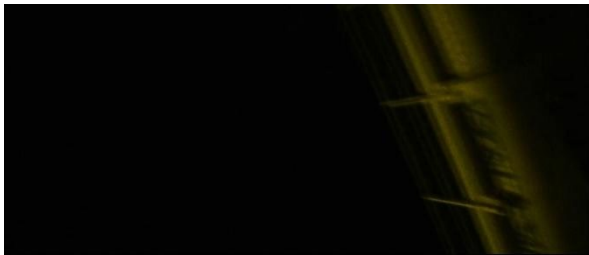
[25min23 et 1h07] Fenêtre servant de passage à la caméra dans un autre lieu.