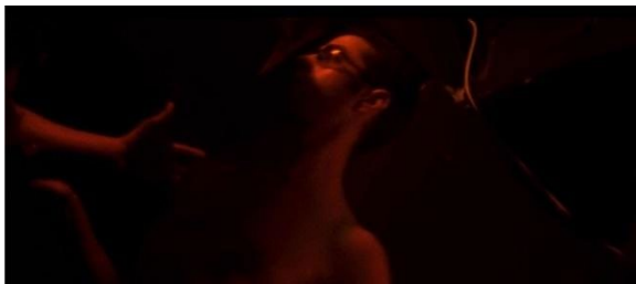
[17min46 et 1h10]