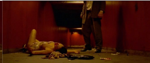
La scène de viol s'étire dans le temps, nous fait voir l'acte en entier. [44min-56min et 40min-52min]