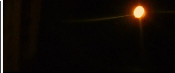
[25min24 et 1h07] Lumière de réverbère utilisée comme repère spatio-temporel.