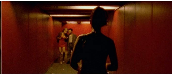
L'arrivée du Ténia et d'une prostituée. [44min21 et 40min53]