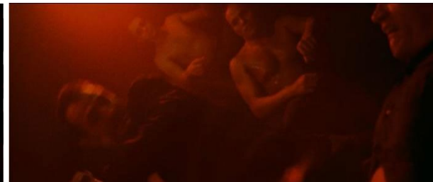
[23min33 et 1h16]