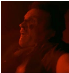
[23min38 et 1h16]