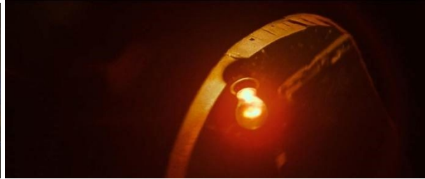
[12min32 et 1h21] Ampoule signalant l'entrée de la caméra dans le Rectum.