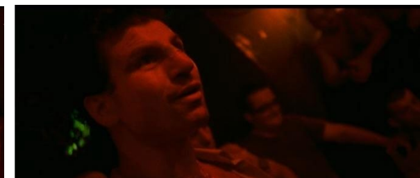
[24min45 et 1h17]