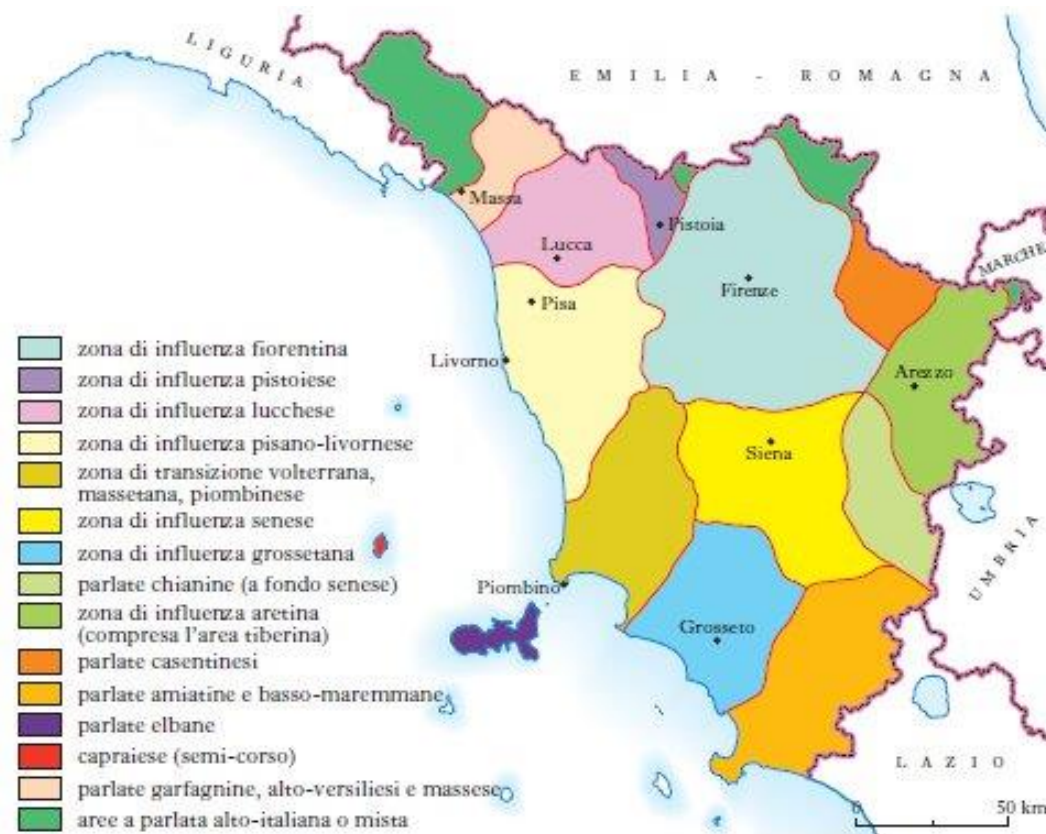
Fig. 1: Zone di influenza (socio)linguistica secondo Giannelli (1988).

All'interno del continuum toscano, Giannelli (2000) individua tre gradi di dialettalità che corrispondono a tipologie di parlanti differenti (in Calamai, 2011). Ad un estremo si colloca il dialetto rustico , fortemente intaccato dai cambiamenti sociali e demografici degli ultimi decenni, tradizionalmente in uso presso generazioni anziane (soprattutto vecchi contadini) in contesti rurali e poco urbanizzati. Viene poi il dialetto corrente impiegato dai giovani e dai parlanti di età media viventi in centri urbani. Infine, nell'ultima fase di dialettalità precedente lo standard, viene l' italiano locale , a sua volta diatopicamente diversificato. Secondo criteri prevalentemente fonetici, si possono delineare cinque varietà locali di italiano: una che ingloba fiorentini, pratesi, senesi e grossetani, una occidentale, una lunigianese, una aretina, e una che accomuna le aree più meridionali della regione.