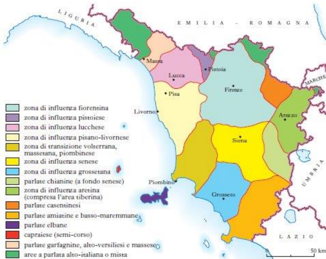
Fig. 1: Zone di influenza (socio)linguistica secondo Giannelli (1988).

All'interno del continuum toscano, Giannelli (2000) individua tre gradi di dialettalità che corrispondono a tipologie di parlanti differenti (in Calamai, 2011). Ad un estremo si colloca il dialetto rustico , fortemente intaccato dai cambiamenti sociali e demografici degli ultimi decenni, tradizionalmente in uso presso generazioni anziane (soprattutto vecchi contadini) in contesti rurali e poco urbanizzati. Viene poi il dialetto corrente impiegato dai giovani e dai parlanti di età media viventi in centri urbani. Infine, nell'ultima fase di dialettalità precedente lo standard, viene l' italiano locale , a sua volta diatopicamente diversificato. Secondo criteri prevalentemente fonetici, si possono delineare cinque varietà locali di italiano: una che ingloba fiorentini, pratesi, senesi e grossetani, una occidentale, una lunigianese, una aretina, e una che accomuna le aree più meridionali della regione.