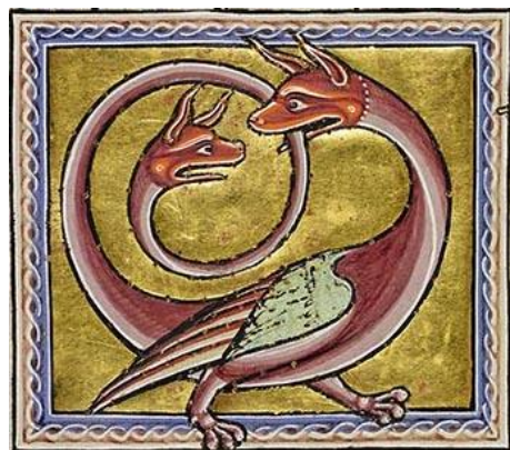
Fig. 11 : Amphibène , fol. 68v