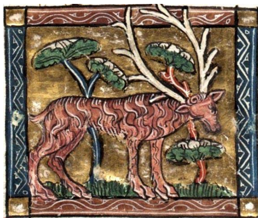
Fig. 1 : Tragélaphe, fol. 70v