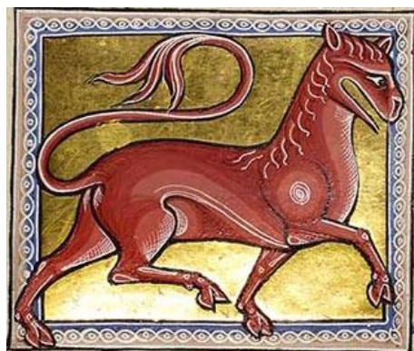
Fig. 15 : Leucrocote , fol. 15v