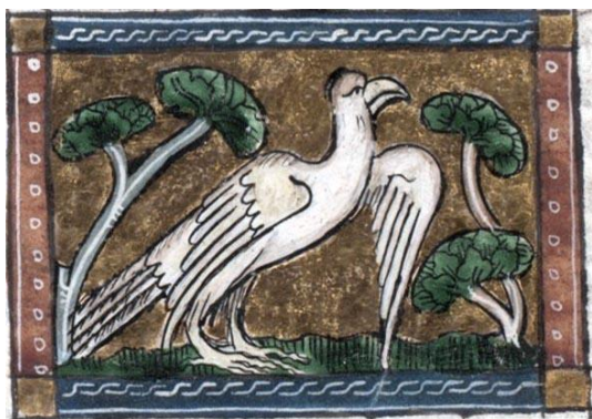
Fig. 9 : Memnonide, fol. 94r