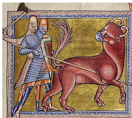
Fig. 14 : Bonasus , fol. 12r