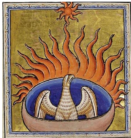
Fig. 12 : Phénix , fol. 56r