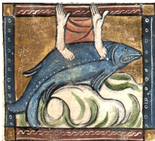
Fig. 10 : Nautilé, fol. 108r