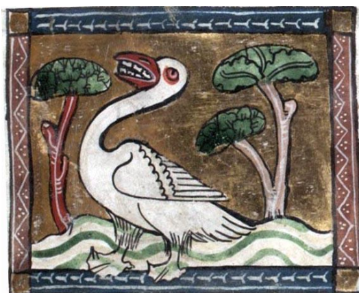
Fig. 3 : Oiseau de Diomède, fol. 83r