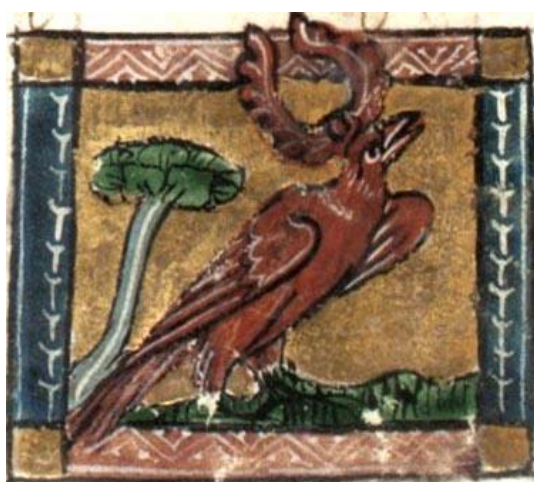
Fig. 7 : Tragopan, fol. 100v