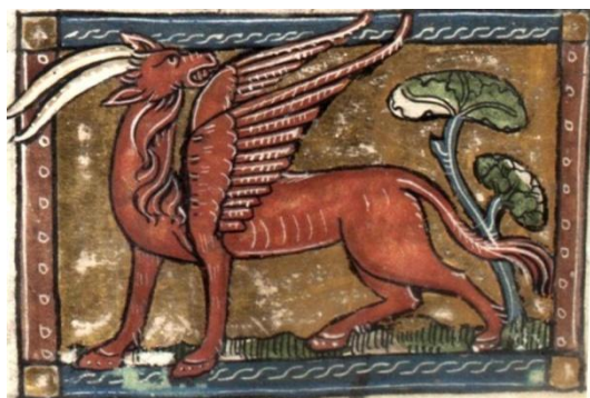
Fig. 2 : Pégase, fol. 68r