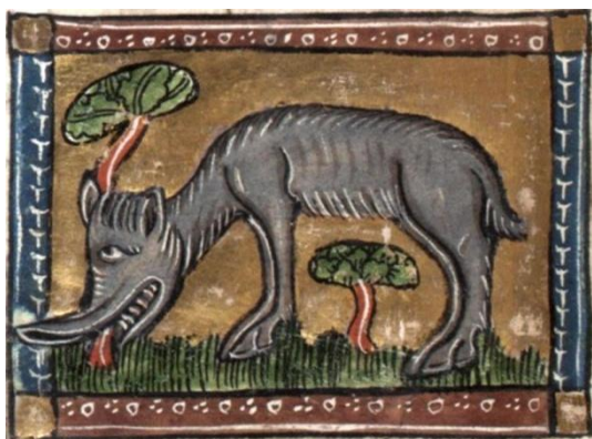
Fig. 4 : Achlis, fol. 46v

La Haye, Koninklijke Bibliotheek KA 16, manuscrit du Der Naturen Bloeme de Jacob van Maerlant, artiste inconnu, ca. 1340-1350, parchemin enluminé, 164 fol. (27,8 × 20,8 cm), © Koninklijke Bibliotheek, La Haye. Source : https://www.kb.nl/en/themes/middle-ages/der-naturen-bloeme-jacob-van-maerlant [consulté le 04/05/2020].