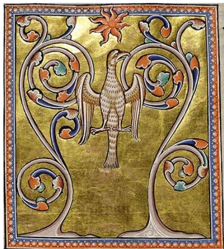
Fig. 16 : Phénix , fol. 55v

Aberdeen, University Library MS 24, manuscrit du Bestiaire d'Aberdeen , artiste inconnu, ca. 1200, parchemin enluminé, 103 fol. (30,2 x 21 cm), © Bibliothèque de l'université d'Aberdeen, Aberdeen. Source : https://www.abdn.ac.uk/bestiary/ [consulté le 04/05/2020].