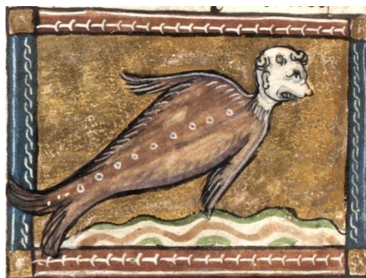
Fig. 8 : Homme marin, fol. 107v