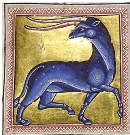
Fig. 13 : Éale , fol. 16v