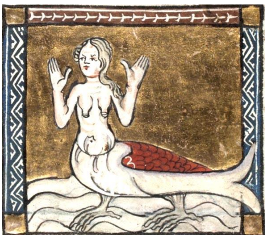
Fig. 6 : Sirène, fol. 109r