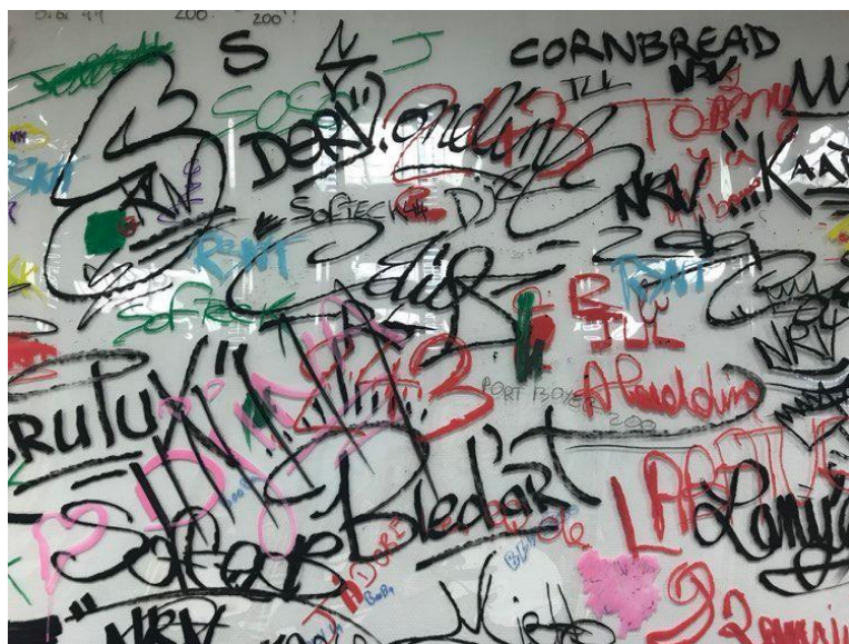
Figure 13 : Photographie d'une œuvre réalisée par des élèves de la classe-relais enquêtée et exposée lors des « temps de rencontre »

Afin d'imposer ce qu'ils appellent « l'esprit-relais », un autre moyen d'action est utilisé : la diffusion d'une iconographie spécifique et qui s'adapte parfaitement aux dispositions sociales des populations visées. Lors des « temps de rencontre », les professionnels du relais diffusent par exemple des portfolios de photos, des témoignages d'élèves, des slogans et autres documents relatant des succès de la classe-relais qui s'adressent aussi bien aux élèves qu'à leurs familles. Ces portfolios de photographies et autres représentations visuelles complètent en illustrant ce qui est dit durant les « temps de rencontre ». Ces documents font une large place aux centres d'intérêt des jeunes et à ce qui fait sens pour eux :