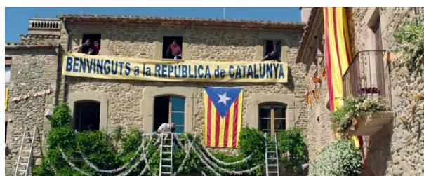
Captura de pantalla de la bandera “Benvinguts a la República de Catalunya” en Soronelles.

Con este acontecimiento, Koldo se indigna, evocando la legitimidad del País Vasco a ser independiente antes de Cataluña: “Que para independencializarnos los vascos estábamos primeros”. También, los amigos sevillanos del protagonista temen que Rafa se haga independentista con ese viaje a Cataluña, lo que les lleva a marcharse a Barcelona para buscarlo. Van a llamar al primo de Joaquín, Anselmo, un guardia civil español, que llega para “salvar” España. Por lo cual la película representa este fenómeno complejo en su conjunto, con los que están a favor o en contra de la independencia. Para continuar, encontramos referencias a la historia y política de Cataluña con la llegada de Koldo y Rafa a la exposición de arte de Pau, que explica que sus obras forman parte de una colección que le encargó la Generalitat, es decir, la organización política de la Comunidad Autónoma de Cataluña, “para decorar las futuras sedes de las embajadas catalanas” después de la independencia.