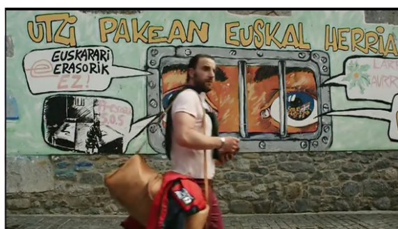
Captura de pantalla de Rafa pisando el suelo del País Vasco por primera vez.

La identidad vasca se ve completada con la primera escena en la ficticia Euskal Herria. Al pisar el suelo vasco por primera vez, Rafa se encuentra en un plano americano que le sitúa delante de unas pintadas sobre una pared, donde está escrito el eslogan “Utzi pakean euskal herria” (deja en paz a Euskal Herria), con dos ojos llorosos detrás de los barrotes de una cárcel. Esa estrategia filmica es significativa y permite plantear la “opresión” del pueblo vasco.