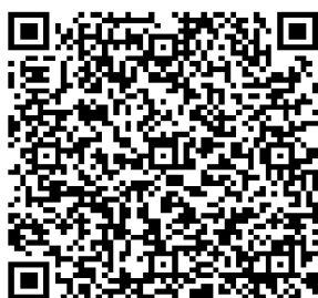
Acto de posesión 2022 (vidéo)

Cet acte était autrefois réservé aux seuls représentants des 5 cabildos reconnus par le Ministère de l'Intérieur. Désormais, comme nous pouvons le voir sur cette vidéo de la mairie de Bogotá, les 14 autorités résidentes de la Casa Indígena participent à cette cérémonie pour assurer leur statut.