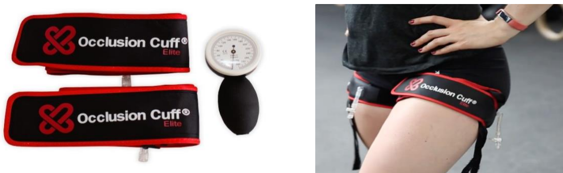
Figure 3 : Sangle de compression/Compression du membre inférieur