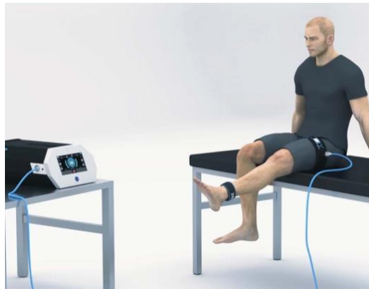
Figure 2 : Sangle avec feedback de pression