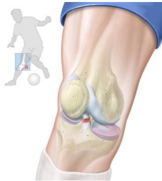
Figure 1 : Rupture du LCA par Flexion/Valgus/Rotation externe du genou

La rupture est le niveau d'atteinte le plus grave qui vient après l'entorse et la rupture partielle, elle peut être isolée mais aussi associée à différentes atteintes. Par exemple, la rupture du LCA peut être associée à celle du ménisque interne et du LCM, c'est la triade antéro-médiale . La rupture la plus fréquente du LCA est issue d'un changement de direction associé à une décélération avec genou fléchi en position de valgus et rotation externe . [18]