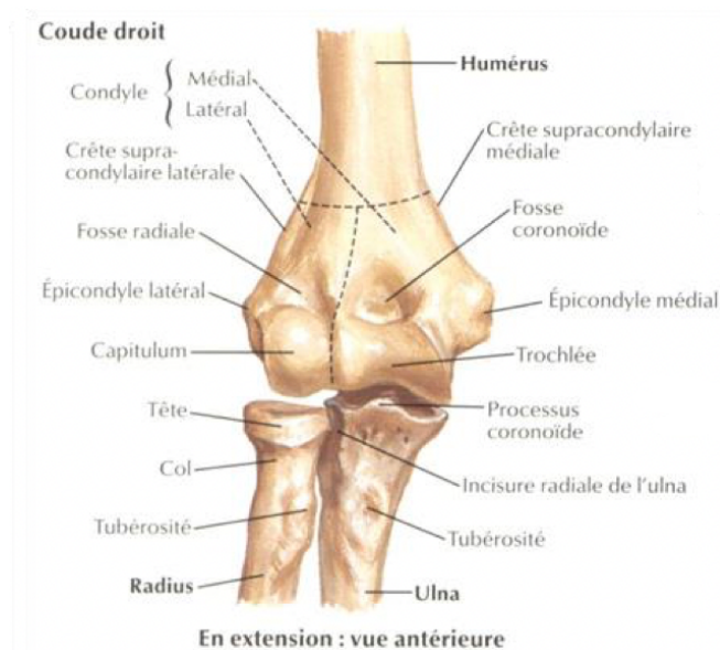
Figure 1 : Schéma de la palette humérale ( https://www.urgences-ge.ch )