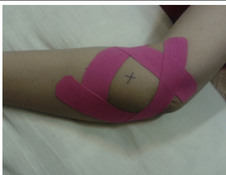
Figure : Technique en diamant (article 4)

De plus la durée d'application du KT ainsi que le nombre de séances varient selon les différents articles (rf tableau 5 de description des études).