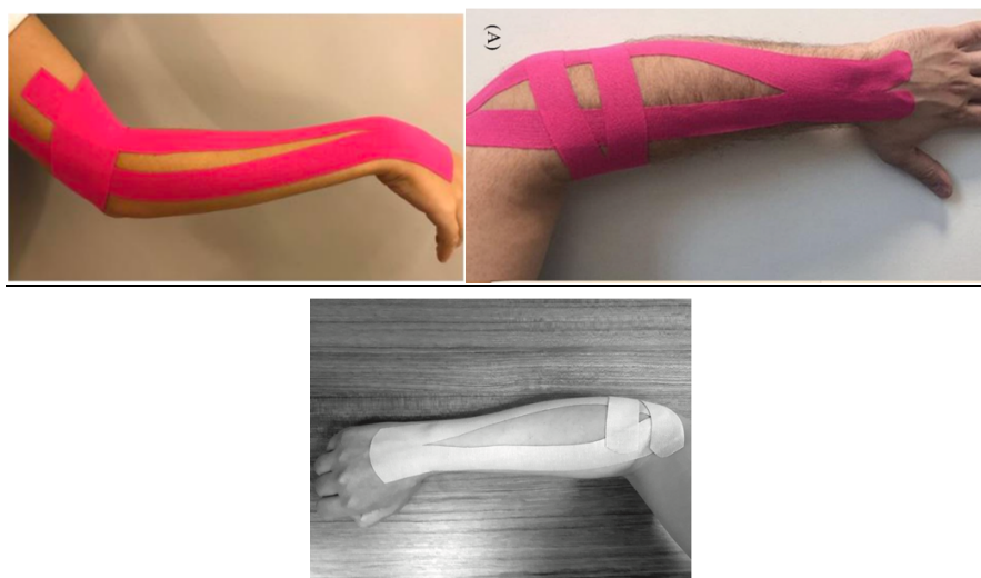
Figure : Application du KT sur les participants étude 1 (image de droite), 3 (image de gauche) et 5 (en bas)