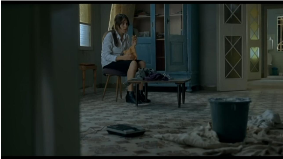
10 Capture écran film Les méduses de S. Geffen et E. Keret, 2007

Par la suite Batia se trouve sur la plage et une enfant venant de la mer va venir à elle. Cette enfant qui ne parle pas est en fait son miroir et va lui faire traverser des épreuves qui vont la réveiller de son coma. Au fur et à mesure des évènements elle va s'attacher à l'enfant et va comprendre, affronter des souvenirs, sa famille et ainsi elle va être active de sa vie. Son appartement qui a été vidé par le déménagement de son compagnon la laissant complètement désœuvrée va se dégrader, il va se remplir d'eau au même titre que sa vie va complètement être chamboulée. Elle ne pourra ainsi plus vivre dans cet appartement qui fait maintenant partie du passé. Cette eau qui la submerge est une montée en puissance des évènements qui lui arrivent. Cette eau qui l'envahit l'aide à retrouver ses sources, lorsqu'elle revient de l'hôpital après un accident, elle retrouve son appartement rempli d'eau, elle décide de ne pas rentrer à l'intérieur, et quand elle arrive dans la rue, elle s'arrête, il se met à pleuvoir, elle est juste en dessous d'une affiche représentant sa mère, les mains formant un toit au-dessus de sa tête, cette eau qui tombe du ciel vient comme un soulagement, elle vient la purifier.