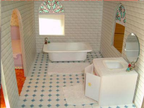
24 Extrait moodboard Yasmina Chavanne