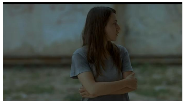
9 Capture écran film Les méduses de S. Geffen et E. Keret, 2007

vivante laissant derrière elle un mur béton, sombre et sale.