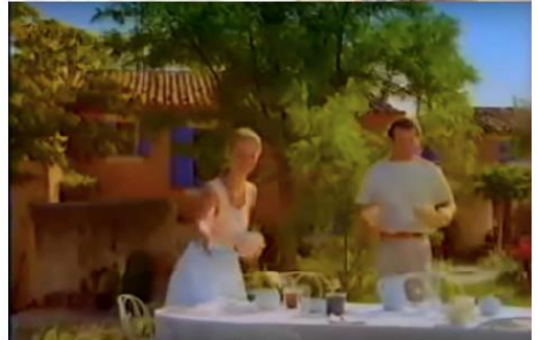
Clichés de la famille kinder.