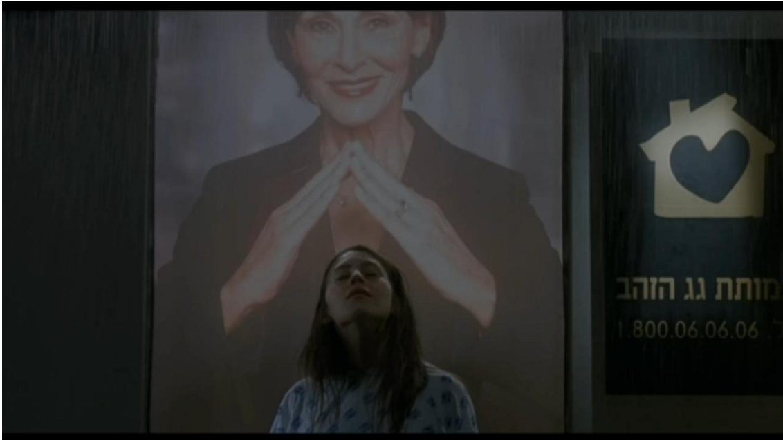
11 Capture écran film Les méduses de S. Geffen et E. Keret, 2007

A la fin elle va se jeter dans la mer pour se confronter à l'enfant qu'elle observait, elle va être sauvée par une autre femme, c'est une renaissance.