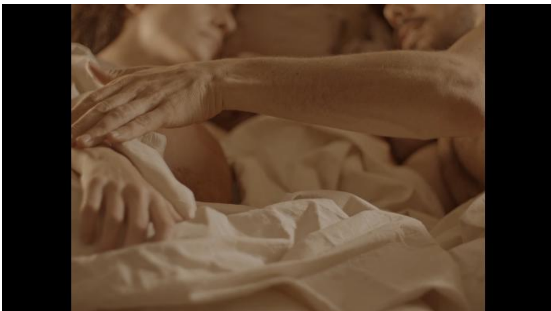
12 Capture écran film De larmes et d'argile de L. Barret, 2021

Ce couple évolue dans un environnement à la fois sec et humide essayant de créer un équilibre, mais en vain. La première partie du film se passe dans un appartement. Au début du film on trouve les personnages allongés dans un lit, ce qui m'intéressait dans la séquence d'introduction c'était d'avoir le ventre humide et lisse, en contraste avec les draps secs, rêches. Dès le départ on peut comprendre que ce ventre n'a aucun espoir puisqu'il est entouré dans ces