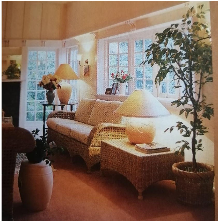
25 Extrait moodboard Yasmina Chavanne