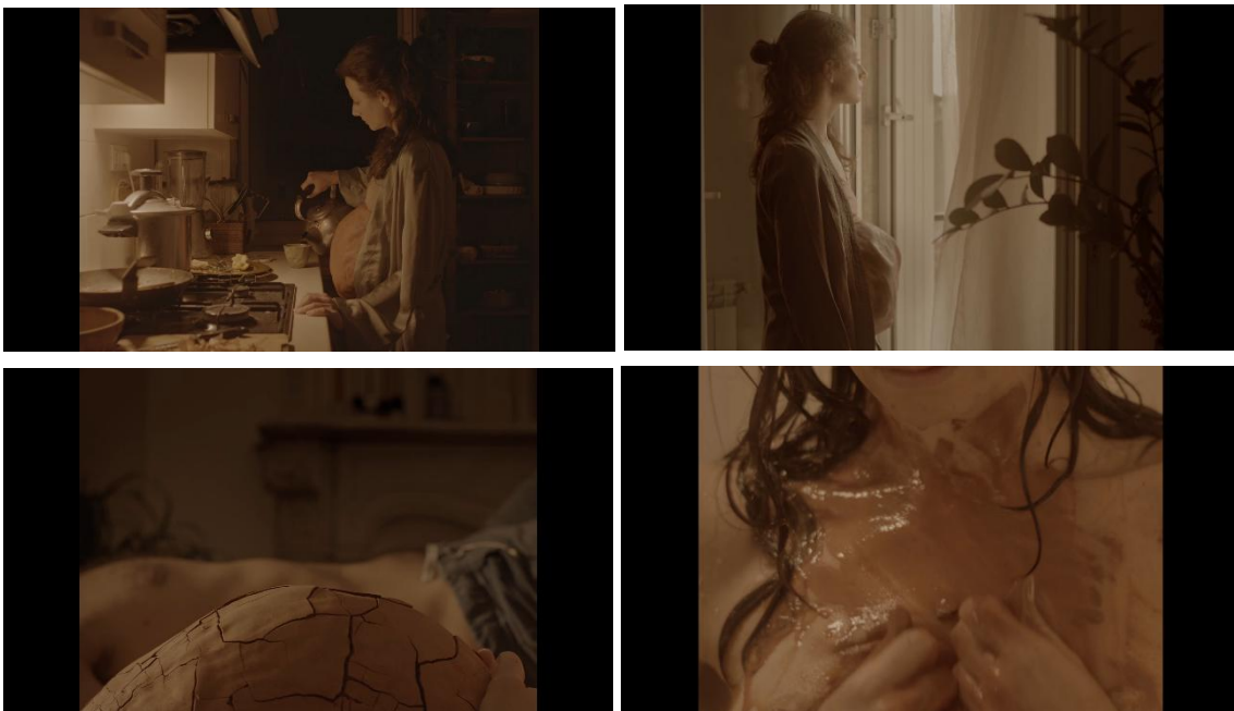
13 Capture écran film De larmes et d'argile de L. Barret, 2021

A la base ce que je désirais faire c'était un va et vient des différentes formes du ventre pour exprimer les hauts et les bas de l'espoir d'avoir cet enfant. Mais au final la première partie est trop courte pour montrer cela, on a dû supprimer des séquences pour ne pas casser le rythme du film et de fait le ventre ne fait qu'évoluer en mal.