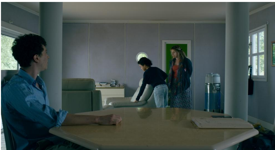
29 Capture écran film Paula de A. Terrail, en post-production