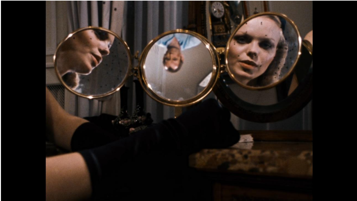
3 Capture écran film Le monde sur le fil de R.W. Fassbinder, 1973