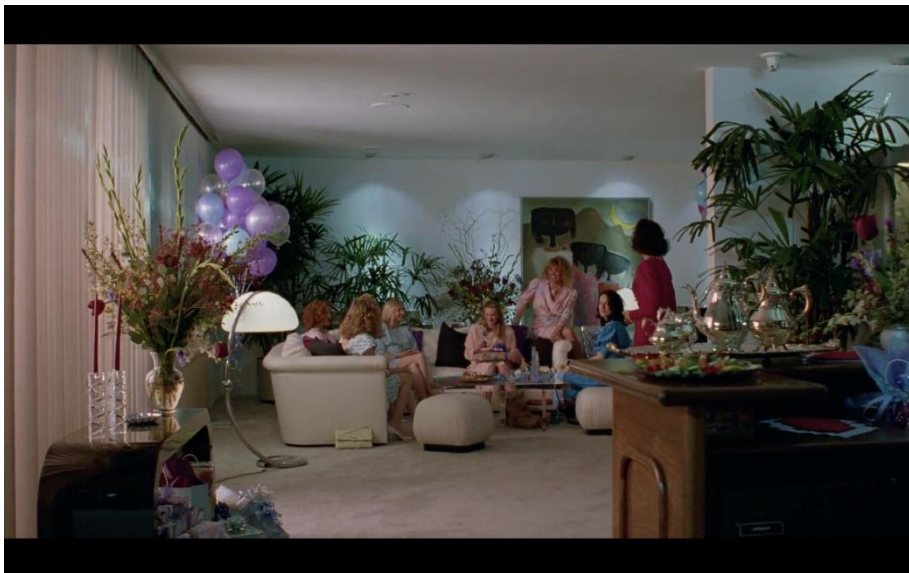
23 Capture écran film Safe de T. Haynes, 1995

Référence au film Safe , Todd Haynes, 1995