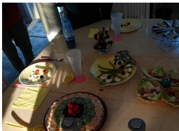
8 Photographie personnelle film Paula de A. Terrail, en Post-production

Toutes ces textures figées comme les matières animales, ou les vaisselles en céramique en forme de légumes renferment des choses dépouillées, brutes. Par exemple, la vaisselle attrayante en forme de légume était présentée comme un festin, c'était une illusion que le père voulait créer pour son enfant, pour lui