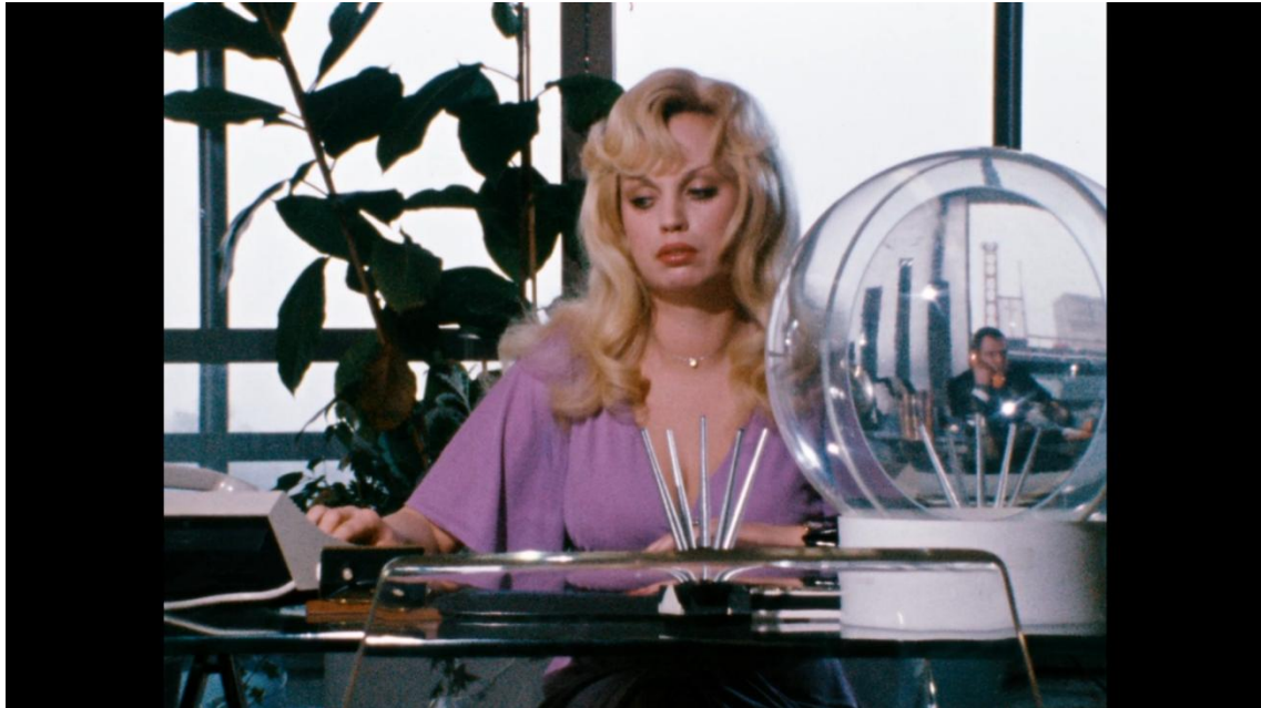
4 Capture écran film Le monde sur le fil de R.W. Fassbinder, 1973

De fait le personnage va se mettre à le fuir pour trouver un environnement plus naturel et vivant mais il va quand même se retrouver bloqué dans cet espace. La forêt prend des allures inquiétantes et hostiles, le bois de son chalet est vieux, sec, sombre, grisâtre, son toit est recouvert de métal, cela n'a rien d'accueillant et Stiller reste vulnérable.