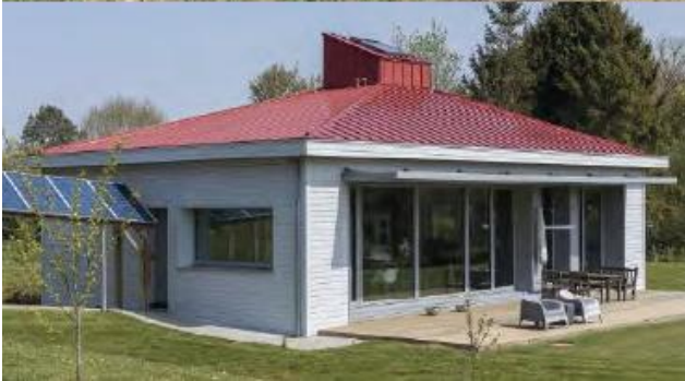
22 Extrait moodboard Angéla Terrail