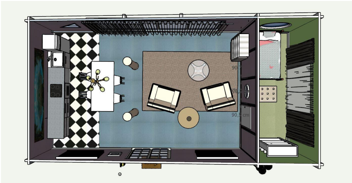
26 Capture écran Sketchup