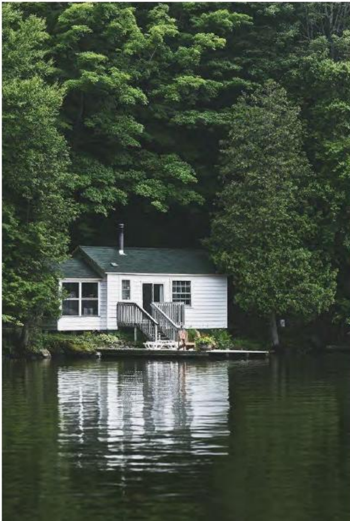
21 Extrait moodboard Angéla Terrail