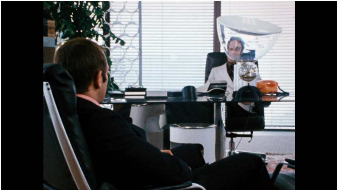
6 Capture écran film Le monde sur le fil de R.W. Fassbinder, 1973

Le visage des personnages est parfois brouillé par de la matière comme pour questionner le spectateur sur leur véritable existence. Dans ce photogramme le patron a le visage complètement caché par un objet en verre déformant, comme si Stiller parlait à un personnage fictif.