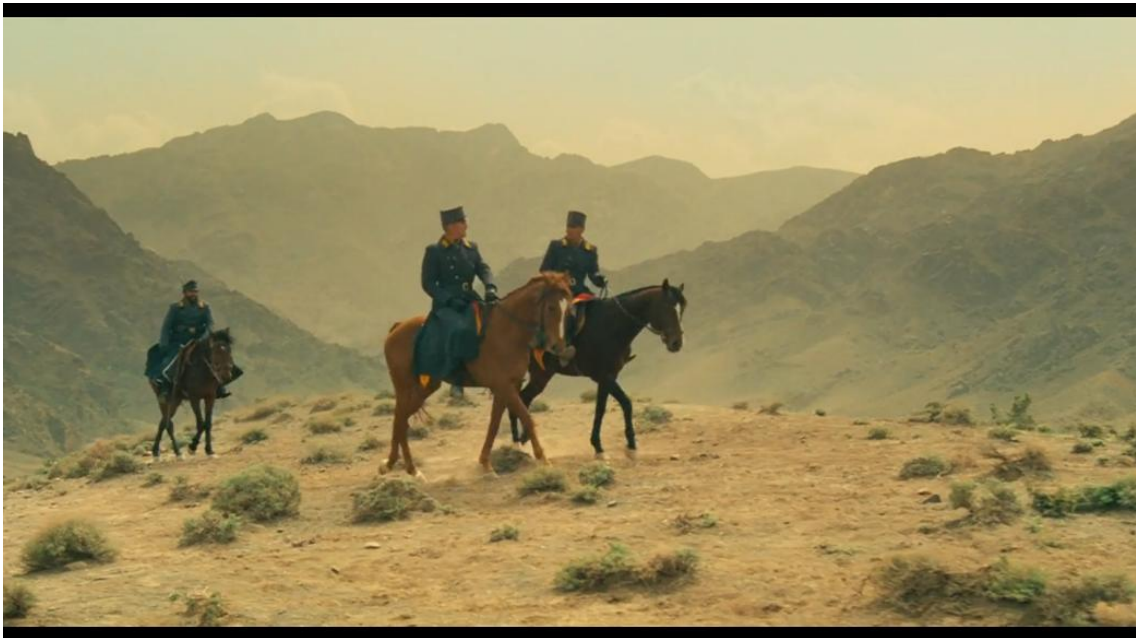
1 Capture écran film Le désert des Tartares de Valerio Zurlini, 1976

Lorsque le Lieutenant Drogo fait la remarque encore toute enthousiaste sur le fait qu'il commence à désespérer et que le Capitaine Ortiz lui annonce qu'il n'a pas tout à fait tort, la texture environnante nous confirme en effet que Drogo entre dans un espace hostile dépourvu de vie, contrairement à l'environnement que l'on vient de quitter. Tout est poussière, quelques herbes sont présentes mais elles sont recouvertes de cette terre jaunâtre, elle-même présente dans l'air, cette texture poussiéreuse paraît étouffante, asphyxiante.