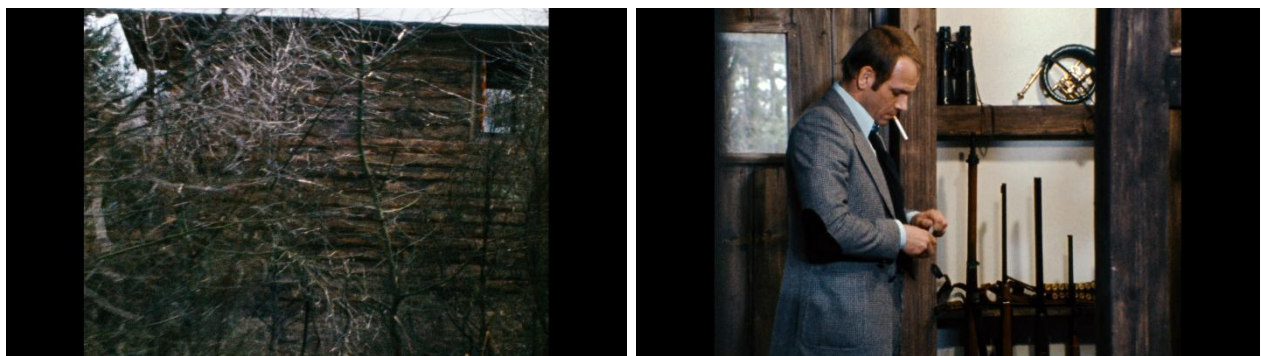
5 Capture écran film Le monde sur le fil de R.W. Fassbinder, 1973

De fait le personnage va se mettre à le fuir pour trouver un environnement plus naturel et vivant mais il va quand même se retrouver bloqué dans cet espace. La forêt prend des allures inquiétantes et hostiles, le bois de son chalet est vieux, sec, sombre, grisâtre, son toit est recouvert de métal, cela n'a rien d'accueillant et Stiller reste vulnérable.