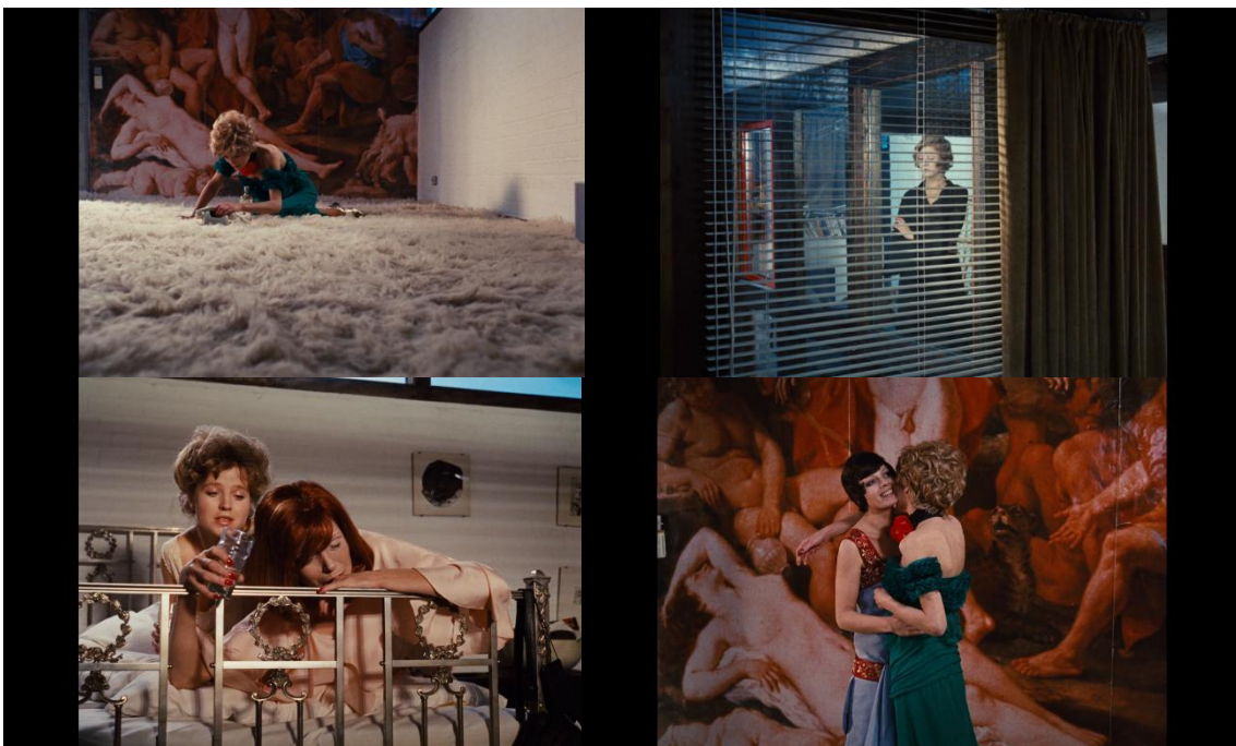
7 Capture écran film Les larmes amères de Pétra von Kant de R.W. Fassbinder, 1972

Dans ce décor il y a plusieurs effets de textures dans une même pièce, c'est ce qui rend compte de la complexité du caractère et des émotions du personnage principal.