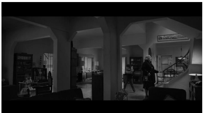
14 Capture écran film Roma , A. Cuarón, 2018