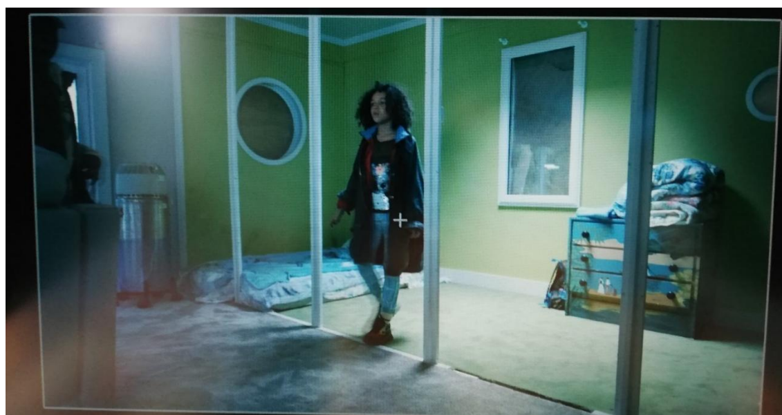
30 Photographie personnelle film Paula de A. Terrail, en post-production