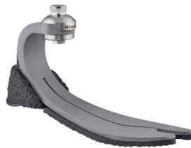
Figure 2 : Pied BALANCE FOOT S®

Ce pied est destiné à un usage intérieur et pour une utilisation à proximité immédiate de bâtiments, « le patient doit au minimum se déplacer dans des bâtiments autres que la maison » [26].