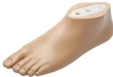
Figure 1 : Pied SACH®

Il s'agit d'un pied fabriqué d'un seul tenant. C'est un pied destiné à des patients marchant peu ou qui est proposé en première intention pour évaluer/réapprendre la marche. Il est léger, solide, fiable et n'a aucune restitution d'énergie. Il est prévu pour un patient amputé trans-tibial avec un faible niveau d'activité, utilisant de manière importantes les aides techniques (cannes, fauteuils roulants) et se déplaçant essentiellement à l'intérieur du domicile. C'est une lame de bois recouverte de mousse (de la couleur de la peau).