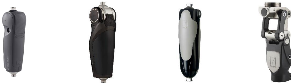
Figure 10 : Genoux RHEO KNEE®, POWER KNEE®, MAUCH® KNEE, TOTAL KNEE® 2000

participants puissent tester les deux pieds à microprocesseurs. Les patients étaient tous de niveau k-level-3.