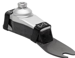
Figure 3 : Pied FLEX-FOOT BALANCE®

Ce pied est plus spécialement destiné à un usage sur des distances plus grandes en intérieur et en extérieur[26]. Pour bénéficier de ce type de pied, « le patient doit au minimum se déplacer en dehors de la maison et d'autres bâtiments ».