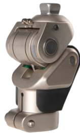
Annexe 8 : Total Knee® 2000 (Össur), genou polycentrique hydraulique