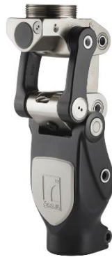
Annexe 9 : OP5 Knee (Össur), genou polycentrique pneumatique