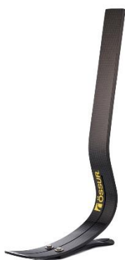
Figure 6 : Pied CHEETAH® XPLORE

L'étude de Morgan et al, réalisée en 2018 avait pour objectif d'évaluer les effets du pied Cheetah® Xplore, (un pied intermédiaire entre un pied à restitution d'énergie de classe III et une lame de course) comparativement au pied Vari-Flex®, (un pied à restitution d'énergie de classe III), sur des paramètres comme l'endurance, l'effort perçu, les performances lors de la marche, la notion de fatigue, la confiance en l'équilibre, les éventuelles restrictions d'activité et la satisfaction lors de l'utilisation de ces prothèses. Cet essai clinique randomisé a été réalisé auprès d'une population d'amputés trans-tibiaux. Les participants de l'étude ont porté successivement une prothèse à restitution d'énergie de classes III et un pied croisé. L'ordre d'utilisation des deux prothèses a été attribué aléatoirement. Chaque prothèse a été utilisée pendant un mois. Les deux prothèses utilisées lors de l'étude, étaient le pied prothétique Cheetah® Xplore et le pied prothétique Vari-Flex® produits par Össur®.