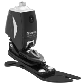
Figure 9 : Pied PROPRIO FOOT®