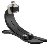
Figure 4 : Pied PRO-FLEX XC®

Pour bénéficier de ce type de pied, le patient doit justifier d'un projet de vie incluant d'autres activités nécessitant de se déplacer dans d'autres lieux que ceux des classes précédentes[26].