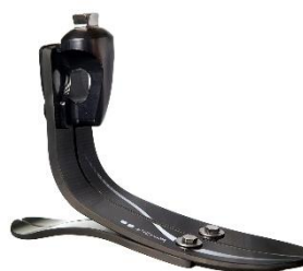
Figure 7 : Pied VARI-FLEX®