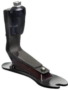
Figure 8 : Pied TALUX® FOOT