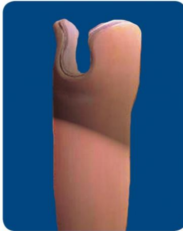
Annexe 6 : Locking Knee (Össur), genou à verrou monoaxial