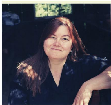
© Dorothy Allison for Guernica (2018)

Laboratoire d'Études et de Recherche sur le Monde Anglophone (LERMA – UR 853) Aix-Marseille Université