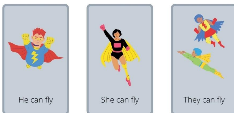
Figure 2- Variante des cartes du jeu Go fish

Afin de peaufiner l'articulation « pronom personnel + can », il aurait été possible de faire évoluer le jeu Go fish vers le jeu des sept familles. Ainsi, les élèves auraient eu les