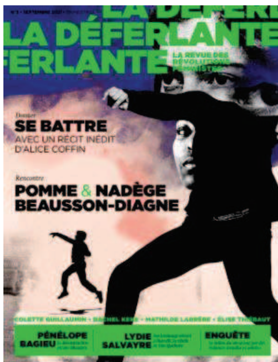
N°3: Se battre