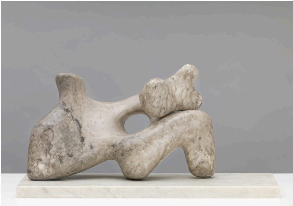
Mother and Child , Barbara Hepworth, Tate Museum, Londres, 1934