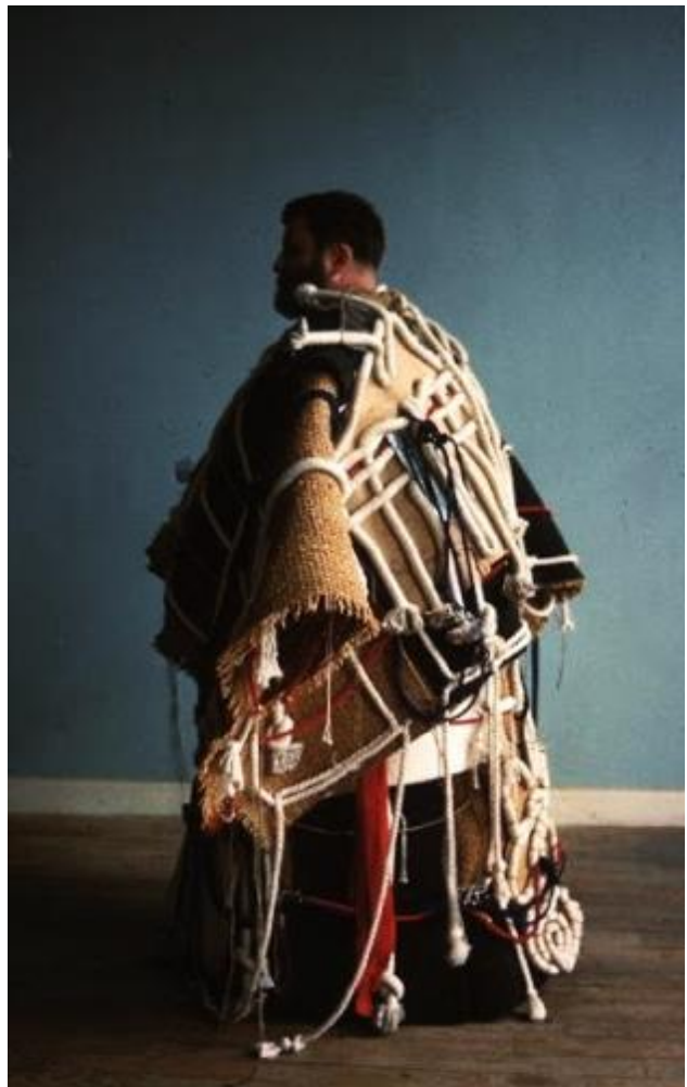
Images 19: Présentation de l'œuvre de portée par l'artiste Etienne Martin

Ces différentes images offrent une appréciation de l'œuvre Demeure 5 portée par l'artiste. L'œuvre épouse parfaitement l'anatomie humaine et couvre entièrement son corps. Nous sommes là face à une communion entre l'artiste et son œuvre, entre l'idée et l'énergie. L'artiste vit lui-même son œuvre et l'anime. Il porte le poids concret de sa mémoire, son trajet personnel et son souffle.