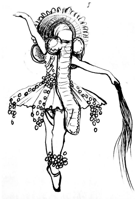
Œuvre 10: Croquis costume hybride sur mannequin 1

Date de réalisation : Juin 2020 Réalisation de l'œuvre : Franck Kemkeng Noah.