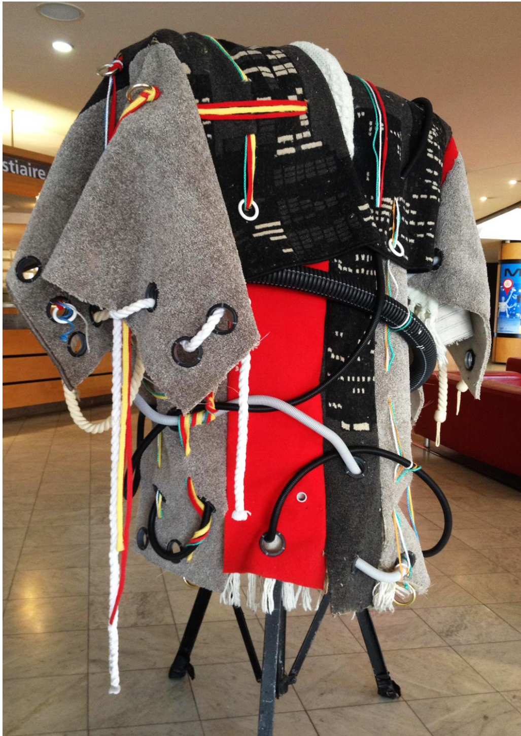
Œuvre 6: Titre - Manteau (souffle du trajet) vue de dos