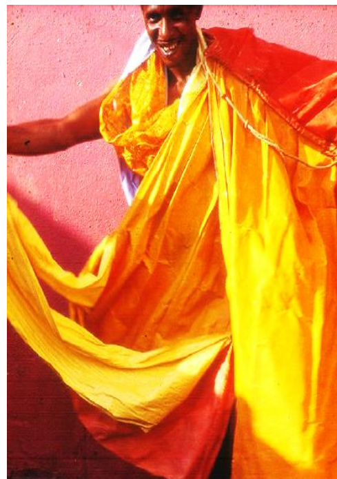
Image 9: Spectacle résident de Mangueira dans un Oiticica Parangolé.

Source: Sun Aa et Helio Oiticica. Agitation et spectacle comme stratégie de résistance.