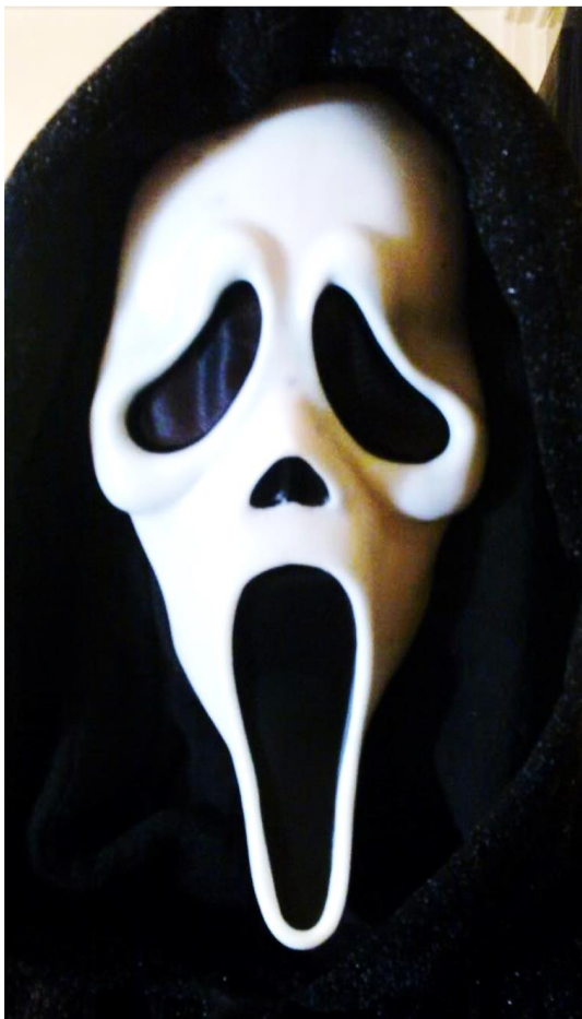
Image 3 : Scream mask (Chine – USA).

Le caractère hybride de ces masques repose principalement sur leurs aspects anthropomorphes et zoomorphes. De même, le côté hybride de ces masques réside également sur l'association en une pièce, des propriétés de masques issus de différentes régions du continent Africain et du monde. L'on a par exemple un masque éléphant hybride, constitué d'une cagoule quelconque made in china , destinée au marché Américain où il a préalablement servi pendant les festivités d'Halloween. Ce masque est donc investi des caractéristiques propres à la Chine, aux États Unis d'Amérique et au Cameroun. Ces caractéristiques entraînent, englobent, renferment les éléments culturels de chaque pays. Ainsi, les cultures camerounaises, chinoises et américaines sont associées en une seule et même œuvre. Ce mélange, cette fusion entre les cultures diverses, qui rend visible les processus d'interculturalisme, constitue un aspect très important dans mes réalisations également. Hervé Youmbi, traduit cela dans ses œuvres en utilisant les masques issus de ces différents coins du monde, qu'il croise et uniformise pour obtenir un masque hybride.