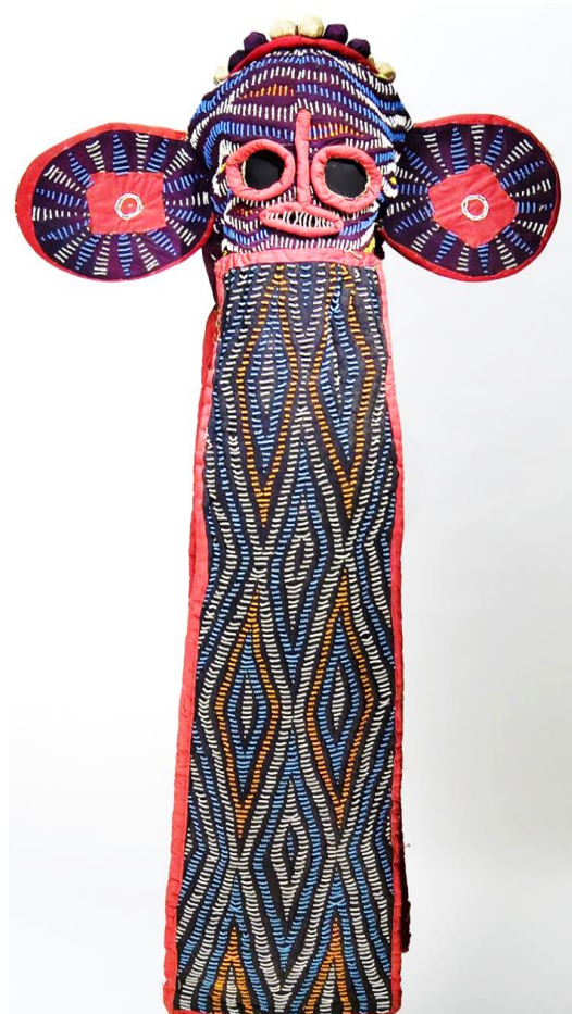
Image 2 : Masque éléphant Bamiléké (Cameroun).