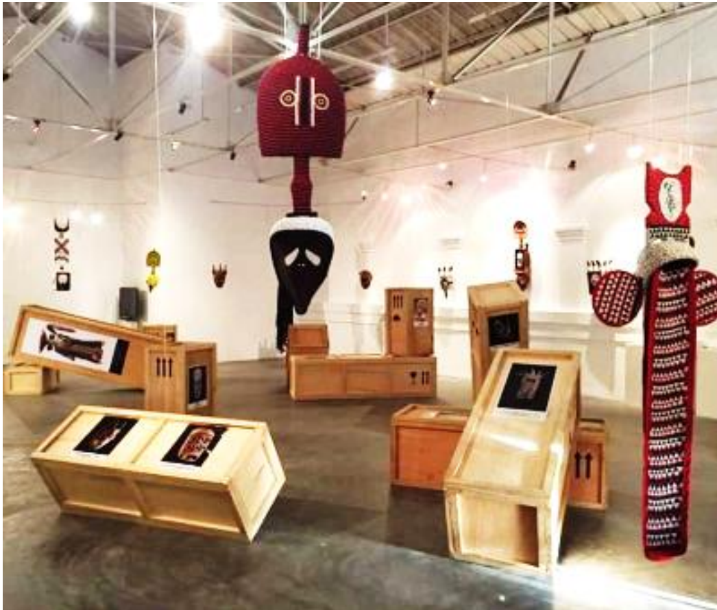
Image 1 : présentant une vue de l'exposition visage de masque d'Hervé Youmbi

Source : Image extraite du catalogue de l'exposition Visage de Masque