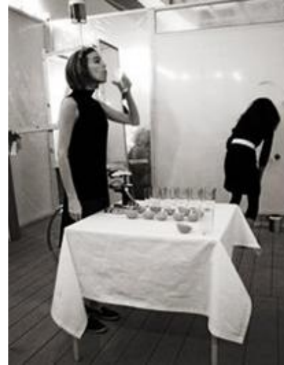
Image 23: Une vue de l'œuvre 18 Happening in six parts (détail)

Source : https://artplastoc.blogspot.com/2018/01/790-allan-kaprow-18-happenings-in-6.html