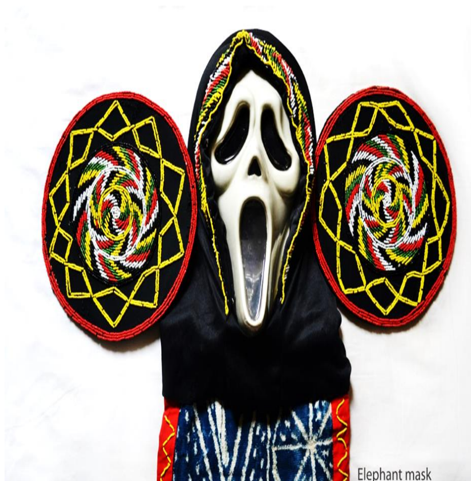
Image 4 : Masque hybride, née de la fusion entre le masque éléphant Bamiléké (Cameroun) à droite et scream mask (Chine – USA) à gauche.

L'image 2 présente un masque de festivités d'Halloween : il est constitué au centre de la silhouette d'un crâne humain. La stylisation de ce crâne, l'expression qu'il dégage font penser au Cri d'Edvard Munch autant qu'au masque du tueur dans la série des films d'horreur hollywoodiens Scream . Les espaces réservés aux yeux, au nez et pour la bouche sont vides, creux. Il est recouvert aux bordures par une sorte de cagoule de couleur noire. Le masque éléphant, présenté à droite, a une très grande symbolique chez les Bamilékés, peuple habitant la région de l'Ouest Cameroun. Il est la stylisation d'une tête d'éléphant où l'on distingue la trompe (très longue), les oreilles et l'espace du crâne. L'espace des yeux en principe creux, est garni de tissus noir, le nez et la bouche sont suggérés, la limite entre le menton et la trompe est marquée par une bande rouge. Le sommet est marqué par de petites sphères de couleur blanche et noire. Les contours du masque et de chaque détail sont faits de couleur rouge. L'espace interne du masque éléphant du Cameroun est marqué par des motifs perlés de diverses couleurs (bleu, blanc, orangé).