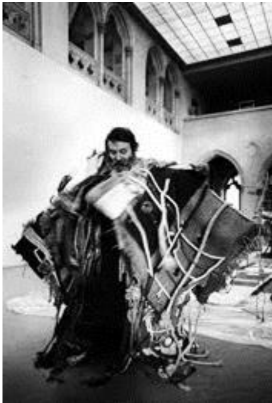
Images 18: Présentation de l'œuvre de portée par l'artiste Etienne Martin

parcours laborieux de l'enfant à l'adulte. En effet, pour moi, Manteau (Demeure 5) est un travail en profondeur de l'artiste sur lui-même, sa vie de son enfance à l'âge adulte et marqué par tous ce par quoi il a pu passer, ses sentiments et émotions complexes.