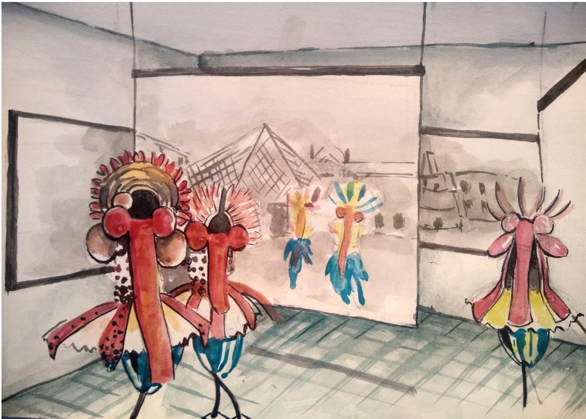
Œuvre 12: Croquis présentant une disposition des différentes conceptions,

Cette image permet d'apprécier la disposition des différentes conceptions à savoir : peintures sur tapis, peintures sur toiles et sculptures (costumes) mises ensemble dans l'idée de former avec une performance une seule et même œuvre.