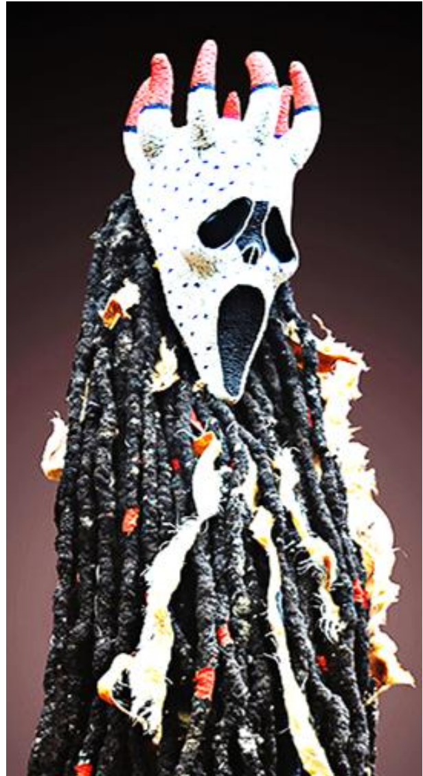
Image 5: Masque Hybride, origine : Scream mask (Chine – USA) et Bamiléké (Cameroun).

Sur ces deux images, nous avons à gauche le masque original Kounga , qui est faite de cornes d'animal (de bœuf) au sommet, enroulées de morceaux tissus rouge, des cauris blanc et de mèches de chevelure noire, et à droite un masque hybride née du croisement entre le masque Kounga et le Scream Mask . L'artiste sur cette réalisation, a utilisé la structure d'un Scream