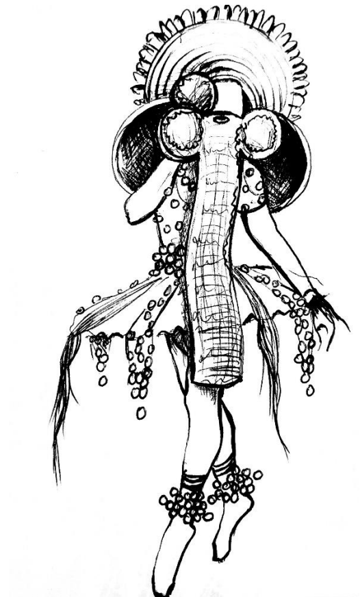
Œuvre 9: Croquis costume hybride sur mannequin 2

Date de réalisation : Juin 2020 Réalisation de l'œuvre : Franck Kemkeng Noah.