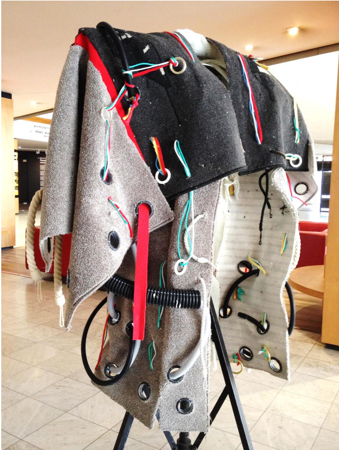
Œuvre 7: Titre - Manteau (souffle du trajet).Vue de face