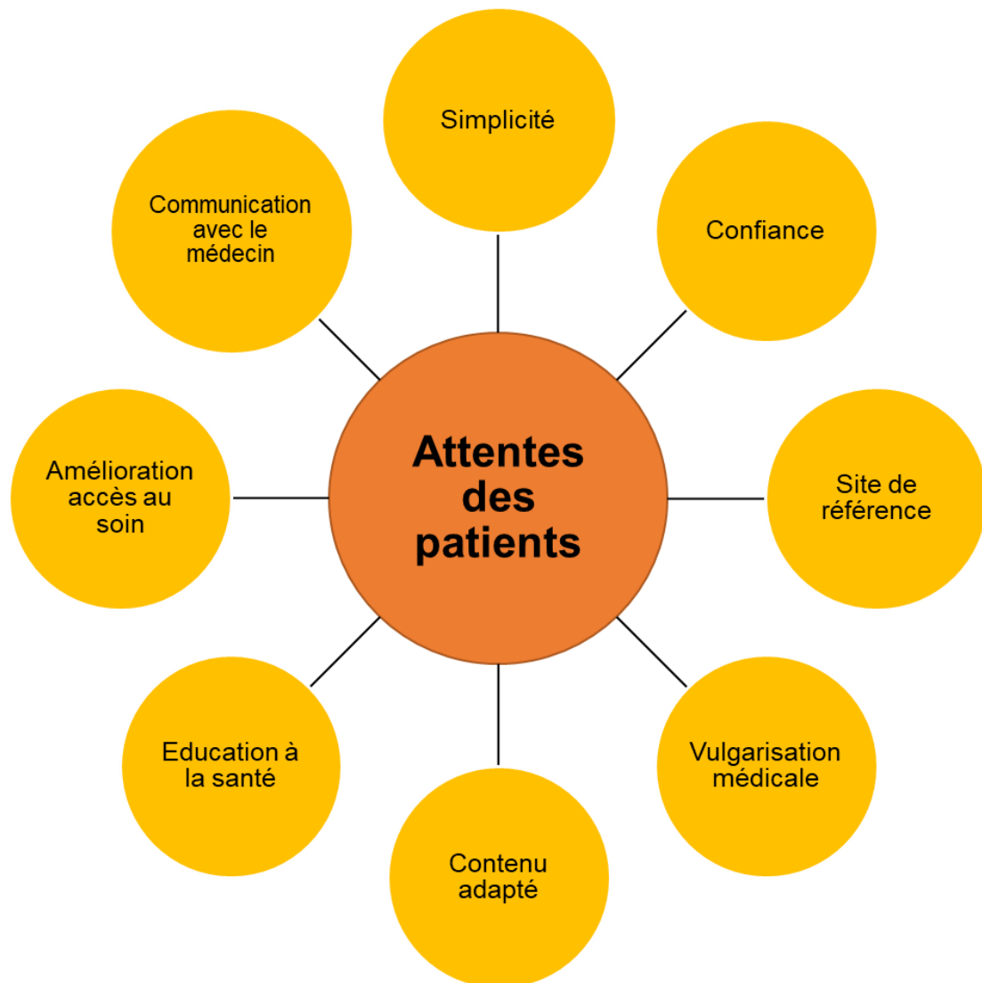
Figure 2: Attentes des patients concernant le site internet

Finalement, dans notre étude, nos patients souhaitent avoir à disposition un site simple, avec une navigation fluide. Ce site servirait de site de référence grâce à la confiance qu'ils accordent à leur médecin traitant. Le contenu doit cependant être adapté pour un public profane grâce à de la vulgarisation médicale. Le site peut être